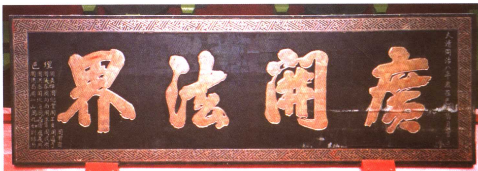
“廣開法界”匾額——清·同治年間立