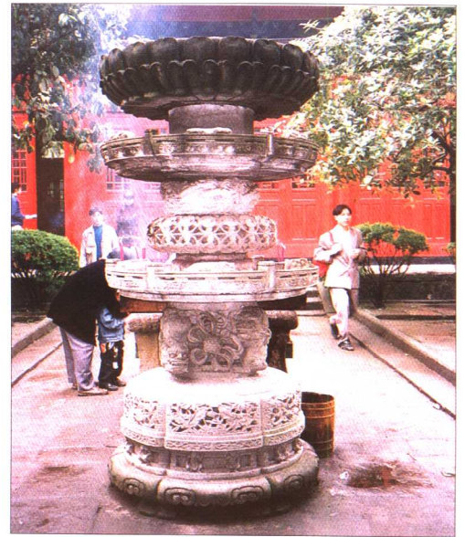
寺內石雕蓮花寶鼎

北溫泉在重慶市西北的北碚郊區。為重慶市著名的風景名勝之一。背負縉雲山，瀕臨嘉陵江，依山傍水，因地闢園。整個園林呈狹長臺階形，設計別致，布局得體，清泉瀑布，熔岩深壑，蒼翠欲滴，引人入勝。溫泉寺始建於五世紀初，後幾經興廢，原寺建築早已不存在。現在寺廟為明清以後建造。主要殿宇有鐵瓦殿（亦名觀音殿）、大佛殿、接引殿、關聖殿。其中大佛殿建於明宣德年間，接引殿建於明景泰年間。泉水溫度 32°C-37°C，自流量較大。園內除闢有游泳池外，並設有室內浴池。