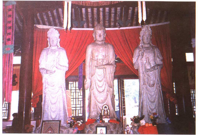
鐵瓦殿內觀音石雕像

北溫泉在重慶市西北的北碚郊區。為重慶市著名的風景名勝之一。背負縉雲山，瀕臨嘉陵江，依山傍水，因地闢園。整個園林呈狹長臺階形，設計別致，布局得體，清泉瀑布，熔岩深壑，蒼翠欲滴，引人入勝。溫泉寺始建於五世紀初，後幾經興廢，原寺建築早已不存在。現在寺廟為明清以後建造。主要殿宇有鐵瓦殿（亦名觀音殿）、大佛殿、接引殿、關聖殿。其中大佛殿建於明宣德年間，接引殿建於明景泰年間。泉水溫度 32°C-37°C，自流量較大。園內除闢有游泳池外，並設有室內浴池。