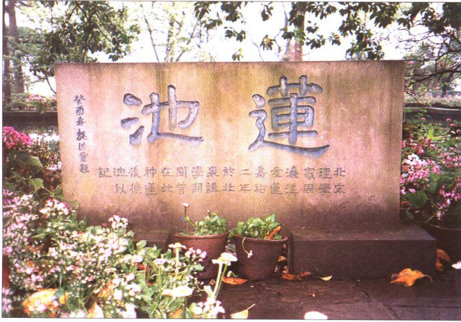
“蓮池”石刻：“北宋理學家周濂溪愛蓮嘉祐二年於北泉講學期間曾在此種蓮後擴池以記”——魏洪發題