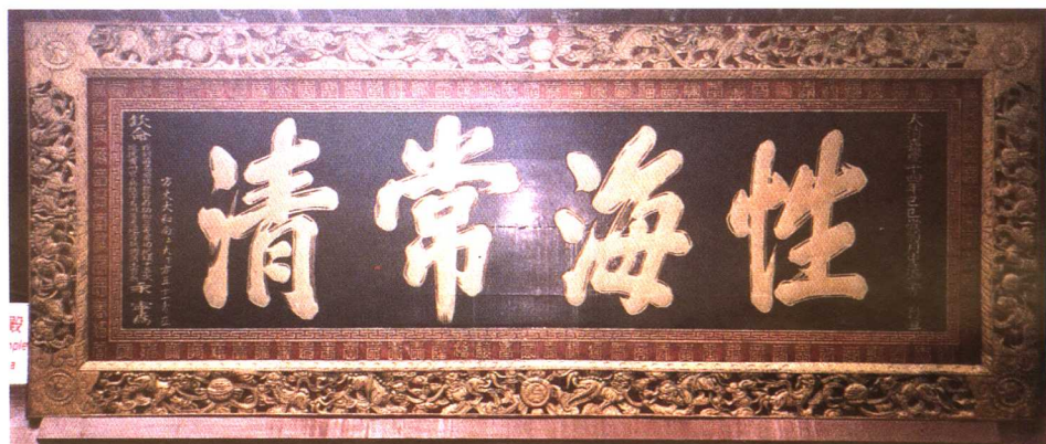
“性海常清”匾額——清·嘉慶年間立