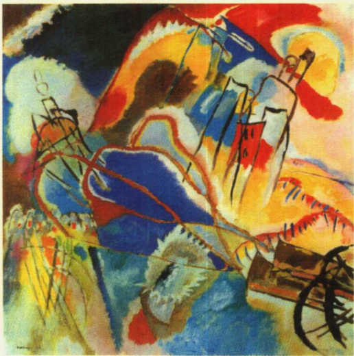
《即兴30号》 布上油画 110×110cm 1913年

(只要作为个体的种族能够继续生存)；3. 那些以抽象状态存在的艺术元素的要求，它们期待着物质化，这包括个人的、时间的和永恒的元素的要求，其中前两个元素随着时间流逝将渐渐减弱，而第三个元素却保有永恒生机。康定斯基认为，十九世纪末和二十世纪初是人类精神的一个伟大时期。他称之为“伟大精神的新纪元”。