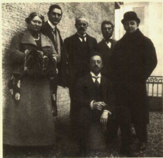
康定斯基（中间坐者）和玛利亚（左一）、弗兰茨·马尔克（左二）等人合影 1912年

了自己的第一幅抽象画。1912年，他创作了系列无物象的蚀刻作品。其著作《论艺术中的精神》由慕尼黑的风笛手出版公司出版，并在一个冬季连印三次。在日报、专业杂志和艺术书籍中，笔战依然不休，但支持他的声音在不断加强。1913年，随着赫沃斯·瓦尔登成为新艺术家协会的负责人，壁垒随之而去，德国、奥