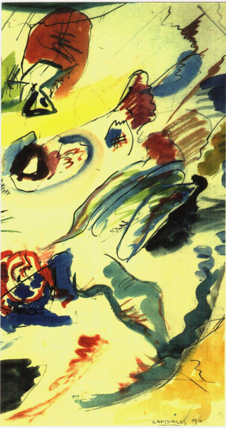
《无题》 水彩、墨水、 铅笔、纸板 49.6×64.8cm 1910年 康定斯基自认为的第一幅 水彩抽象画应该是指这件 作品，但和《自述》中的 1911年有出入。