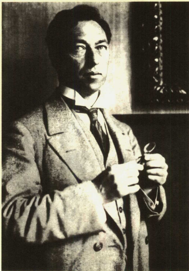
1913年的康定斯基 慕尼黑