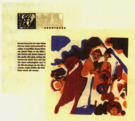
康定斯基《声音》一书中的双页 1913年

他的著作《论艺术中的精神》被萨德勒翻译成英文，在伦敦的康斯托布尔出版有限公司出版。当时，康定斯基的一个剧本正在慕尼黑公演，配以展览以及演讲。《论艺术中的精神》的荷兰文、法文、俄文等版本也正在计划中，但因为战争爆发而中止了。1914年，康定斯基回到莫斯科，集中精力研习绘画。1916年，他在斯德哥尔摩完成第二个系列的蚀刻画。1917年和1918年，他在莫斯科致力于解决抽象艺术