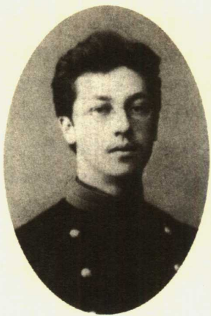
康定斯基在莫斯科大学时期像 1886年

建立于图像意义的纯粹表达之上。他是第一个这样做的画家。1866年，他出生于莫斯科。在莫斯科大学学习，获学位cand. jur.。他被任用为经济和统计学部的教学助手。三十岁时，康定斯基将学院工作的一切抛弃，跑到慕尼黑学习绘画去了。他在阿兹贝工作室学画两年，在艺术学院随弗兰茨·斯图克（Franz Stuck）学画一年。他开始参加展览，很快就遭到许多批评家的口诛笔伐，画作被指责为“夸张的线条和肮脏、刺眼的色彩”。不久后，他成为巴