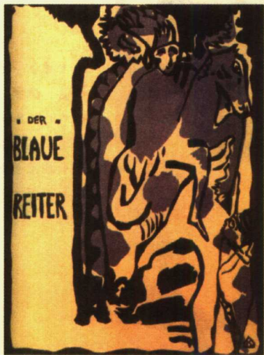
康定斯基设计的《青骑士年鉴》杂志封面 彩色木刻 27.9×21.1cm 1912年

纯抽象和纯现实之间画了等号。他在另一篇文章《关于舞台形式》中附录了剧本《黄色的声音》（由托马斯·哈特曼作曲）。风暴出版社出版了《康定斯基画册》，其中复制了艺术家1901—1913年间的大量作品。1914年，风笛手出版公司出版了他的《声音》，这是一本包括少量诗歌作品和不少木刻作品的豪华限量书。