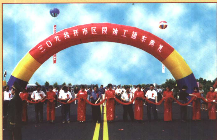
三〇九线环市区段竣工通车典礼