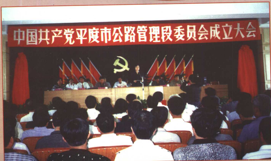
平度市公路管理段党委成立大会会场。