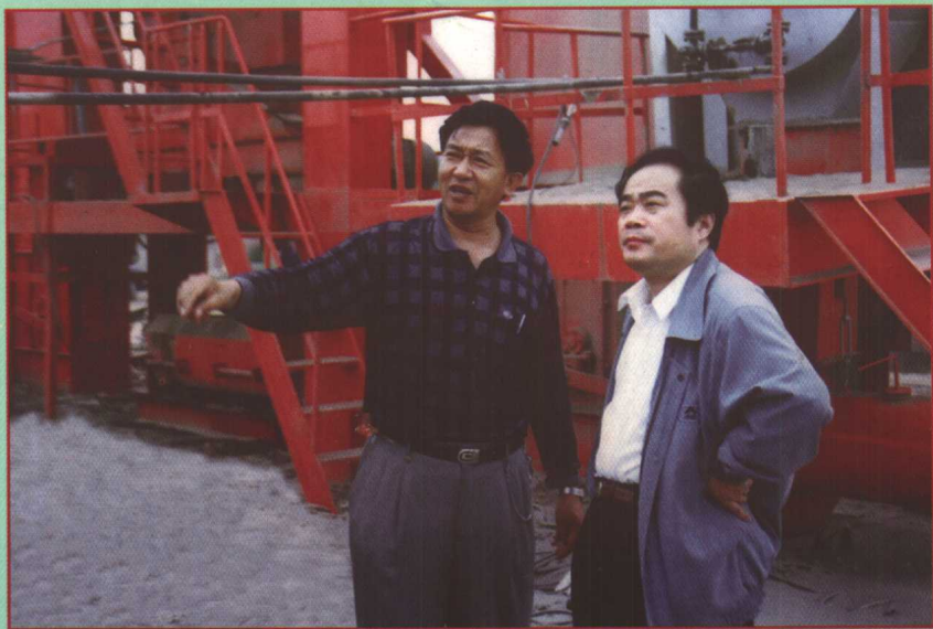
平度市委书记张相逢（右）视察市公路管理段下属拌和场。