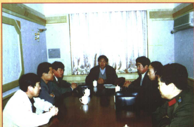
公路管理段 党委全体成员举 行第一次会议。