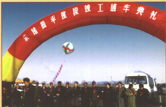
朱诸路平度段竣工通车典礼