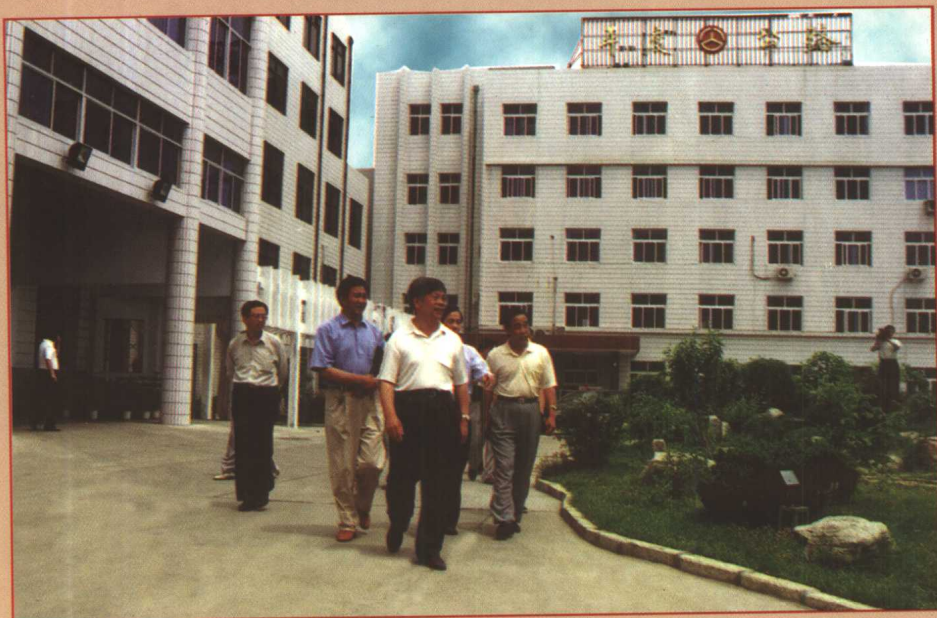
山东省交通厅副厅长张秀山（左三）到平度市公路管理段检查工作。