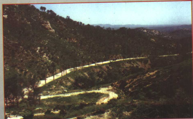
穿越大泽 山区的市乡公 路长大路。