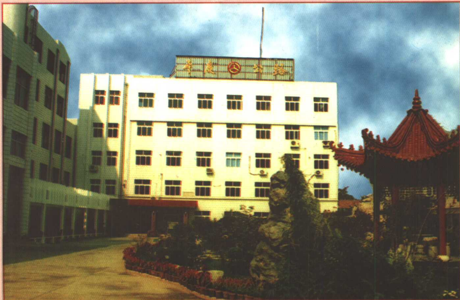
办公楼及花园式庭院