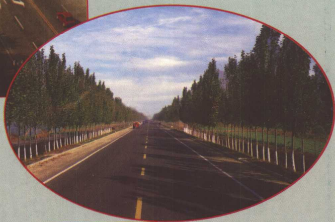
省道朱诸路 (莱州市朱桥至诸城市)平度段。