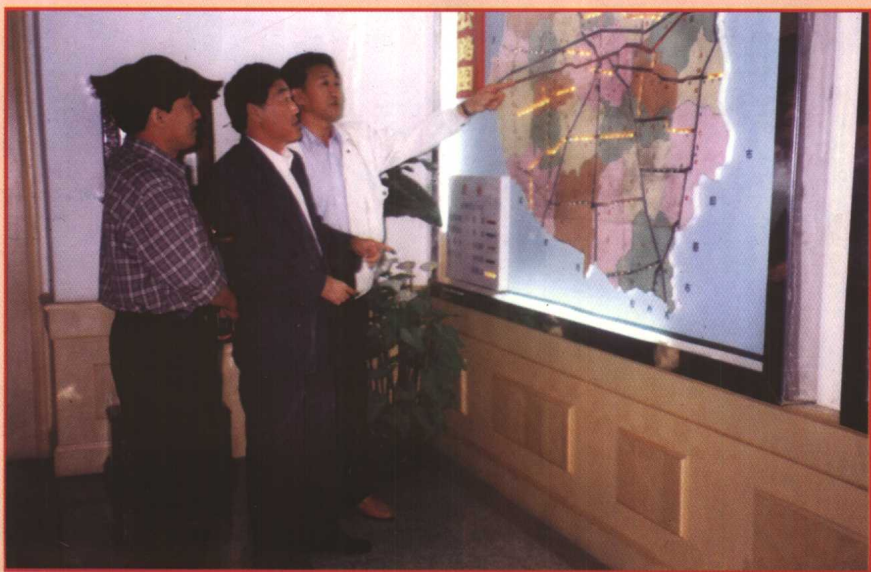
青岛市交通局局长谭志海（中）到平度市公路管理段检查工作。