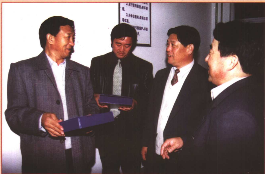
青岛市交通局党委书记王寿志（右二）到店子公路站检查工作。