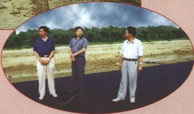
平度市政协主席任福堂（中）、副主席崔鹏坤（右）视察新铺筑的沥青路面。