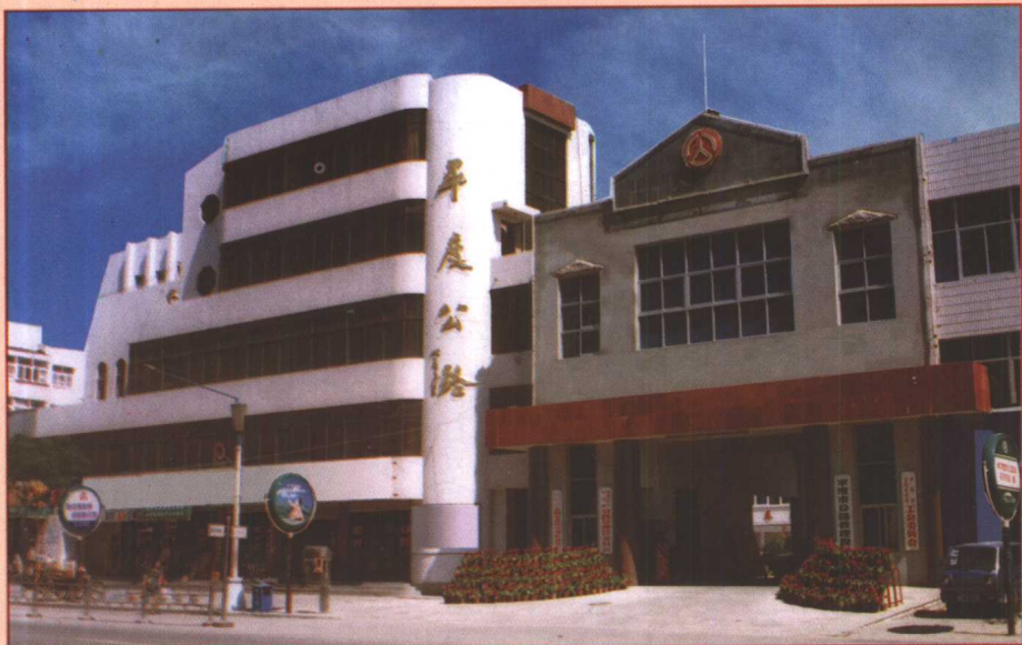
平度市公路管理段