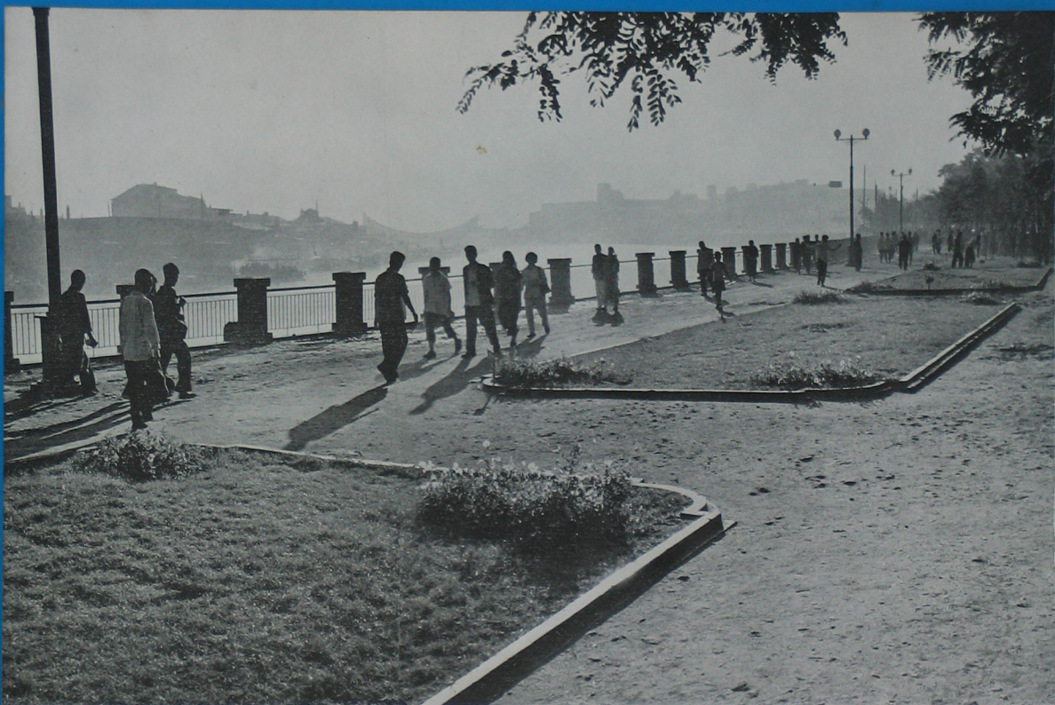
河濱漫步(海河公園)