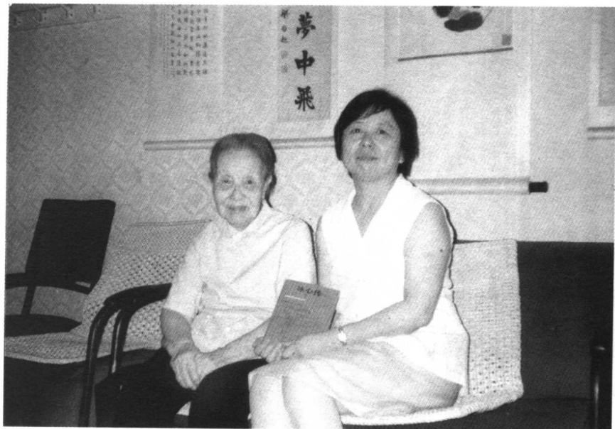
冰心与肖凤合影。 1988年夏，在冰心先生家 客厅。