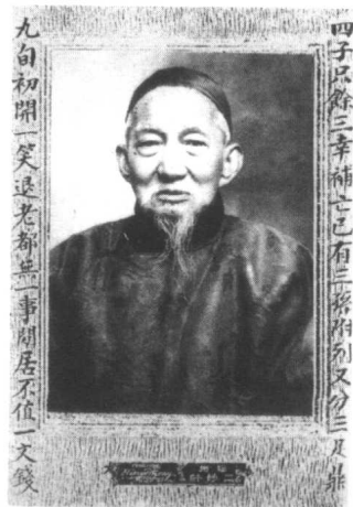
冰心的祖父谢子修老先生。

冰心七个月时就离开了她祖父的大家庭，所以她当然不会记得这个幽静的大院子在当时的景象。虽然她十一岁时也曾返回过她的出生地小住了一年多，但这座大院子，还有它的清澈的池子以及游荡其中的小金鱼，并未成为她后来创作灵感的源泉。因为她童年时代的绝大多数时间，是在山东烟台的大海旁边度过的。北方的大