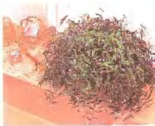
把体积较大的蔓草“新娘面纱”放在窗前，便成了具有浪漫气息的摆设。如果和咖啡色的窗帘等相搭配，那无疑是雍容华贵的精心装饰。 ●蔓草的培育方法见第42页。