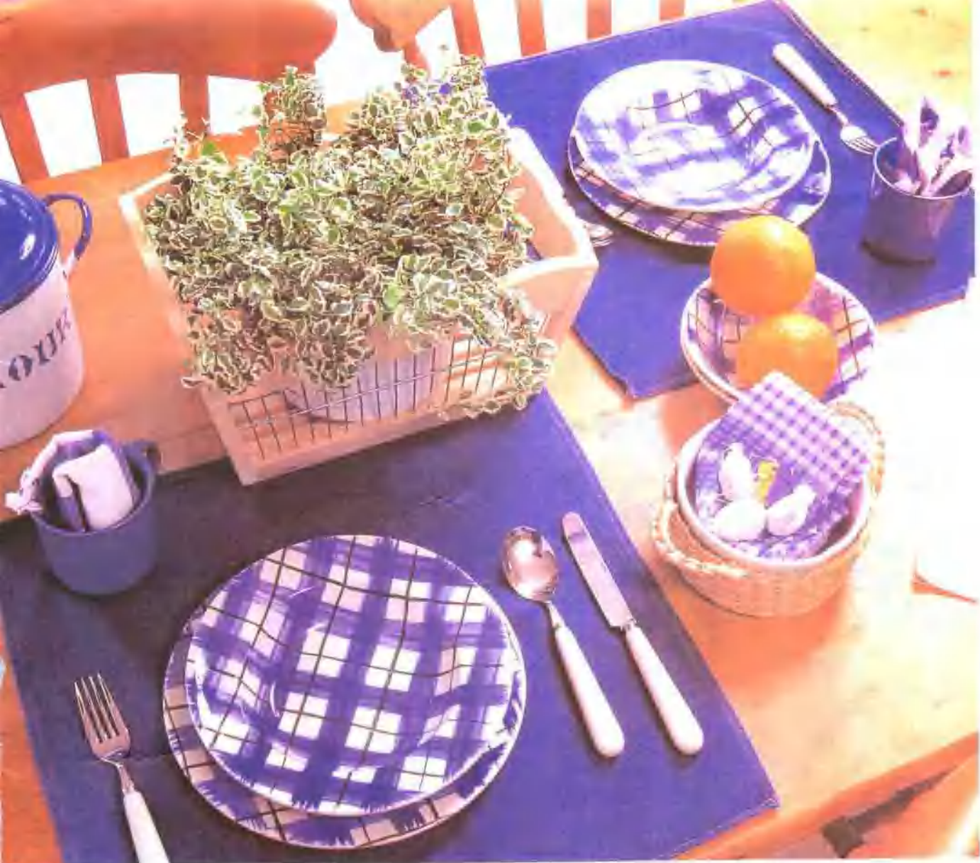
桌上的垫布若加入一点植物的绿色，能给人一种清新之感。白色和绿色叶子兼有的花叶蔓长春能为餐桌增添异彩 ●图中花叶蔓长春的培育方法见第35页。