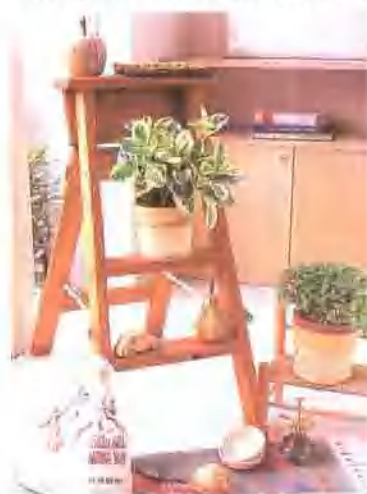
●不仅在搁板及家具上放置观叶植物，如果在这种搁板上也放置观叶植物的话，也必会成为屋中出色的亮点。这时一定要选择大叶植物如花叶蔓长春等。 ●图中右边的冷水草的培育方法见第28页，左边的花叶蔓长春的培育方法见第35页。