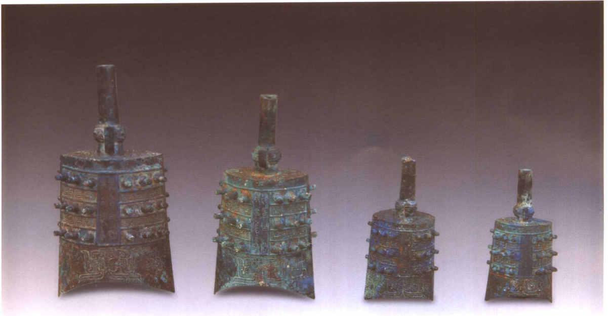
2. M2001 : 50、51、46、47