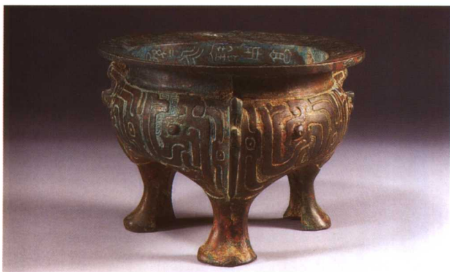
2. 虢季鬲 M2001 : 70