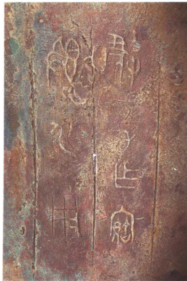
3. 虢季簋 M2001 : 86(盖铭) 4. 虢季簋 M2001 : 86(底铭)