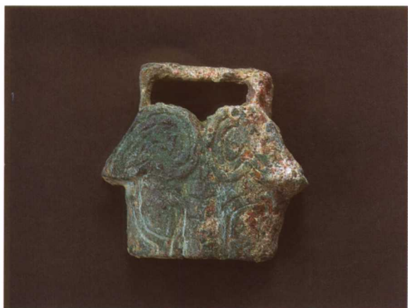
3. 兽面形带扣 M2001 : 215