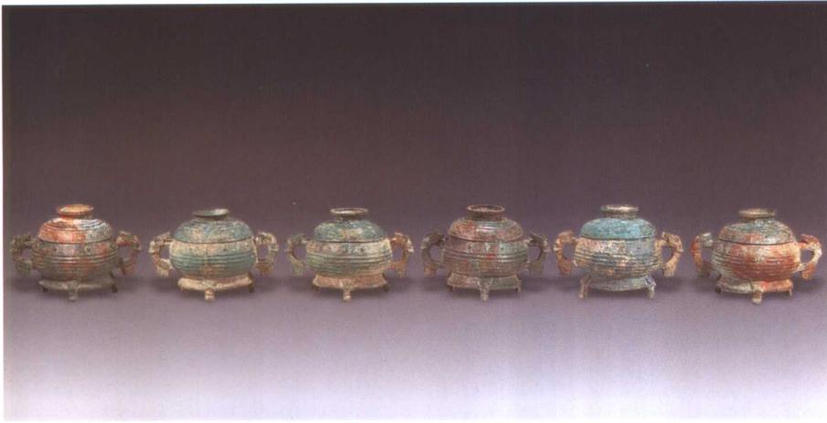
1. 虢季簋 M2001 : 146、75、86、95、67、94