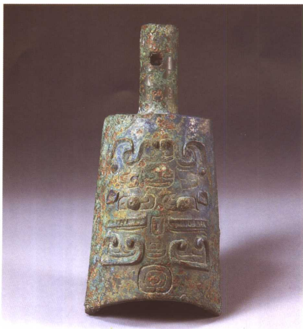
2. 兽面纹钲 M2001 : 76