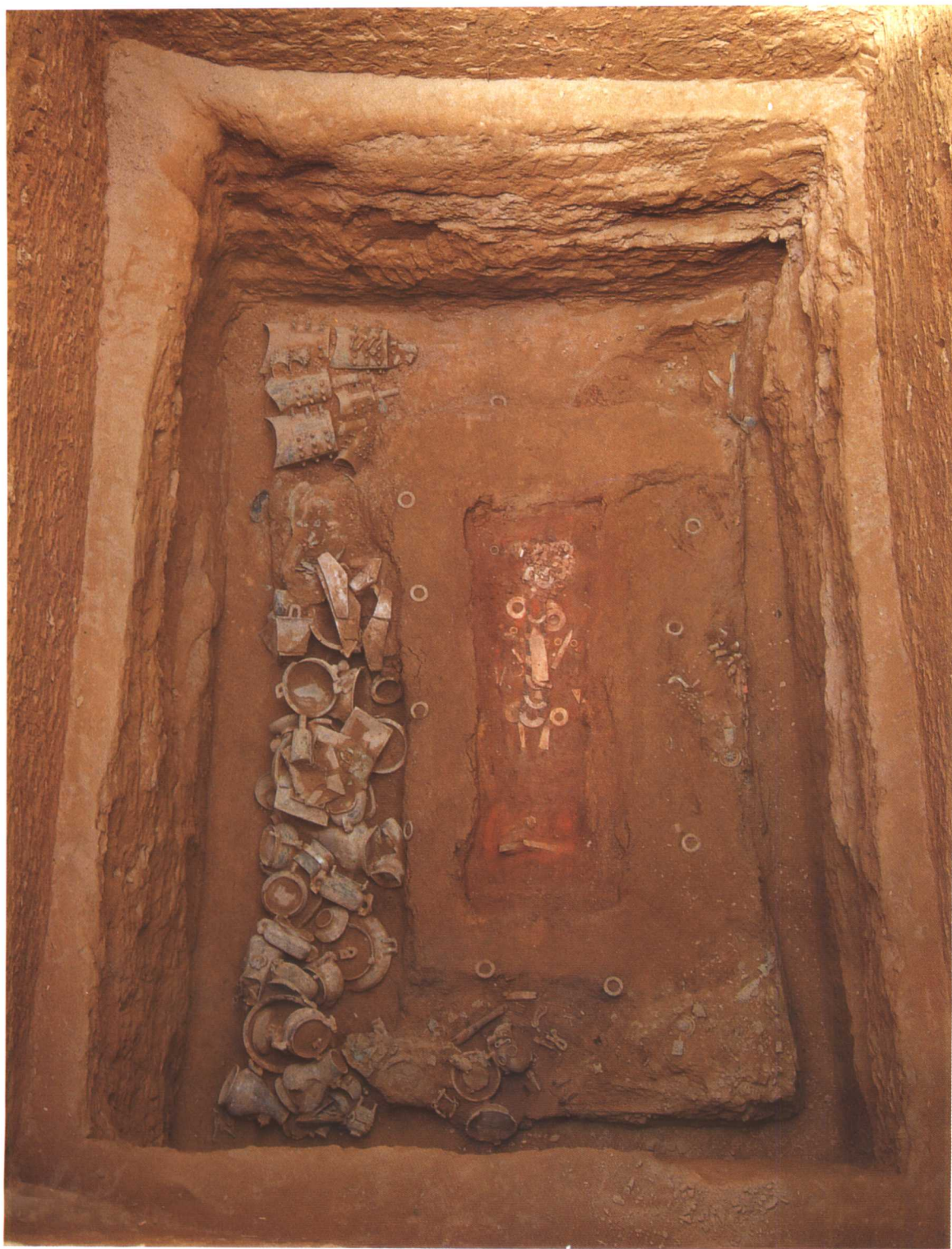
M2001 底部随葬器物 (南-北)