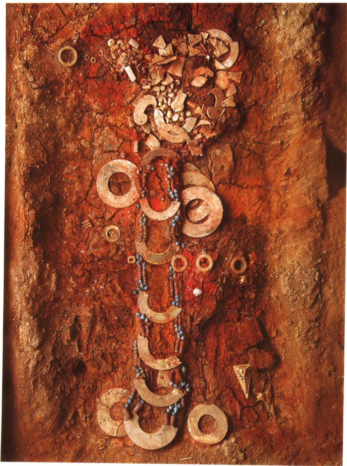
M2001 幘目缀玉与七璜联珠组玉佩出土情况 (南—北)