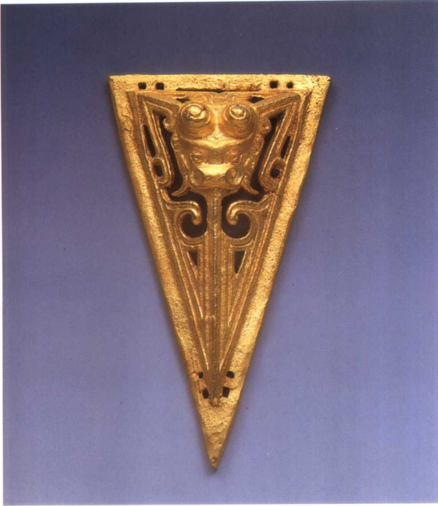
1. 三角龙形带饰 M2001 : 680-6