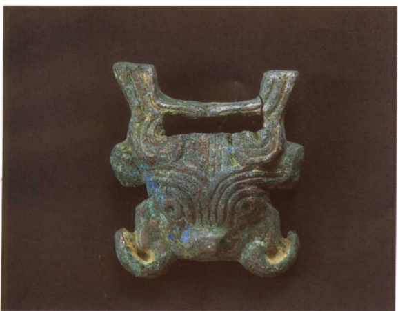
5. 兽首形大带扣 M2001 : 289