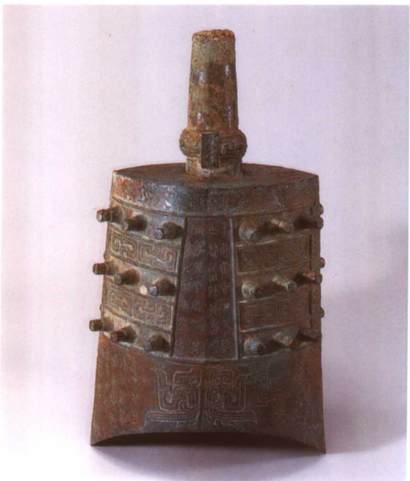
3. M2001 : 48