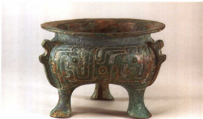
3. 虢季鬲 M2001 : 85