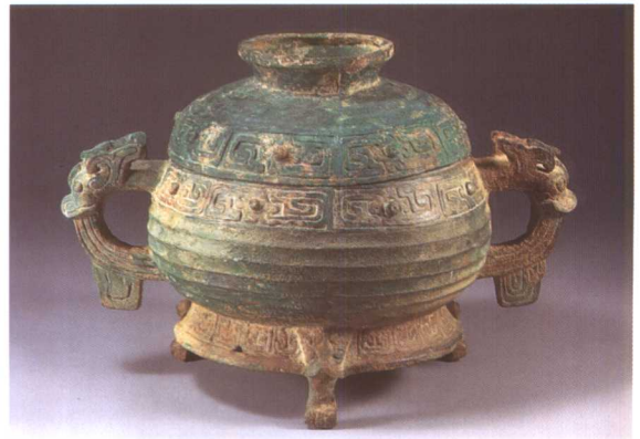
2. 虢季簋 M2001 : 86