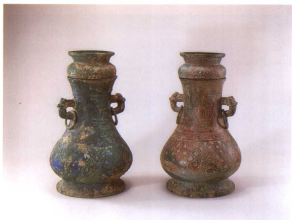
3. 联羽纹圆壶 M2001 : 89、80