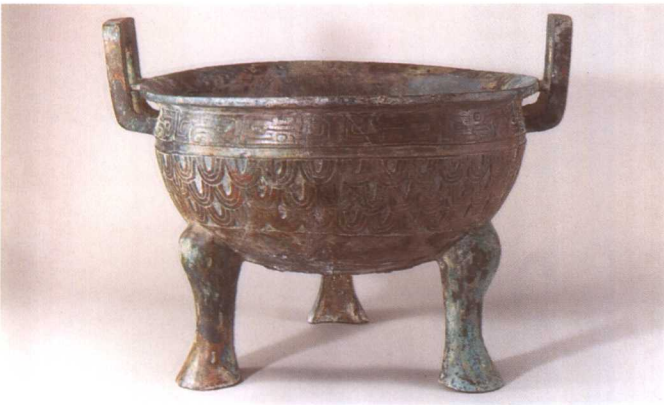
2. 虢季鼎 M2001 : 390