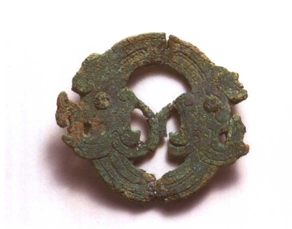
6. 双龙纹圆形饰 M2001 : 541-1