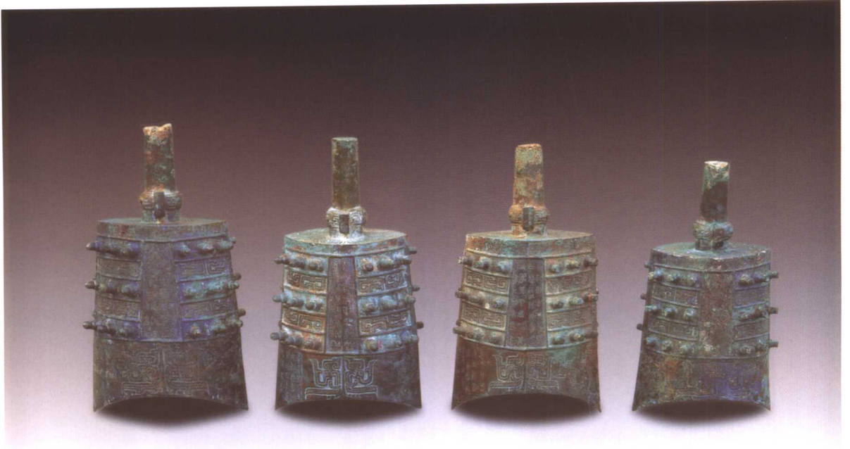
1. M2001 : 45、49、48、44