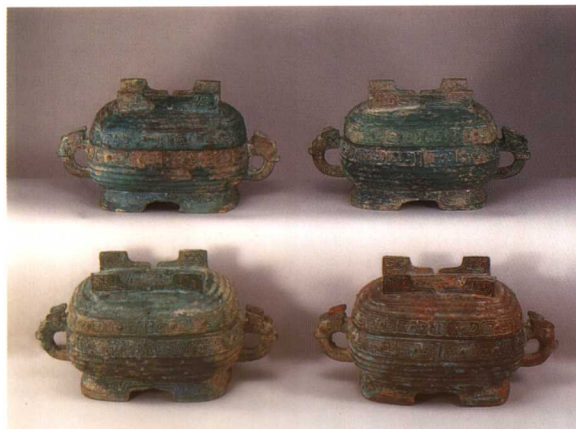
1. 虢季盥 M2001 : 81、97、91、79