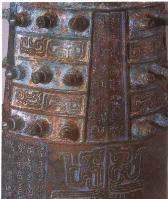
2. M2001 : 49(铭文)