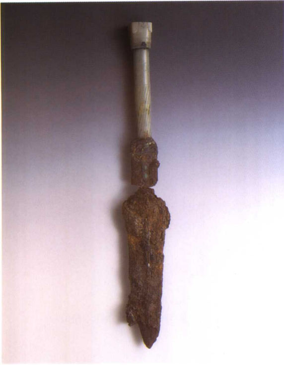
1. 玉柄铁剑 M2001 : 393