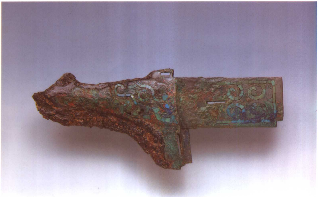
2. 铜内铁援戈 M2001 : 526