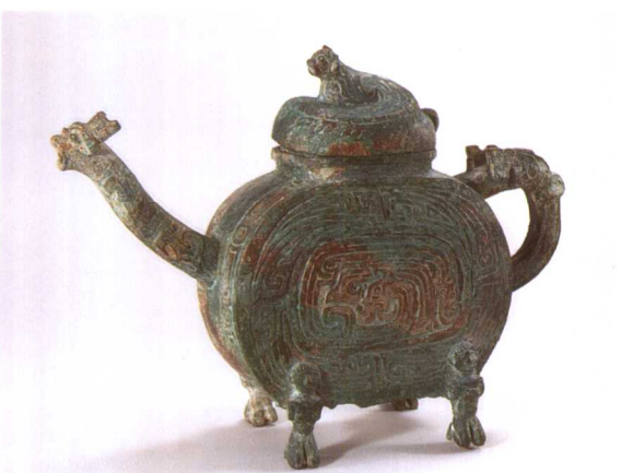
6. 龙纹盃 M2001 : 96