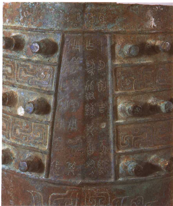
4. M2001 : 48(钲部铭文)