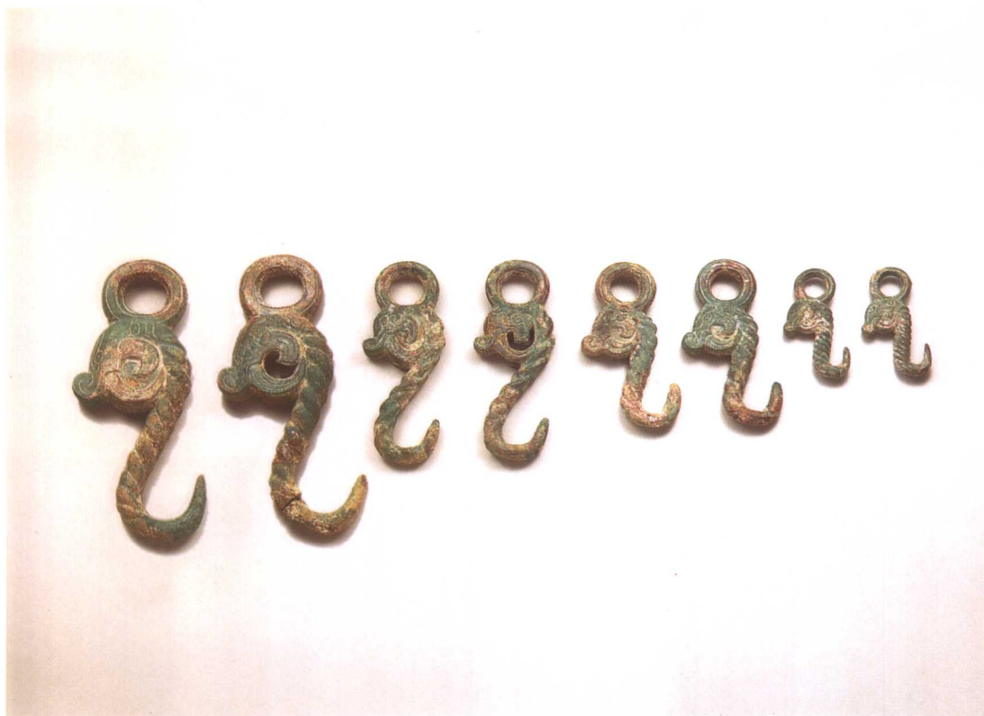
1. 编钟钩 M2001 : 167、136、122、137、138、369、123、220