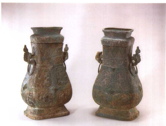
4. 虢季方壶 M2001 : 92、90