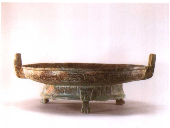
5. 虢季盘 M2001 : 99