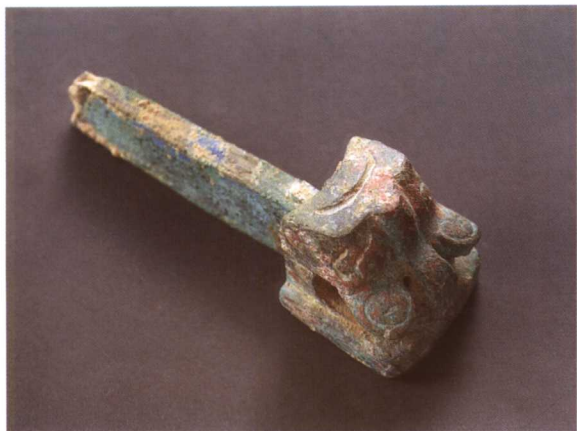
1. 兽首辖 M2001 : 479