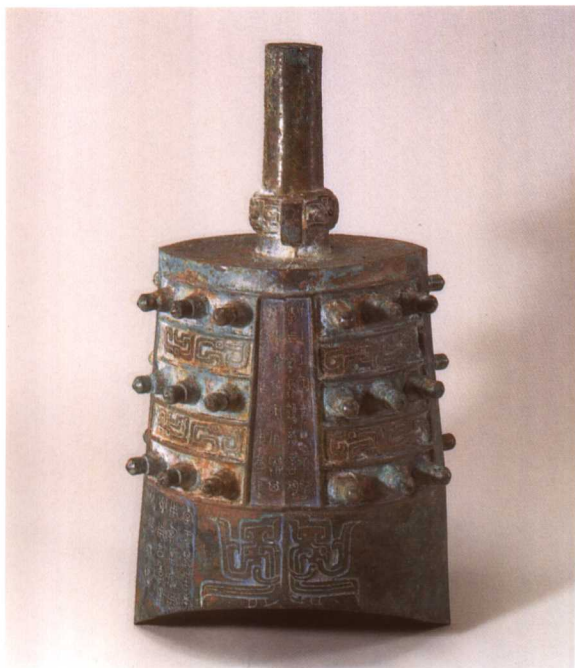
1. M2001 : 49