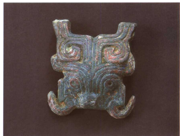
4. 兽首形大带扣 M2001 : 397