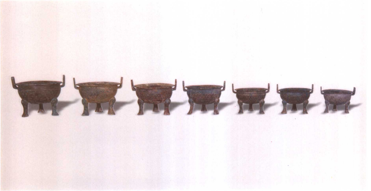
1. 虢季列鼎 M2001 : 390、66、82、83、106、71、72