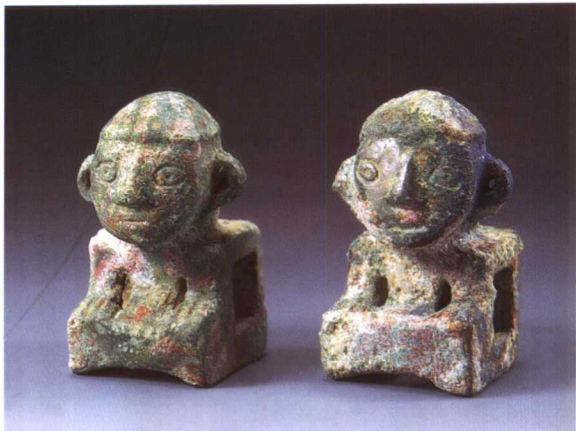
2. 人首辖 M2001 : 124、128