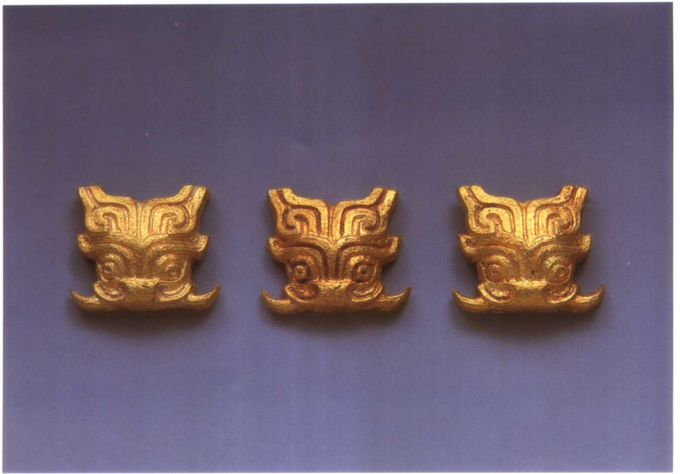
2. 兽首形带扣 M2001 : 680-12、7、5