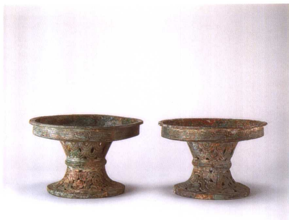
2. 虢季甫 M2001 : 105、148