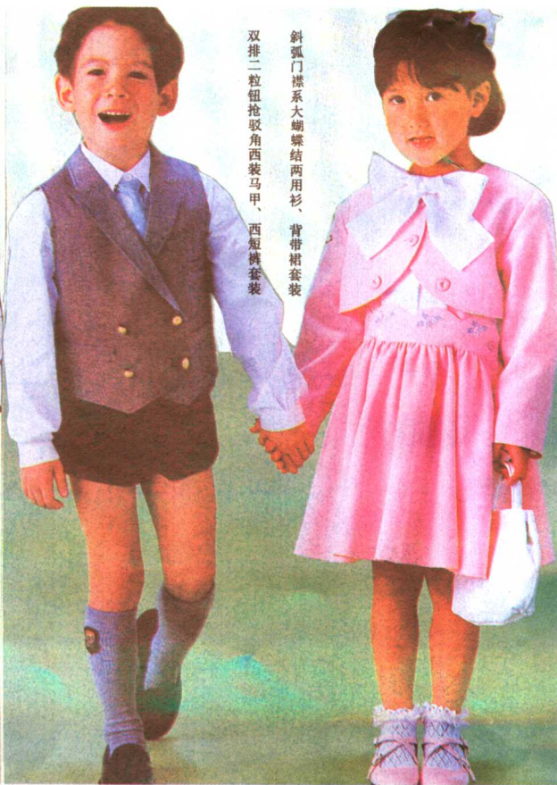
斜弧门襟系大蝴蝶结两用衫、背带裙套装 双排二粒钮抢驳角西装马甲、西短裤套装