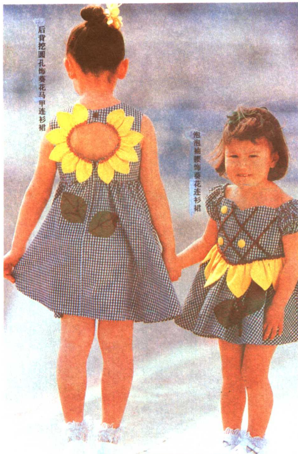
后背挖圆孔饰葵花马甲连衫裙