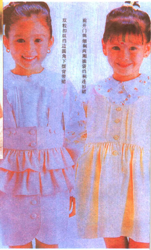
双粒扣双约边圆角下摆背带裙