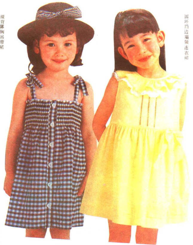
圆环约边塌领连衣裙