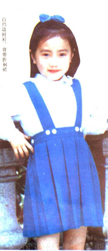
白边衬衫、背带折裉裙