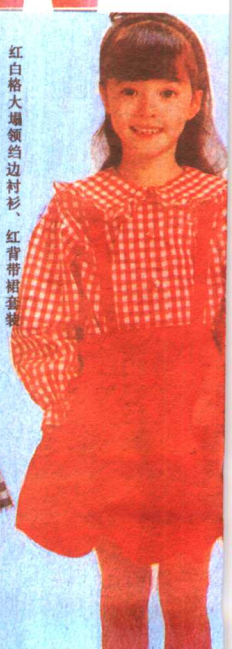
红白格大塌领边边衬衫、红背裙裤套装