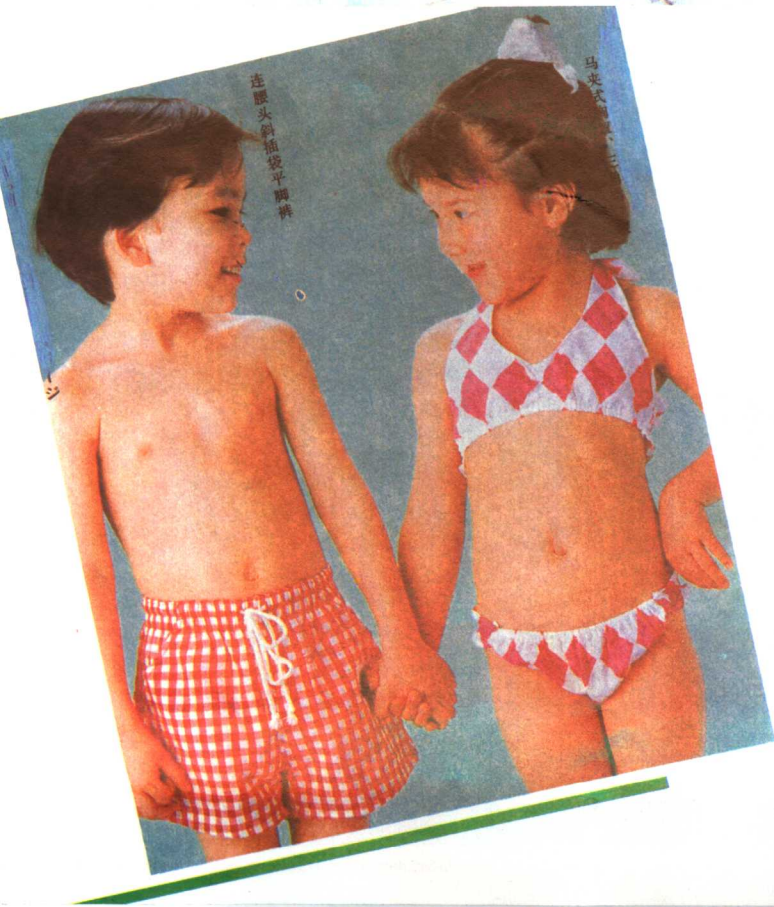
连腰头斜插袋平脚裤