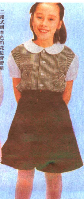
黑白条子衬衫、中长裙裤套装