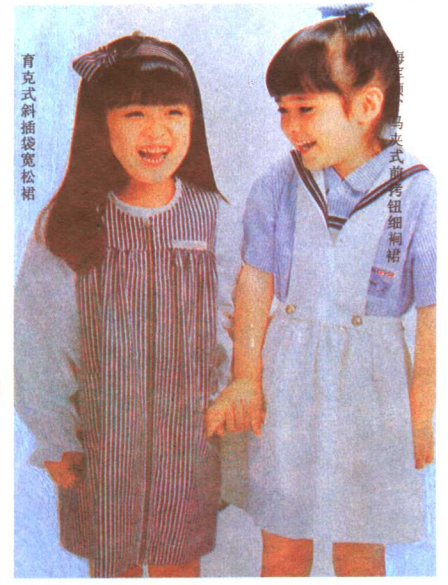
育克式斜插袋宽松裙