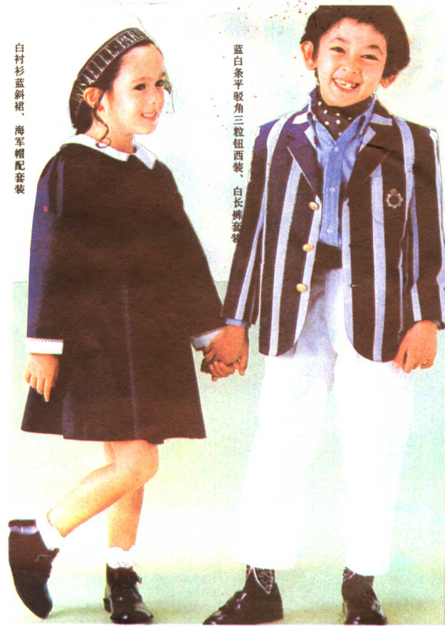
白衬衫蓝斜裙、海军帽配套装