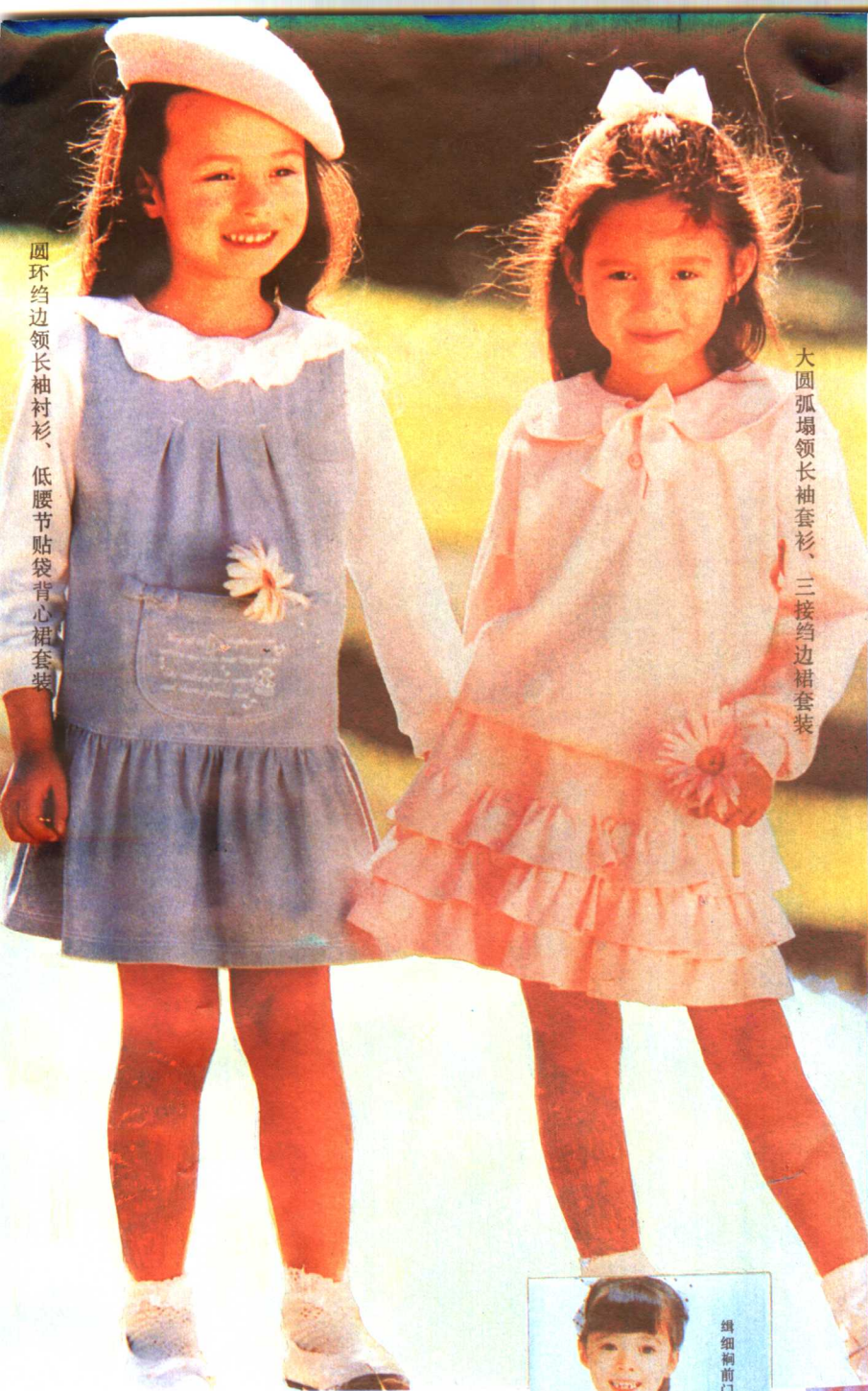
圆环约边领长袖衬衫、低腰节贴袋背心裙套装