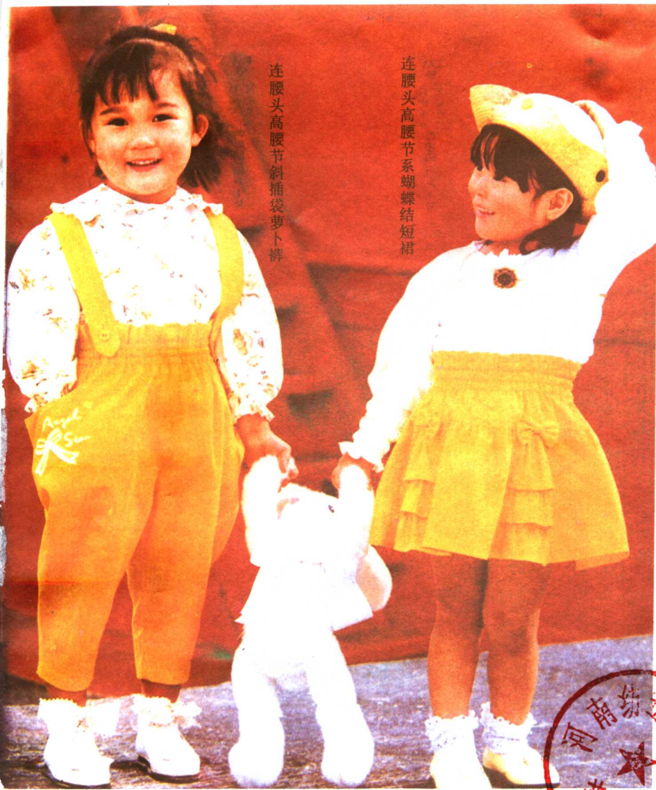
连腰头高腰节斜插袋萝卜裤