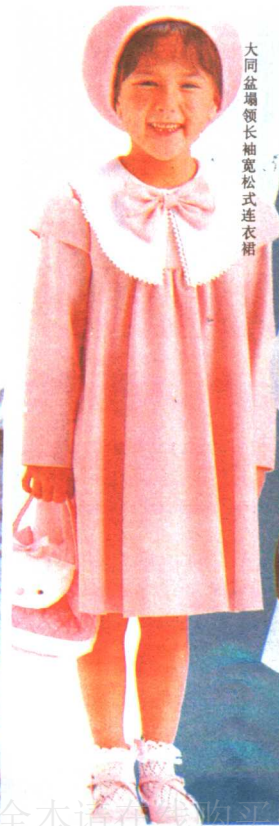
大同盆塌领长袖宽松式连衣裙