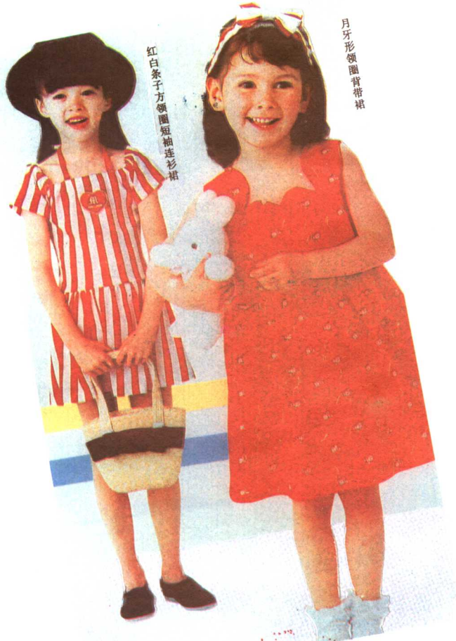
红白条纹方领圆短袖连衣裙