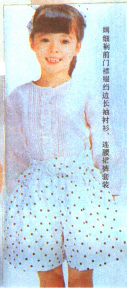
缉细衿前门襟约边长袖衬衫、连腰裙裤套装