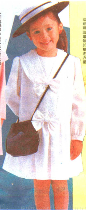
缀蝴蝶结塌领长袖连衣裙