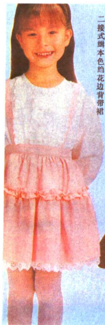
二接式緋本色印花边背裙