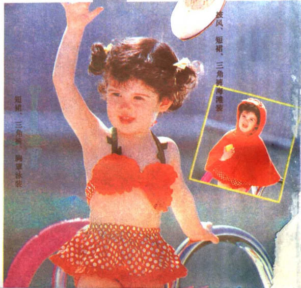
短裙、三角裤、胸罩泳装