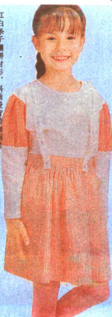
红白条子镶拼衬衫、斜插袋背带细裤裙