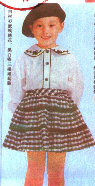
白衬衫嵌线绣花、黑白格三接裙套装