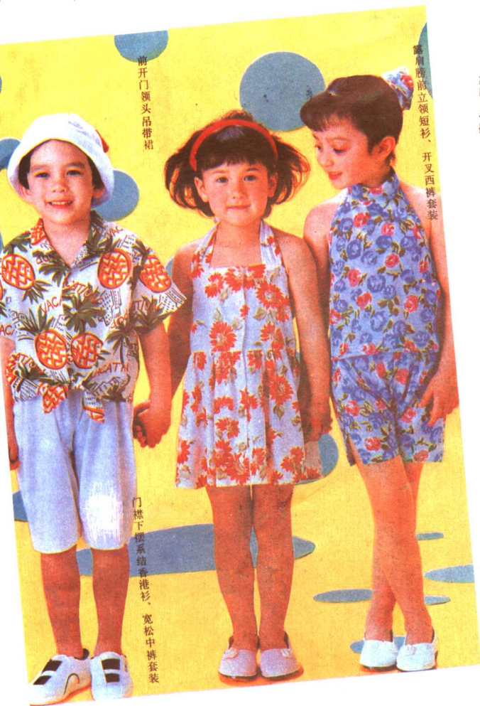
前开门领头吊带裙