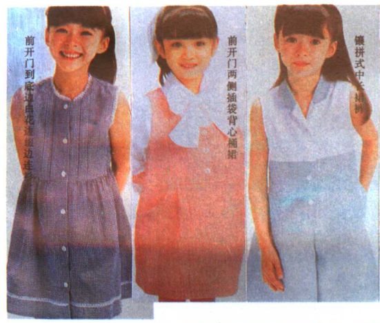
前开门到底边约边连衫裙