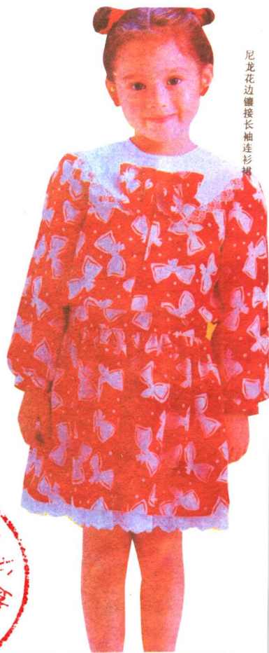
尼龙花边链接长袖连衫裙