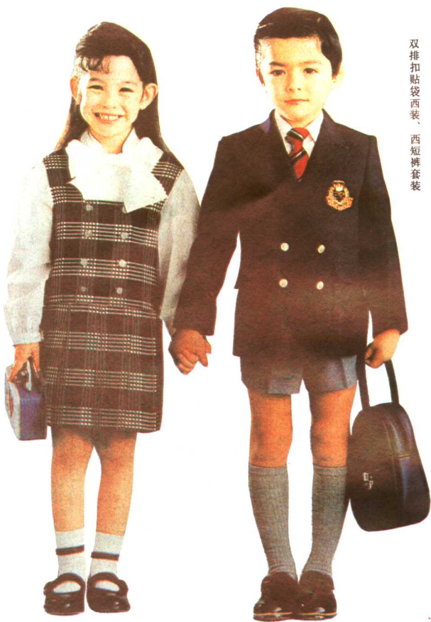
双排扣贴袋西装、西短裤套装