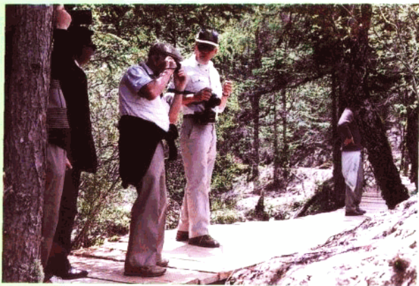
桑塞尔先生、卢卡斯博士等在 九寨沟视察。