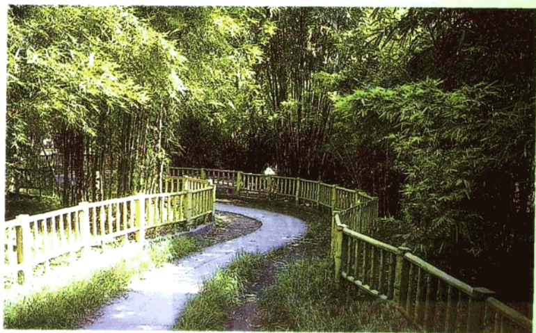
成都望江公园竹林。