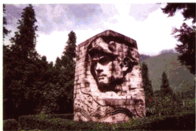
红军强渡大渡河纪念碑。