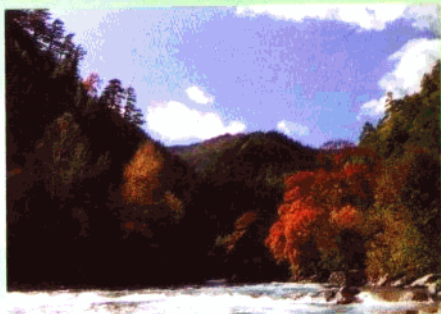
米亚罗红叶。