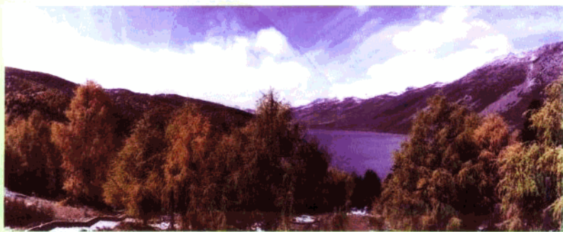
康定木格措秋色。