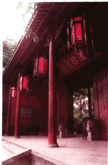
成都武侯祠。