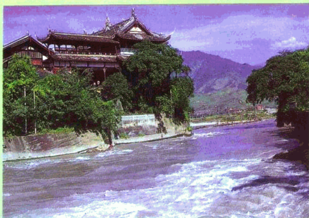
都江堰宝瓶口畔高踞离堆的伏龙观。