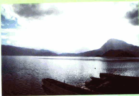
波光粼粼的泸沽湖。