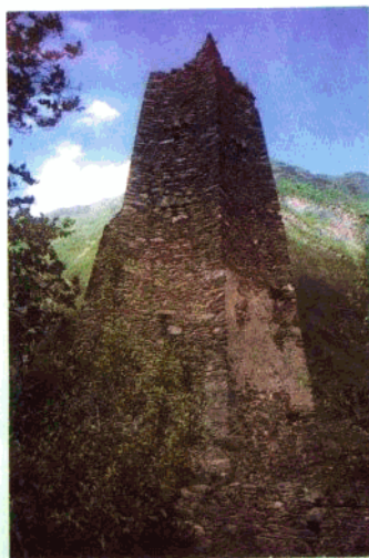
茂县羌族碉楼。(沈皖蜀 摄)