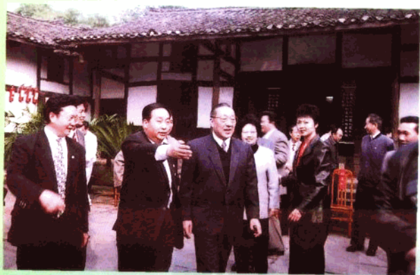
1997年11月2日，中共 中央政治局常委、国务院副总理李 岚清在广安邓小平同志 故居参观。