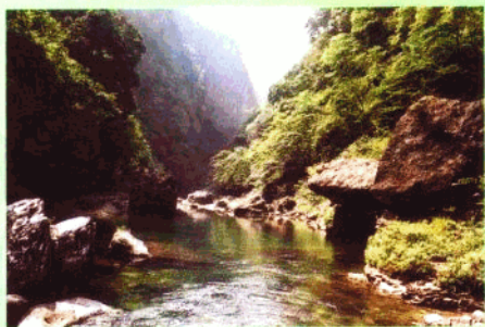
南江光雾山韩溪河峡谷风光。