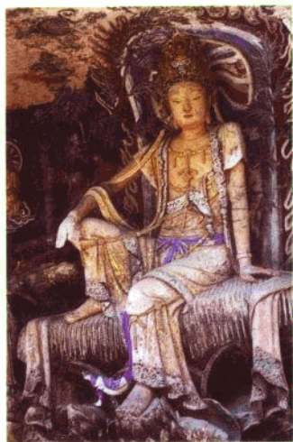
安岳石刻“紫竹观音” 被誉为“东方维纳斯”。