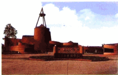
广汉三星堆博物馆外景。