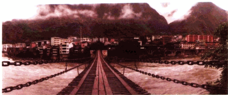
今日泸定桥。