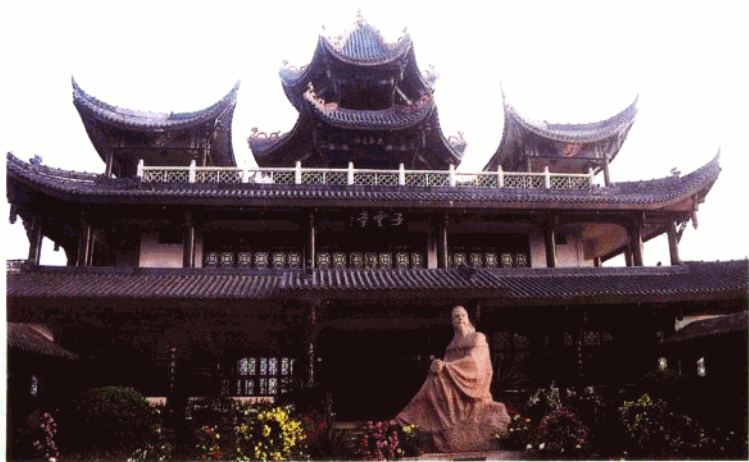
绵阳子云亭。