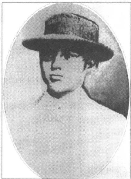
叶剑英入云南陆军讲武学校前的留影