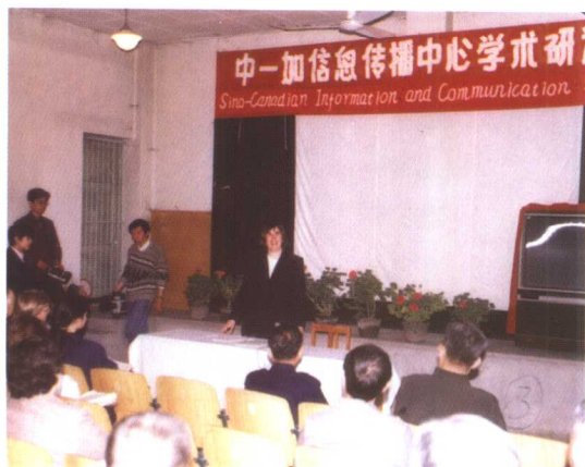
北京广播学院主办的中加信息传播中心(CCICC)学术研讨会上,加拿大代表在发言