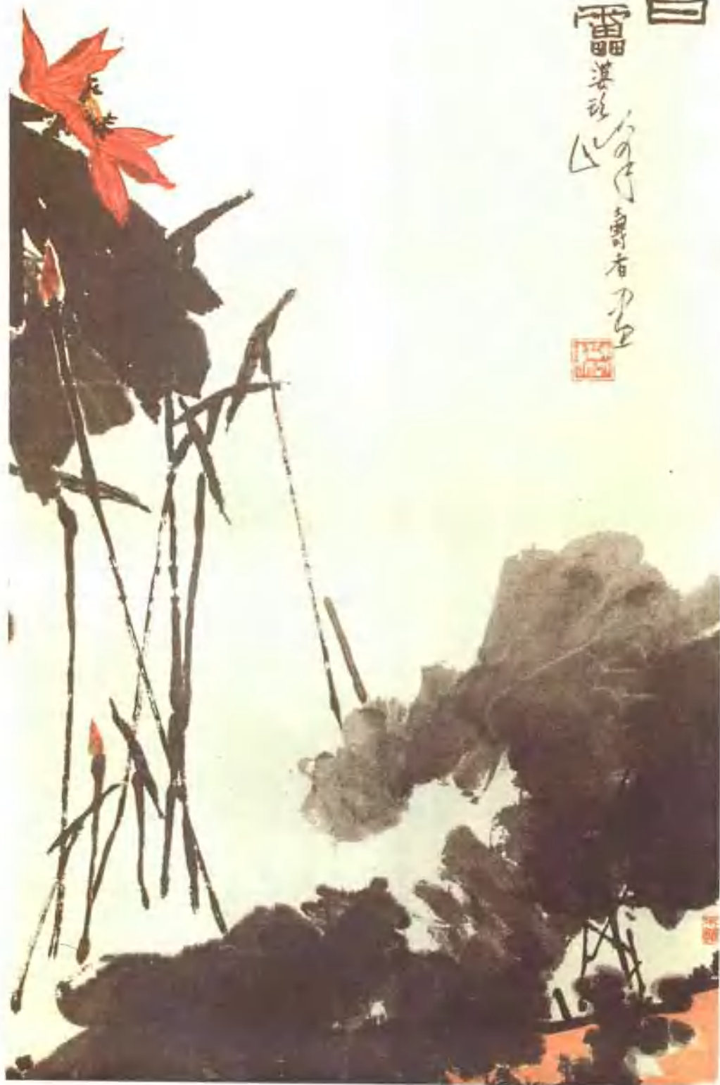
圖15 潘天壽 映日