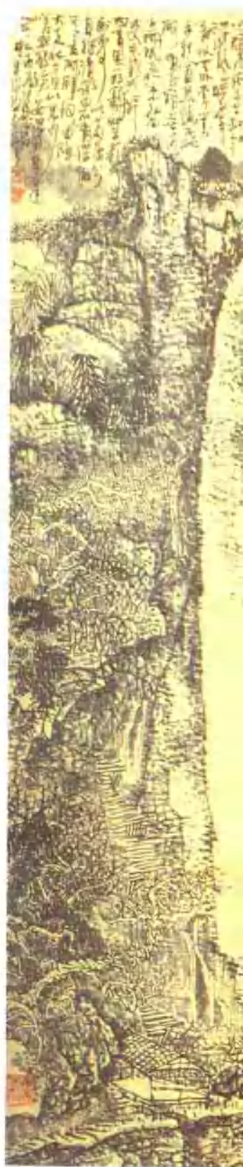
黃秋園 香爐峯疊翠