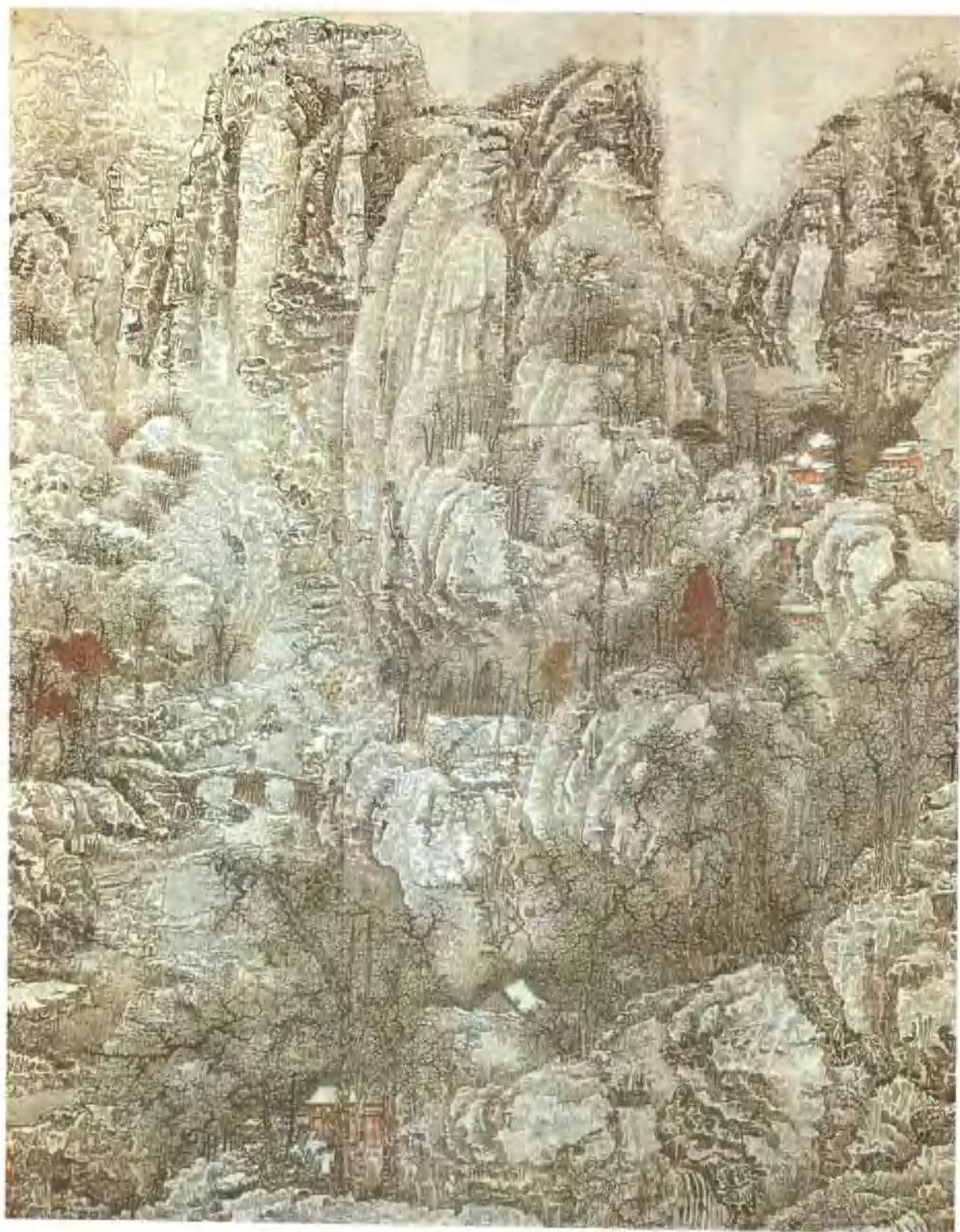
黃秋圖 江山雪景圖