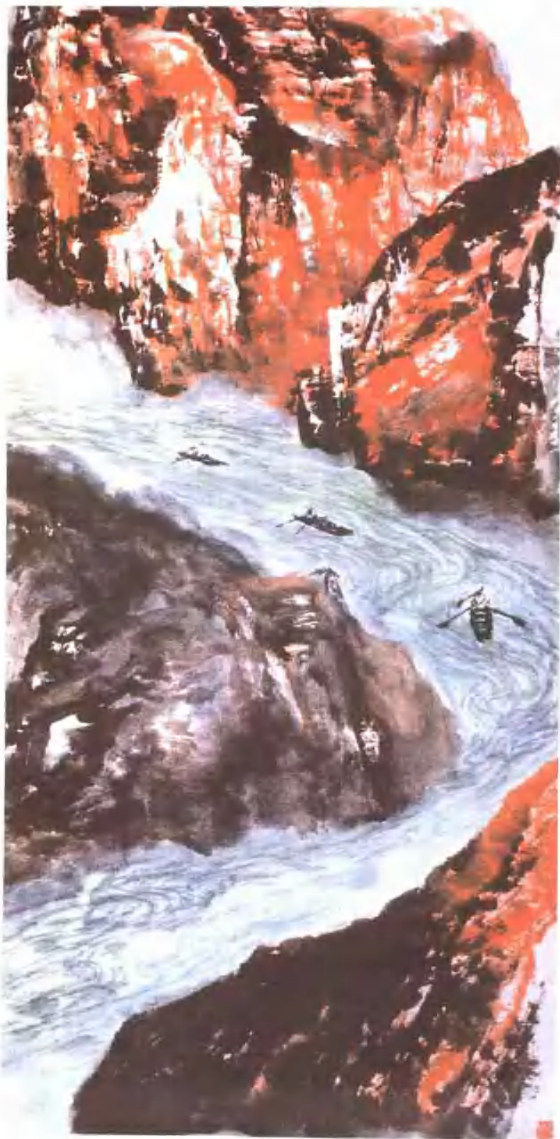
石魯 赤岩映碧流 1961 138×88.5cm