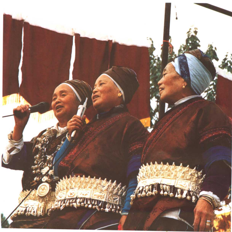
佩银腰带的老人上台卡拉OK