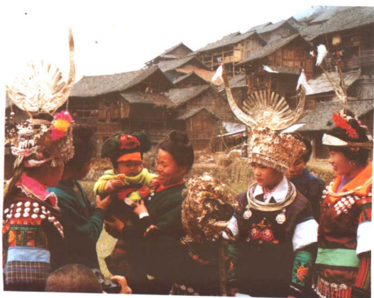
青曼苗装与舟溪苗装大同小异