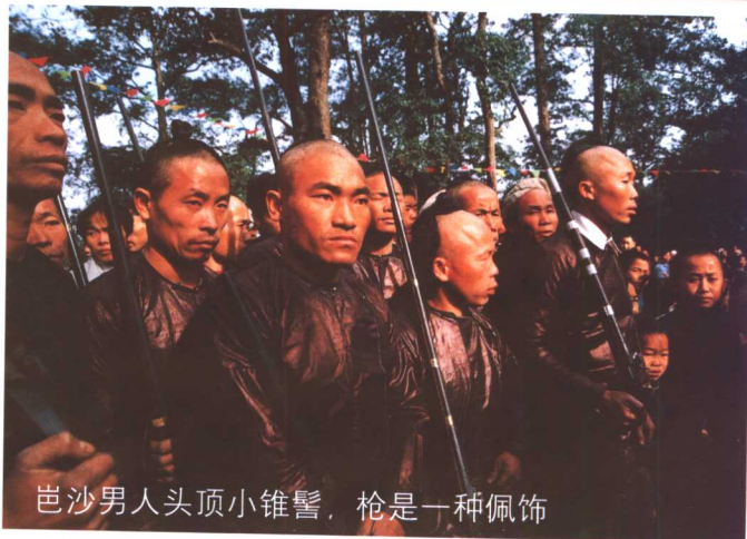
岜沙男人头顶小锥髻，枪是一种佩饰