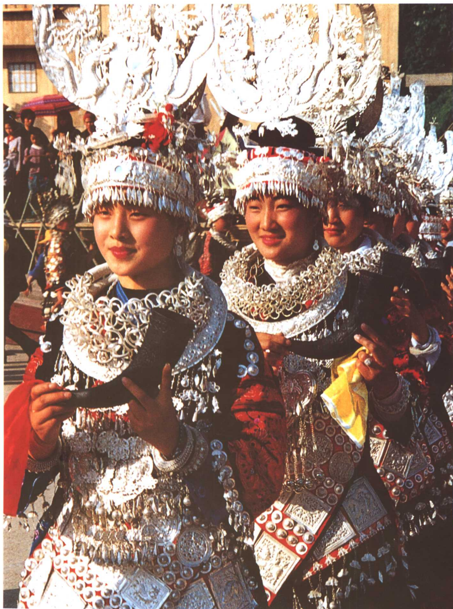
神采奕奕向贵客走来