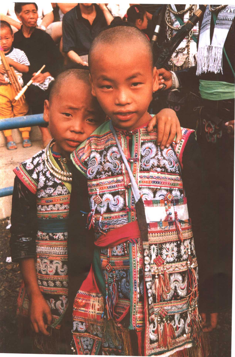
岜沙儿童蜡染童装