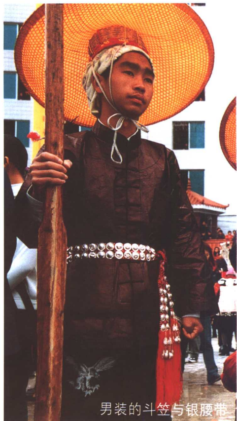
男装的斗笠与银腰带