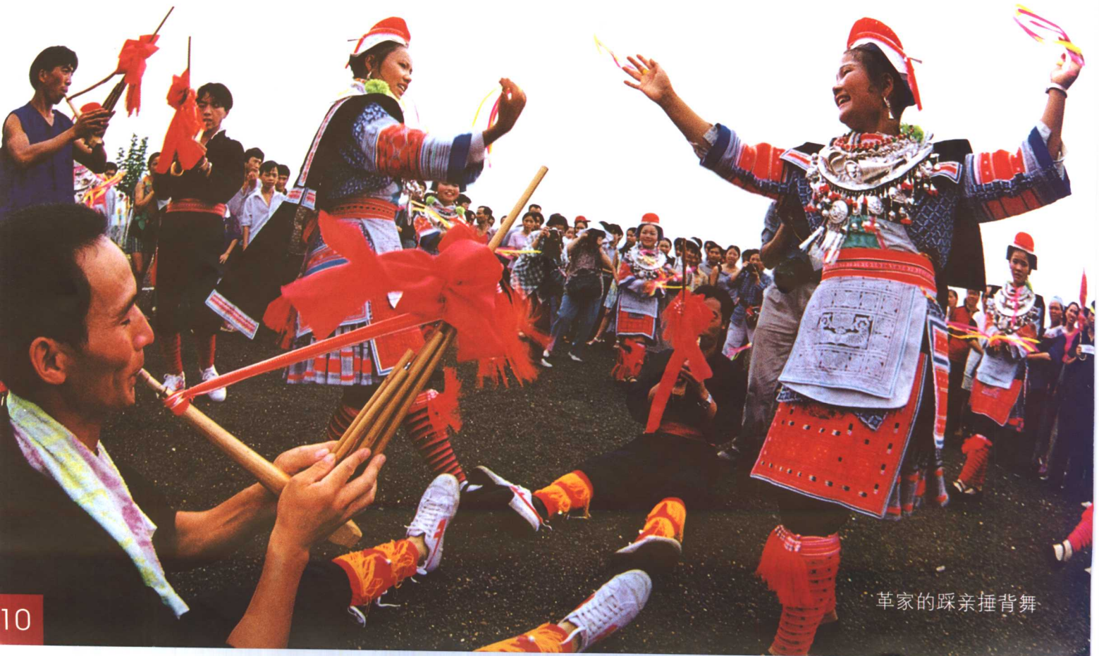
革家的踩亲捶背舞