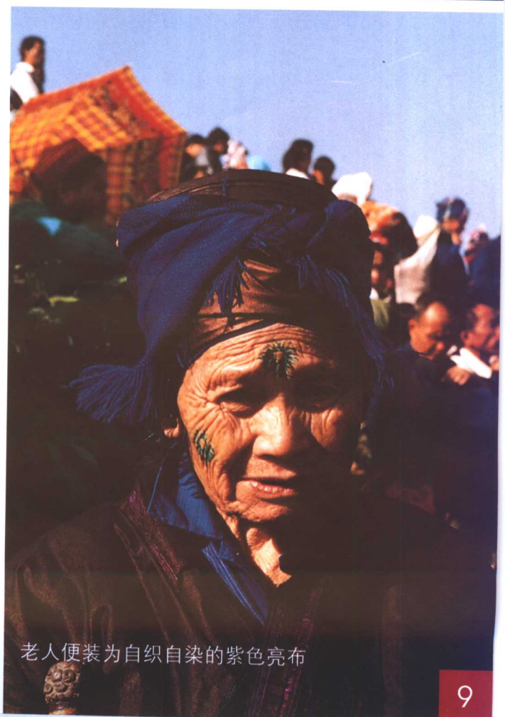
老人便装为自织自染的紫色亮布