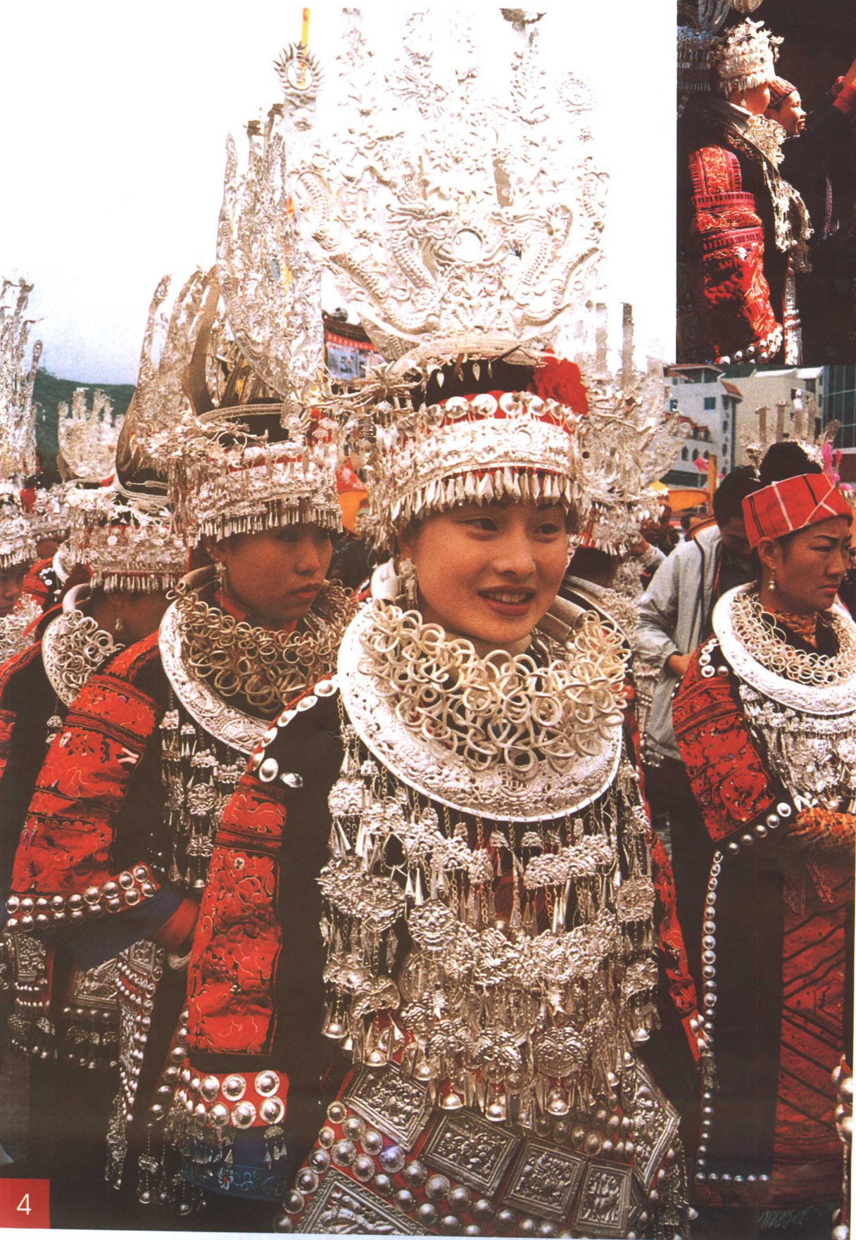
沉重的银饰， 激动的心情