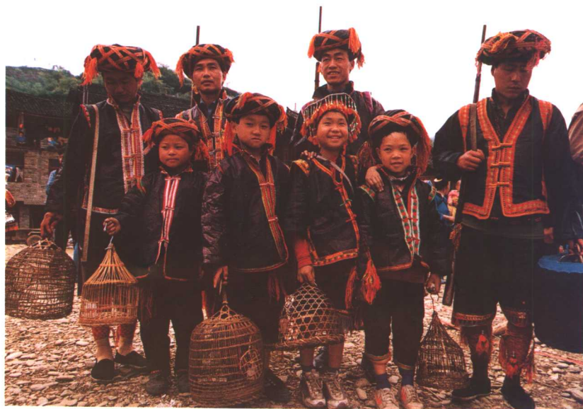
男装的圆盘头帕、短裤和绑腿