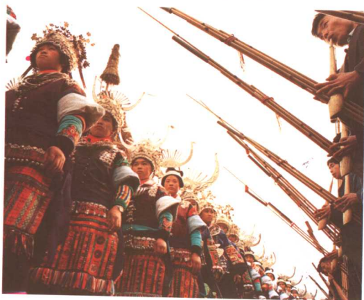
正月芦笙亮相，大领、宽袖、刺绣围腰