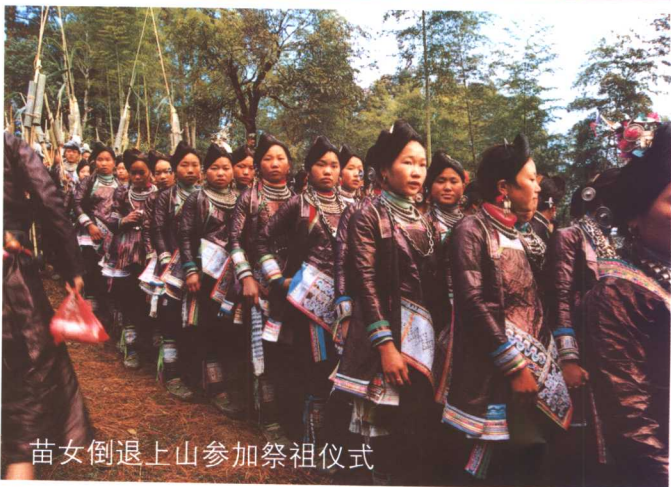
苗女倒退上山参加祭祖仪式