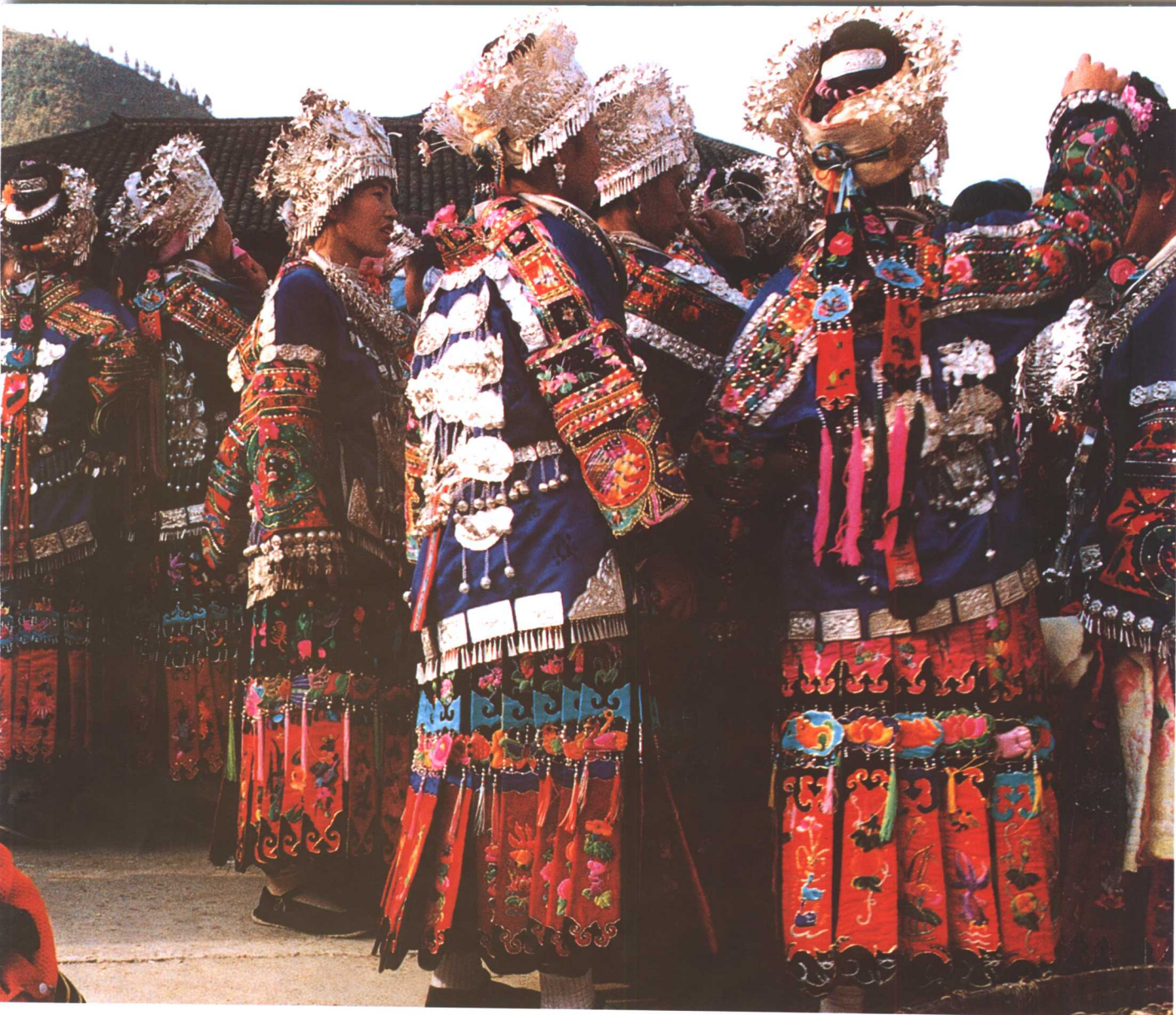
苗装飘带裙没有同样样式的刺绣