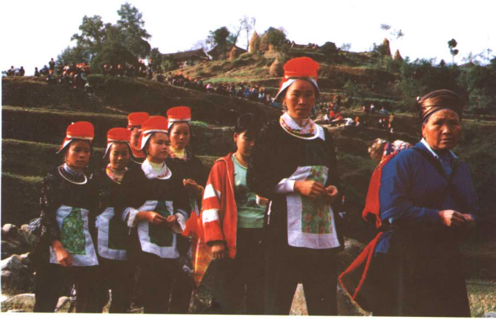
重安江革家女便装

分布在凯里、黄平重安江一带，女装款式形同战将的盔甲，显露服饰中的“祖先崇拜”痕迹，衣裙、围腰均为自绘蜡染，织锦绑腿佩银饰。