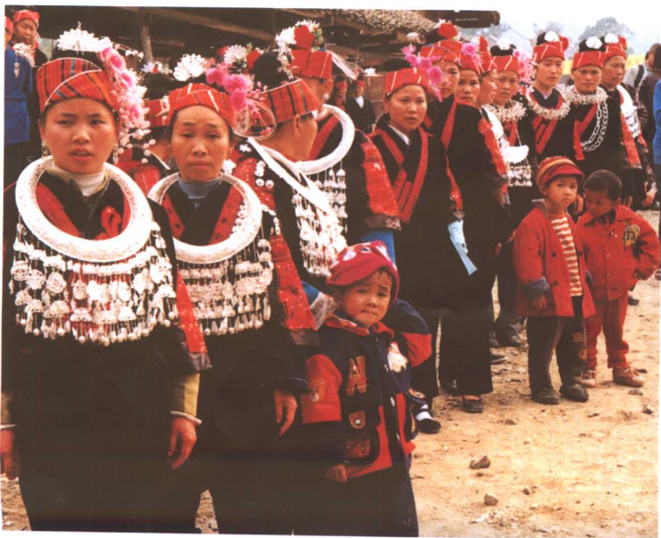
穿便装的妇女村头迎客