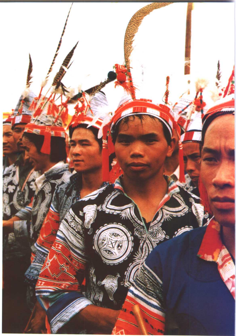
男装蜡染衣和头冠锦鸡羽尾