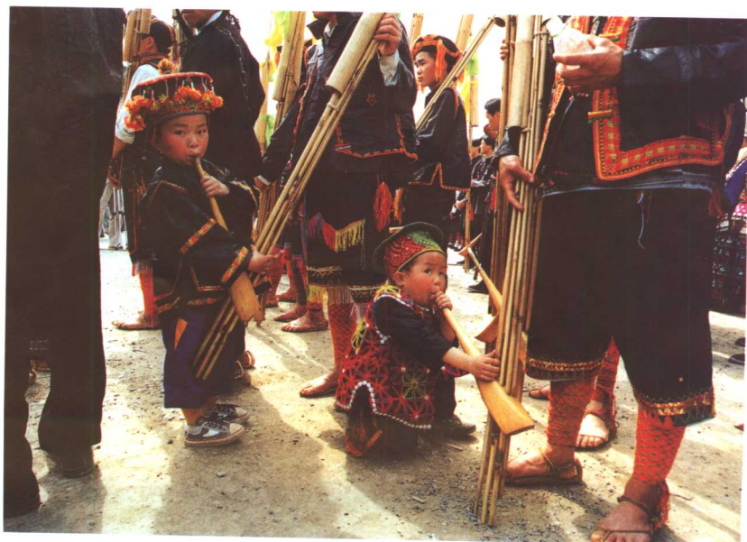
穿草鞋的爸爸与穿胶鞋的儿子