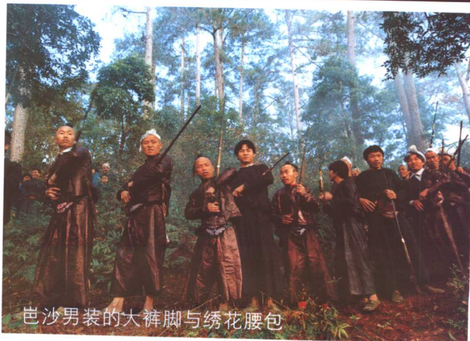
岜沙男装的大裤脚与绣花腰包