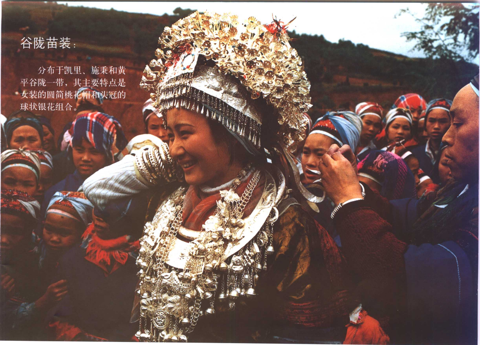
九月芦笙会盛装苗女出寨

分布于凯里、施秉和黄平谷陇一带，其主要特点是女装的圆筒桃花帽和头冠的球状银花组合。