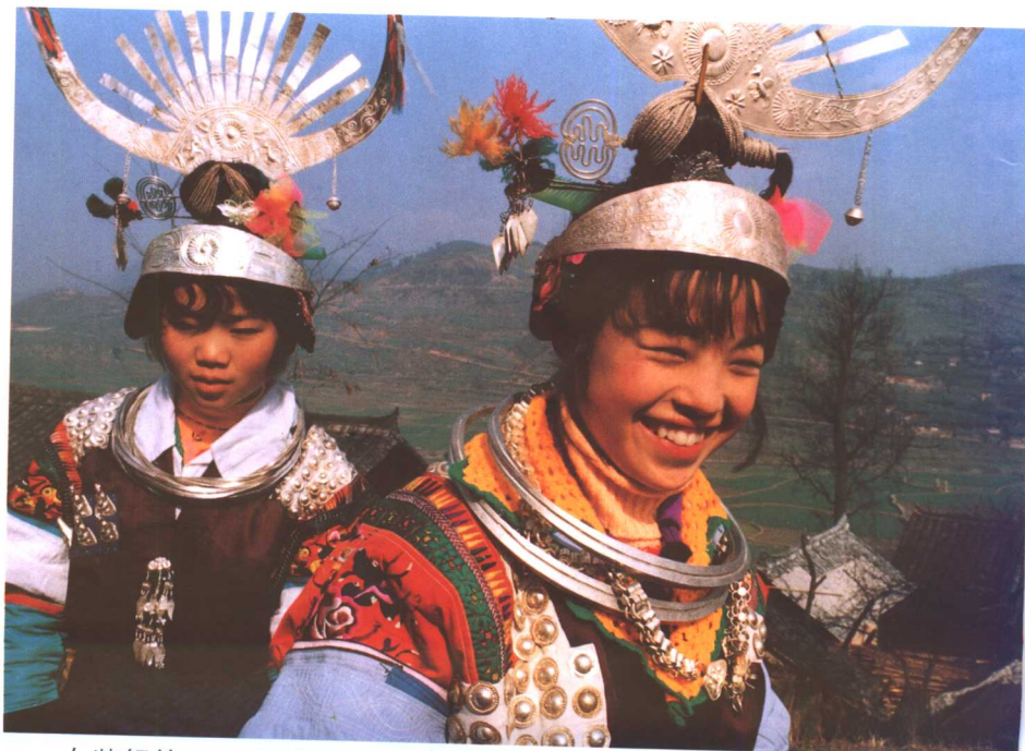
女装银饰二十多件