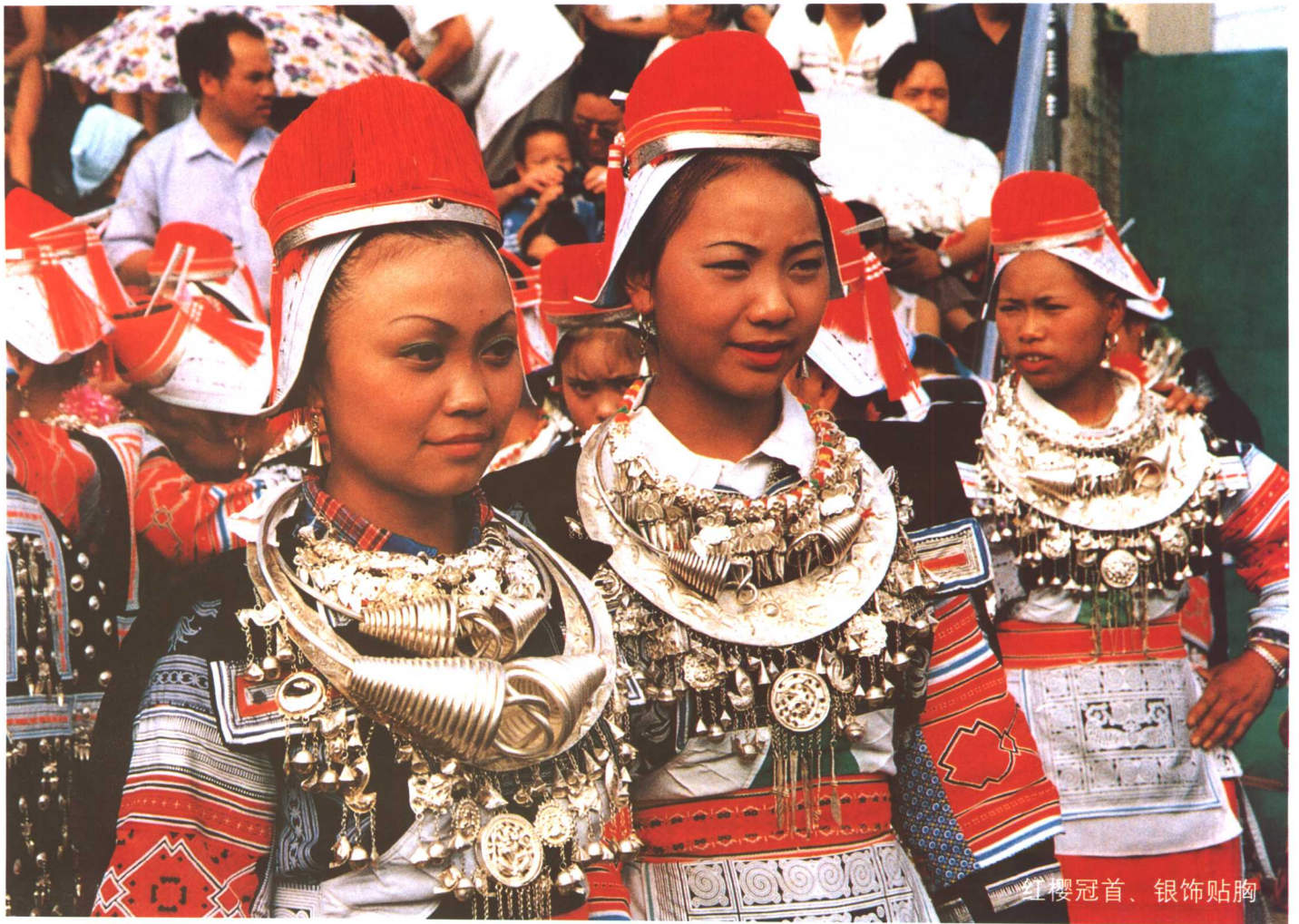
红樱冠首、银饰贴胸