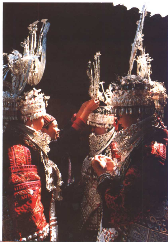
母亲为女儿精心扮装

清水江畔的施洞姊妹节，苗女大多要盛装过节，其服饰的最大特点是，全身佩戴的银饰最多有50多件，重达10公斤左右，特别是实心的银项圈重达数公斤，节日的姊妹节是一片银色的海洋。