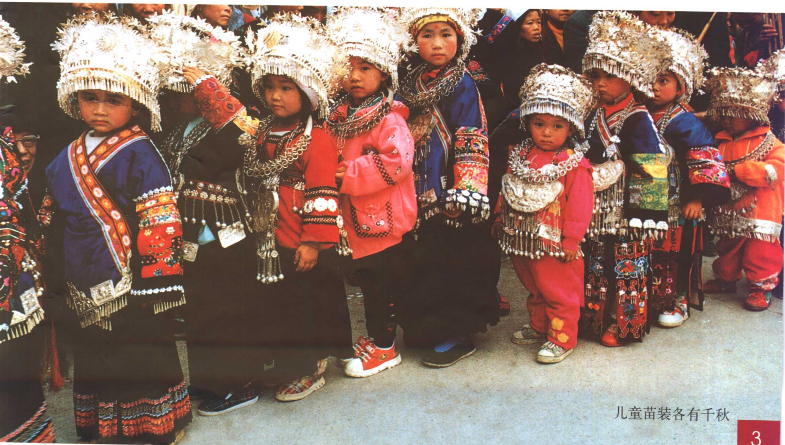
儿童苗装各有千秋