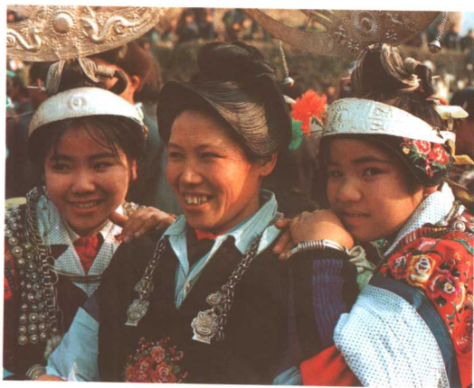
盘发髻的便装与戴银饰的盛装

分布于丹寨、麻江和凯里舟溪，主要特点表现在女装头饰上，绾高平髻，头发抹茶油梳成半圆盘状。