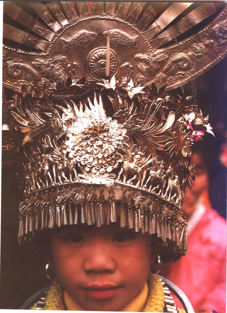
十分精致的头冠银饰