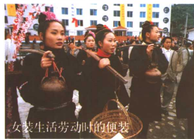
女装生活劳动时的便装