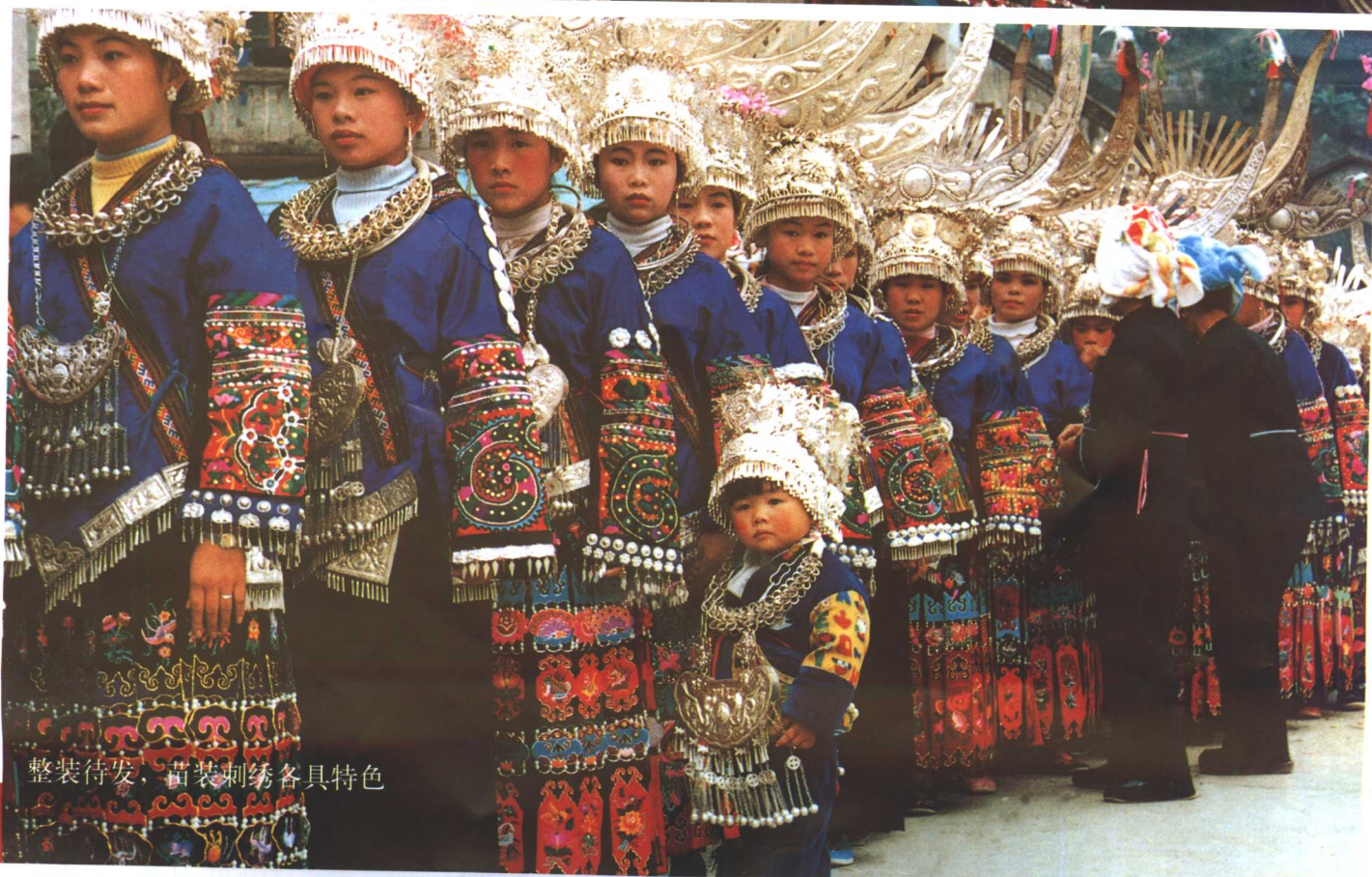
整装待发，苗装刺绣各具特色