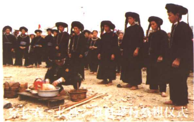
土族“安妥”祭祀行祭和仪式