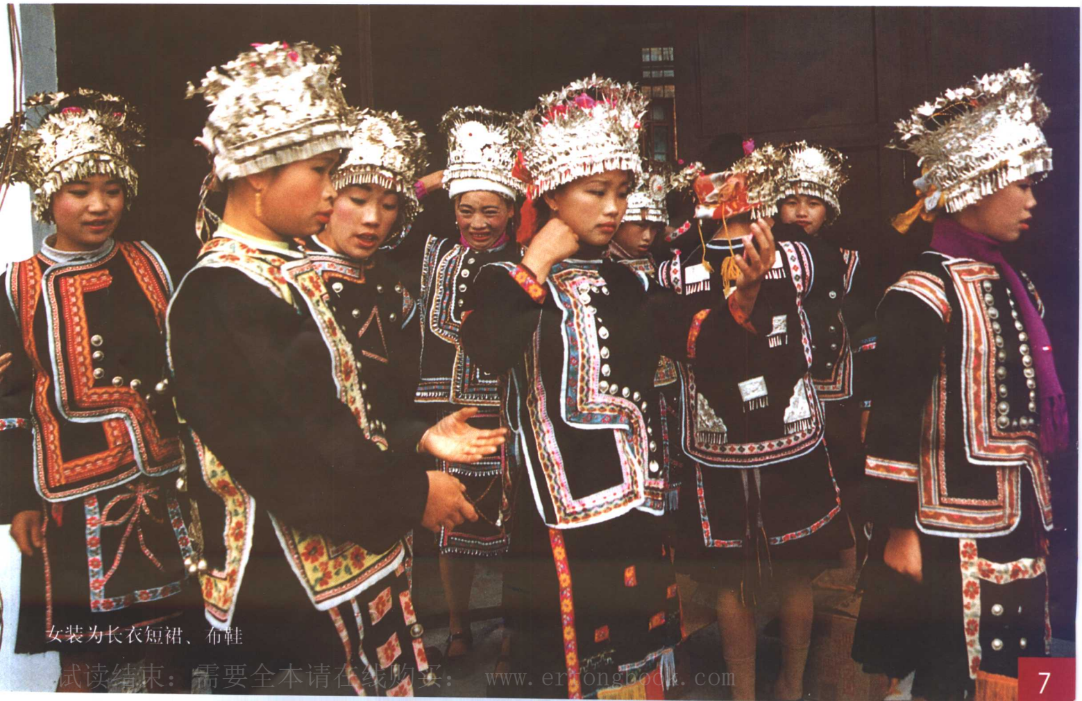
女装为长衣短裙、布鞋