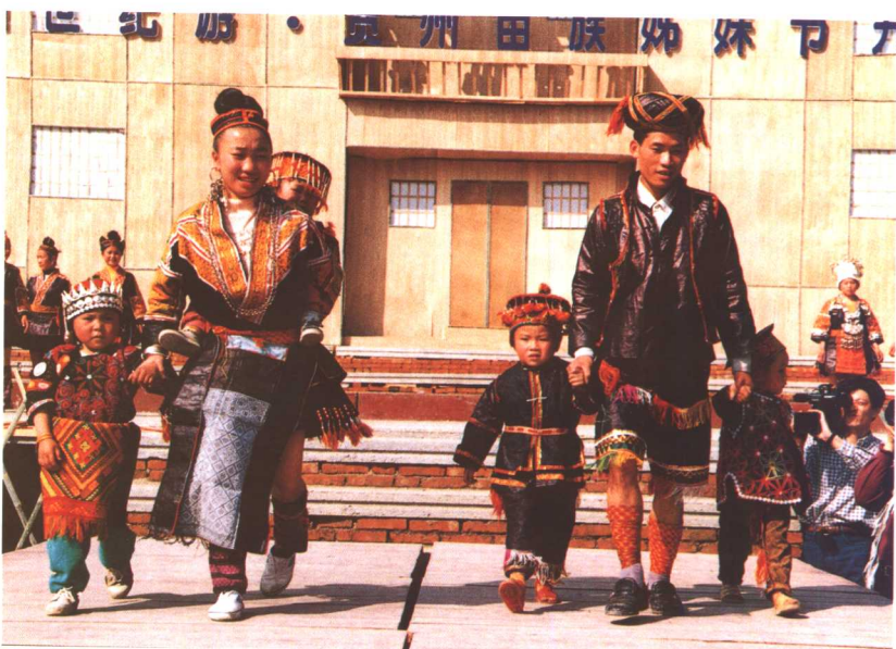
男装、女装、童装上台亮相