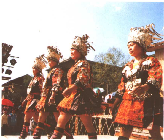
女装超短裙迈大步，真够现代