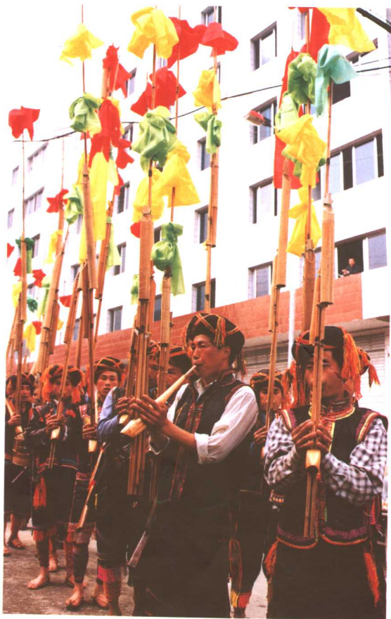
男装穿草鞋吹芦笙走县城够原始