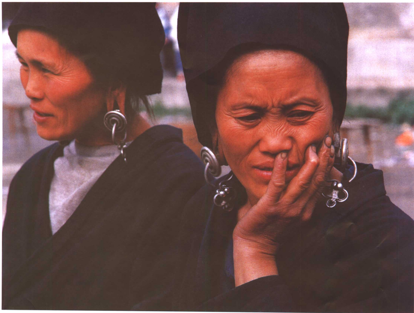
女便装青衣、青裤、青头帕和垂吊的大银耳环