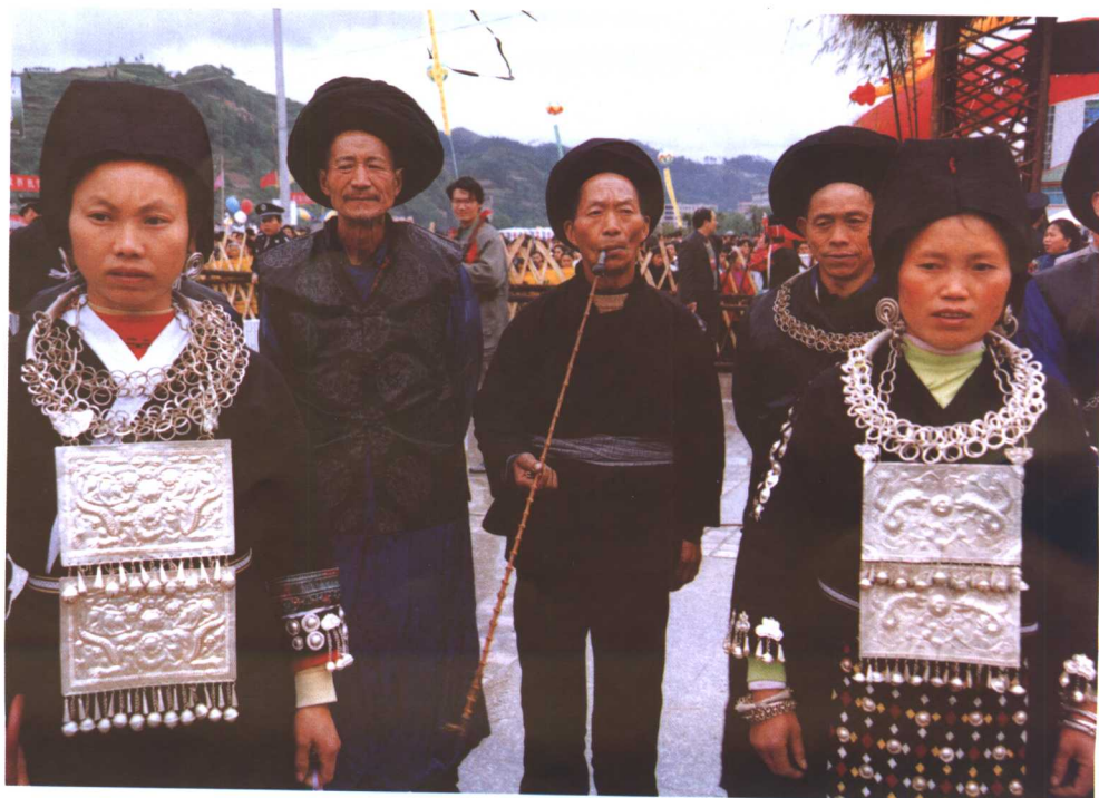
女装两块胸牌，男老人长袍马褂