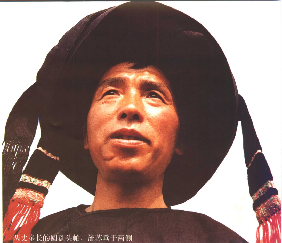
两丈多长的圆盘头帕，流苏垂于两侧