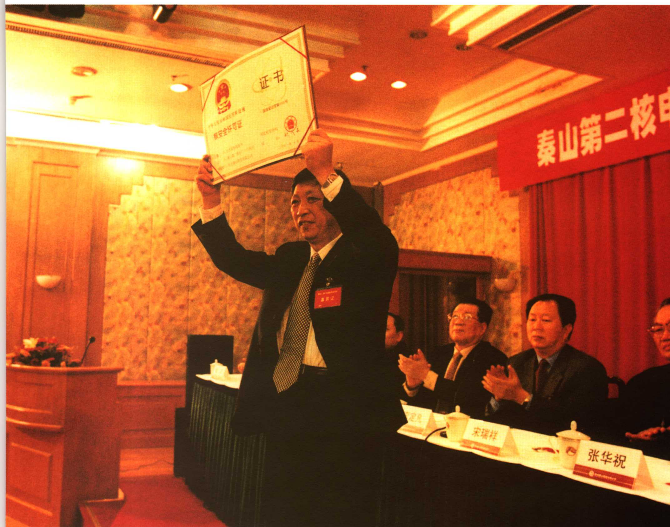
国家核安全局向秦山第二核电厂颁发装料许可证