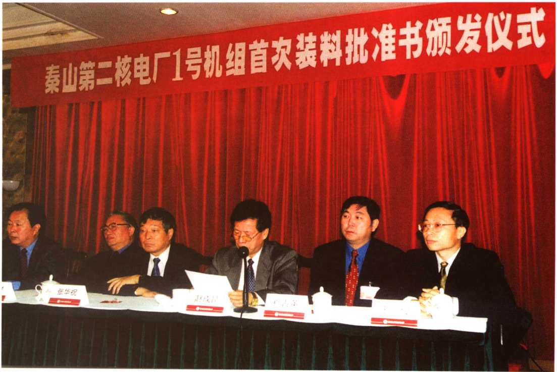
秦山第二核电站1号机组首次装料批准书颁发仪式