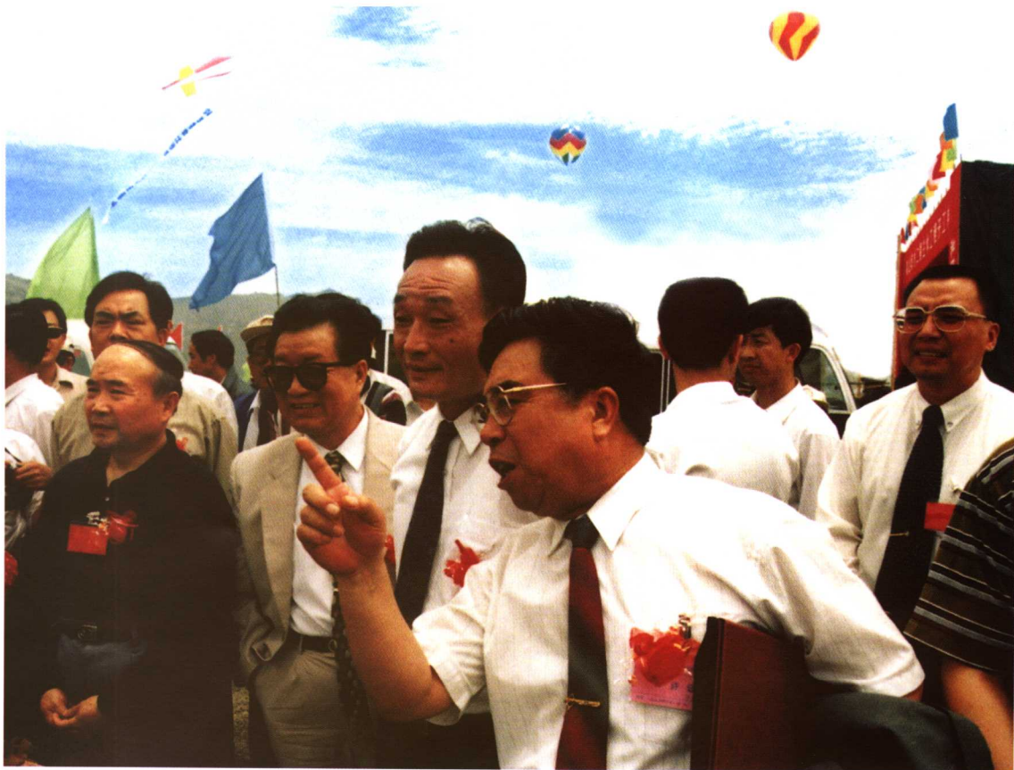
全国人大常委会委员长吴邦国在秦山第二核电站施工现场视察