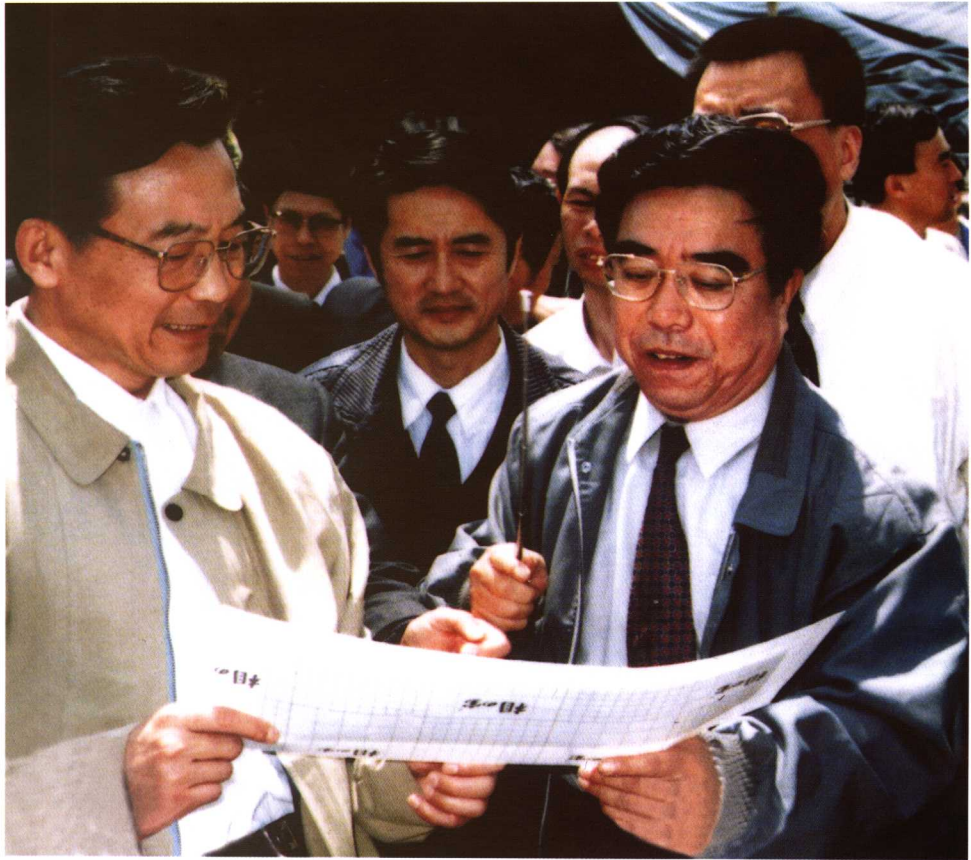
国务院总理温家宝在秦山第二核电站施工现场视察