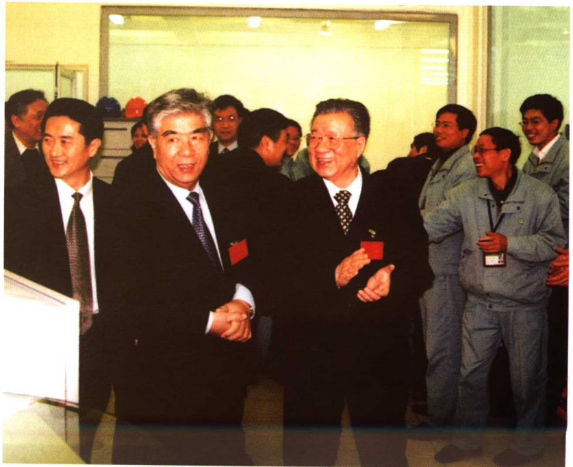
2号机组顺利并网发电时，老领导洋溢出的喜悦之情