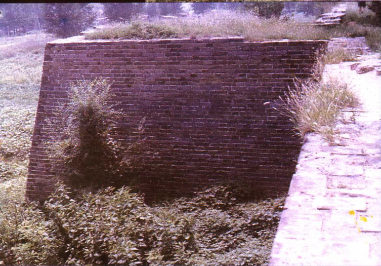
开封东城墙马面敌台