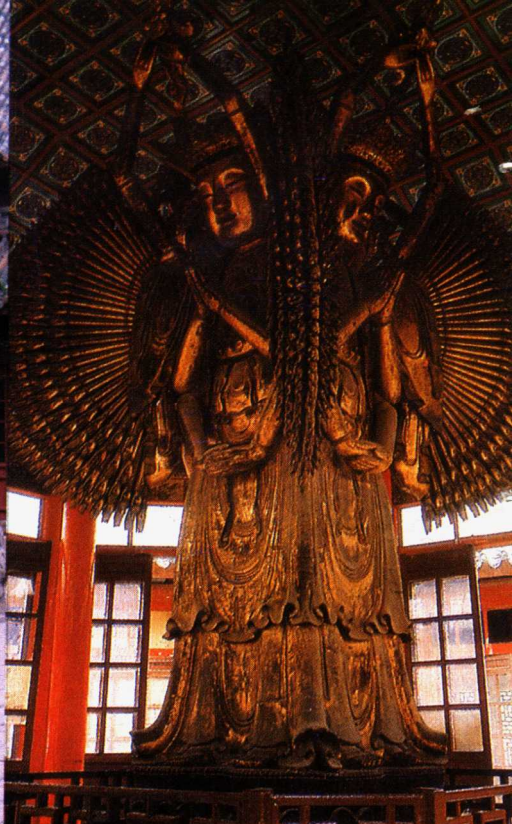
相国寺千手千眼佛