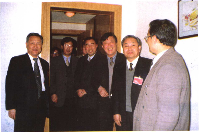
铜川市领导及省社科院领导看望与会代表