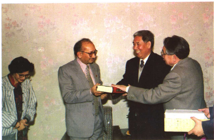
中共铜川市委书记刘遵义（左三）会见参加玄奘法圆寂1335周年纪念活动的尼泊尔大使阿查里雅·拉杰索和夫人