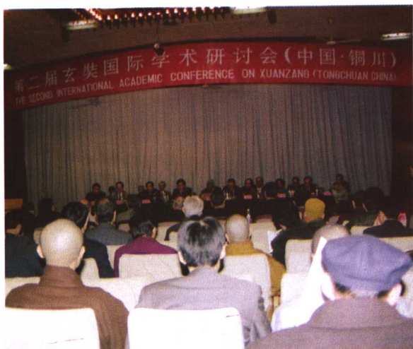
1999年3月22日下午，第二届玄奘国际学术研讨会在铜川宾馆隆重开幕