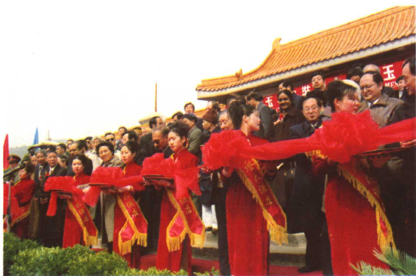
省市领导及中外贵宾为玄奘纪念馆开馆剪彩