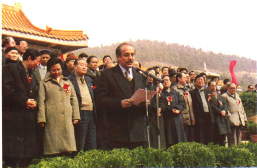
印度大使南威哲在玄奘纪念馆开馆仪式上讲话