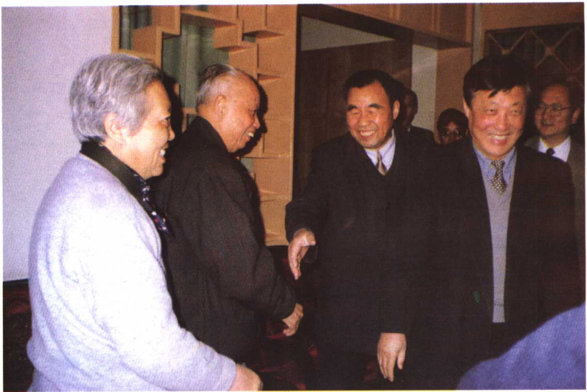
铜川市领导及省社科院领导看望与会代表