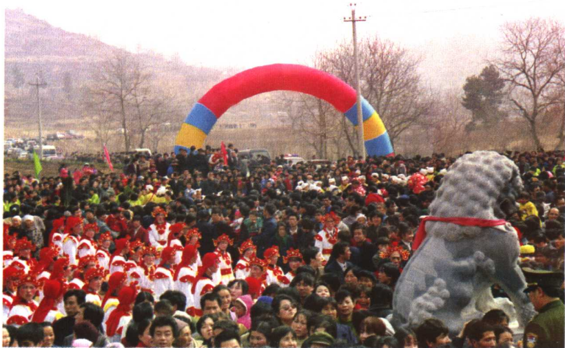
玄奘纪念馆门前广场上，人头攒动