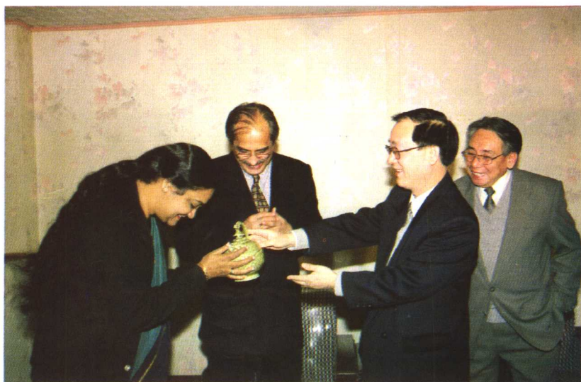
铜川市市长陈双全（右二）会见参加玄奘法师圆寂1335周年纪念活动的印度大使南威哲和夫人