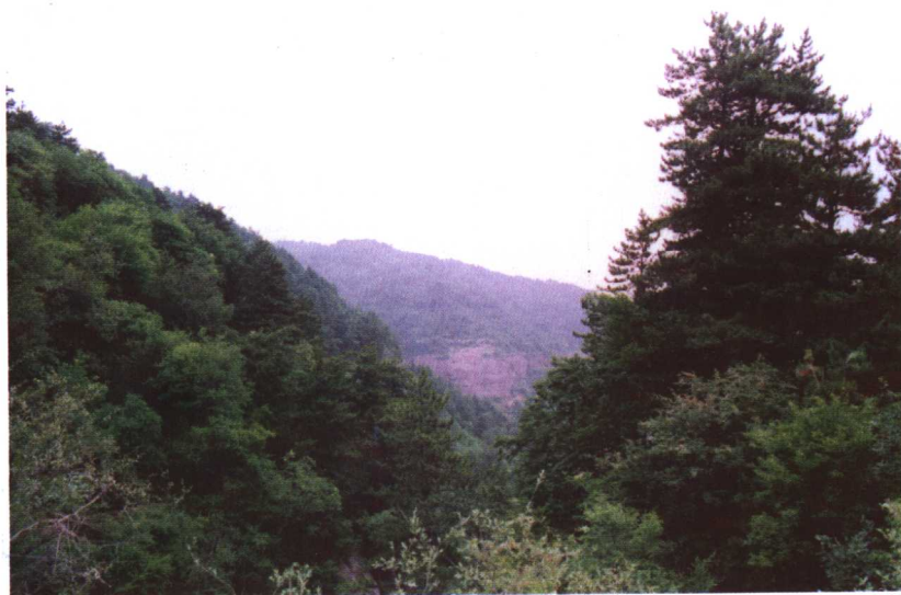
省级风景名胜区—陕西省铜川市玉华宫风景名胜区