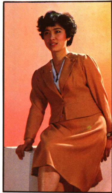
38. 天鹅绒贴花女套衫 上海针织厂 郁银章 设计