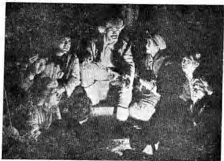
楊靖宇同志和抗聯 戰士在密林中唱“露營 之歌”（第九場）