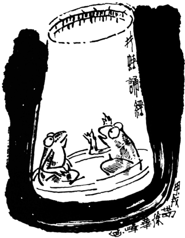
井蛙诵经（载《小小说月报》1994.7）