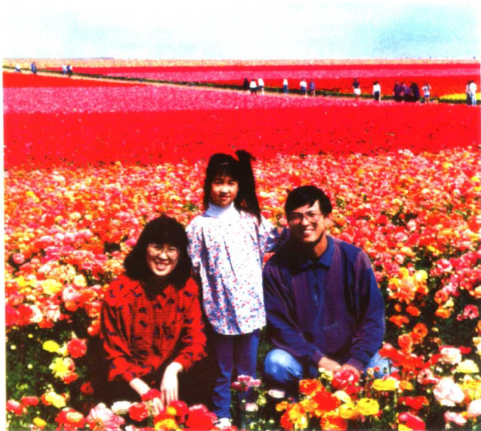
▲ 一九九四年春在圣地亚哥卡斯拜花圃的全家照。