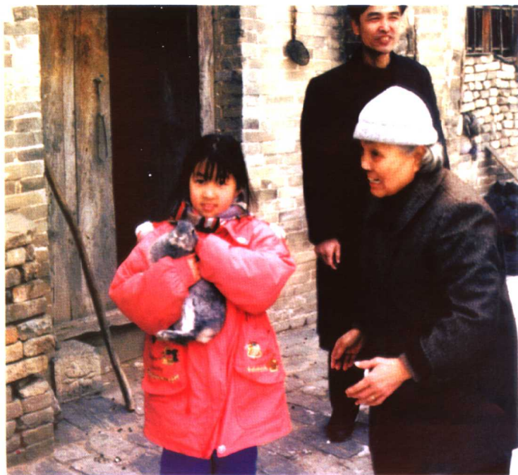
▲ 第一次回老家。怀抱的小灰兔后来很是不肯跑开。