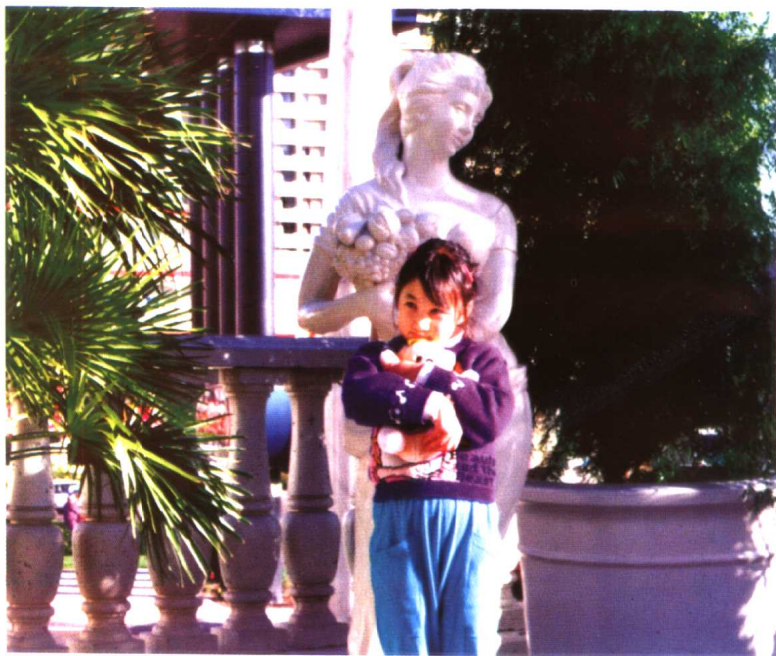
▲ 在拉斯维加斯。怀抱的小熊还是在一次观看演出时有幸登台，那位拉着她的小手唱歌的演员叔叔送给她的。