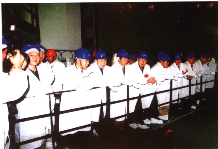
中国核工业集团公司领导和专家在装料现场