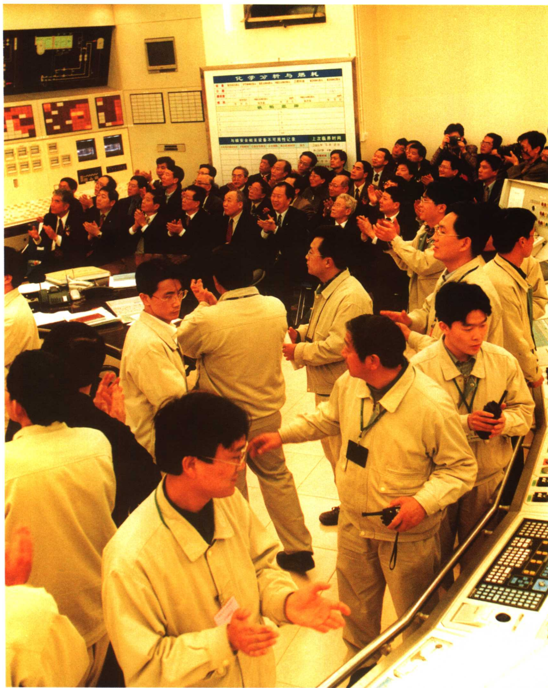
庆贺1号机组并网发电成功