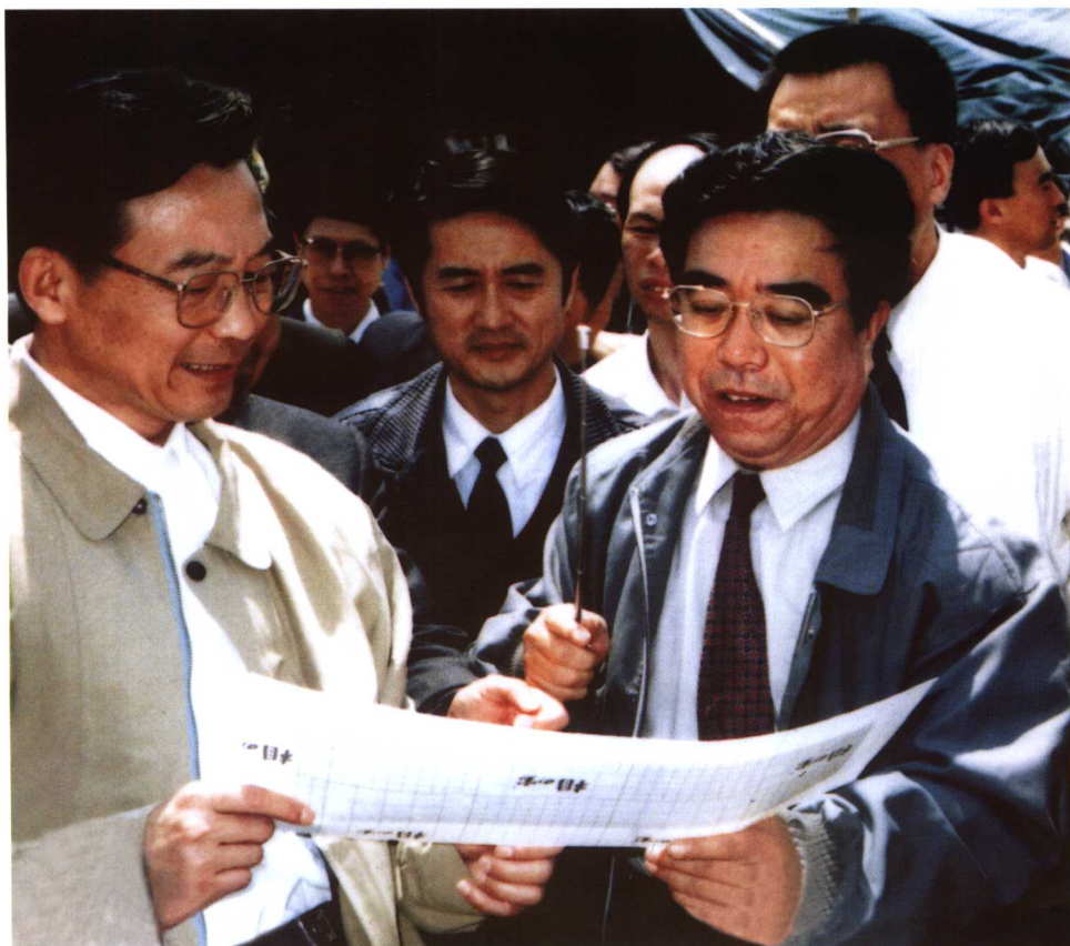
国务院总理温家宝在秦山第二核电厂施工现场视察