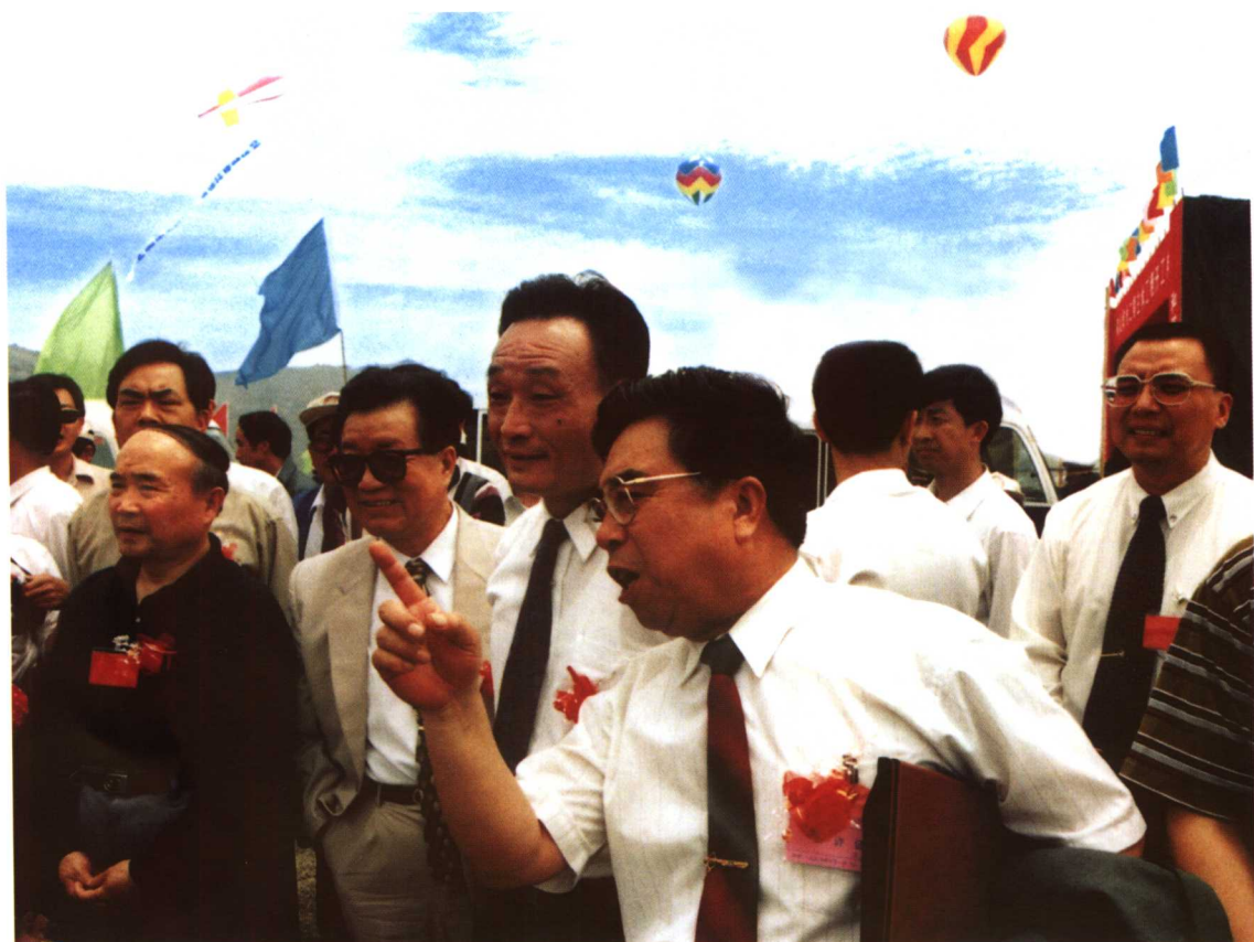
全国人大常委会委员长吴邦国在秦山第二核电站施工现场视察