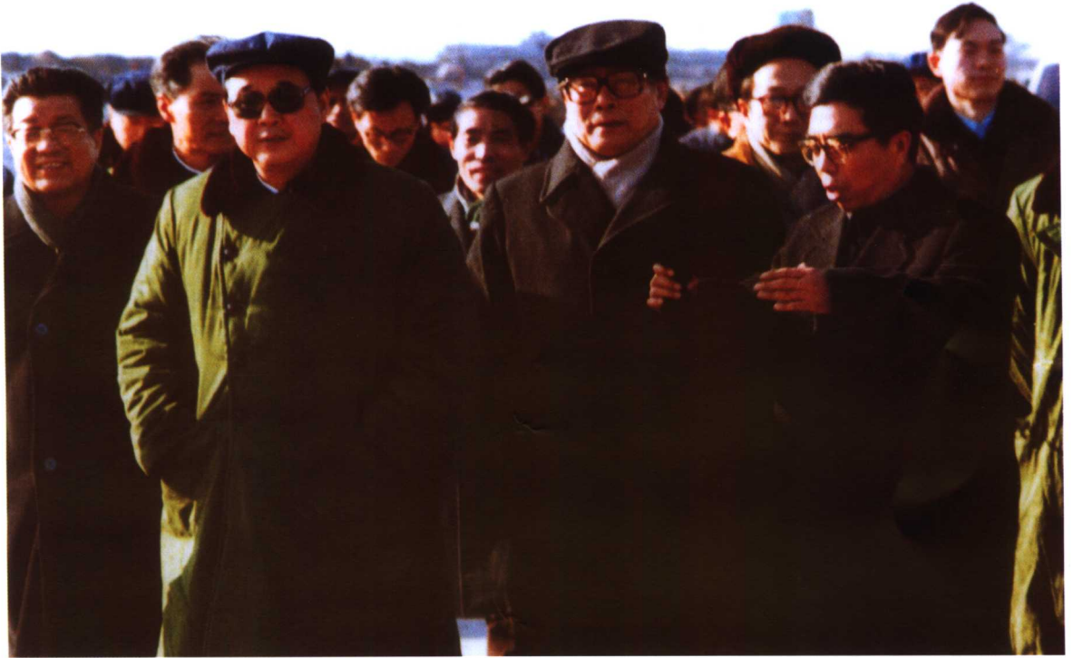
中央军委主席江泽民，李鹏视察秦山核电现场