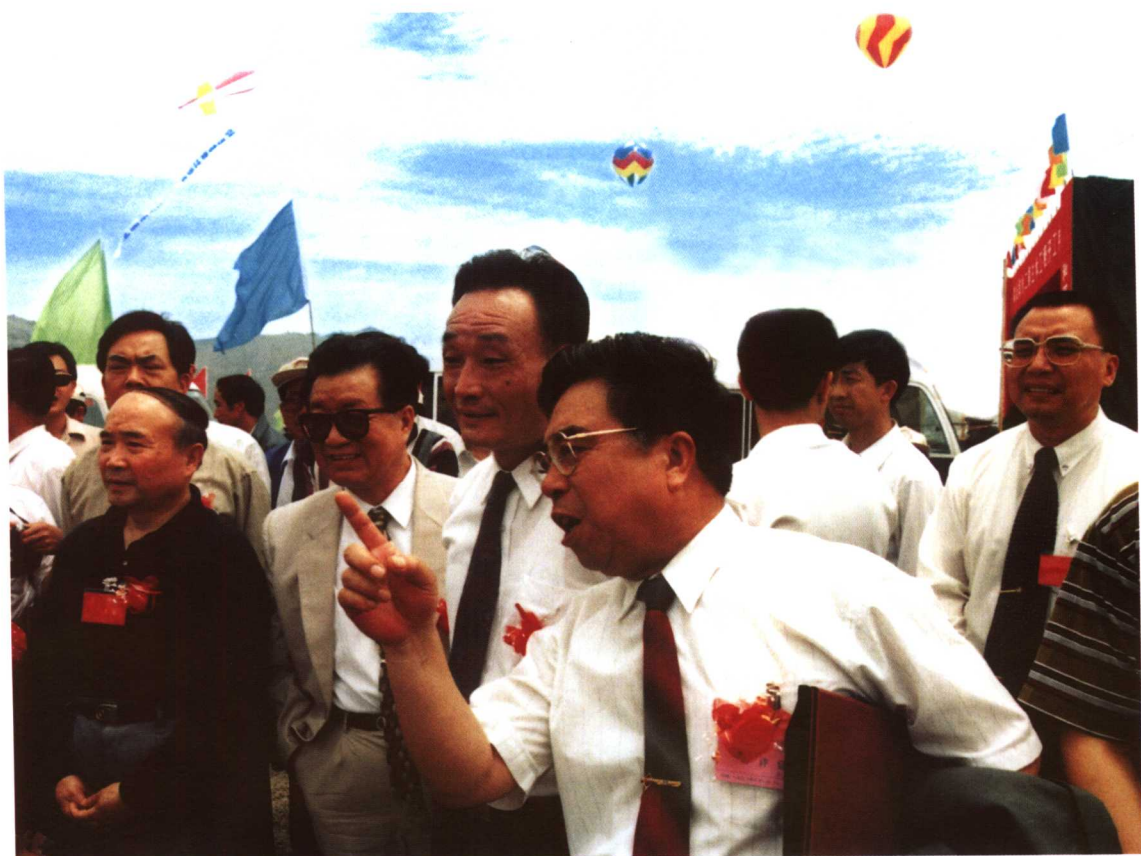
全国人大常委会委员长吴邦国在秦山第二核电厂施工现场视察