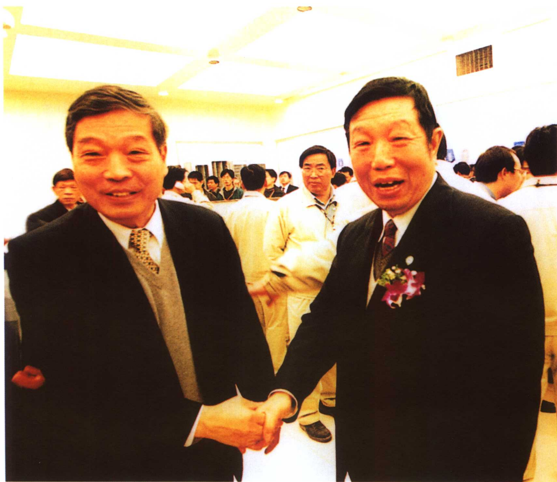
并网发电成功的喜悦