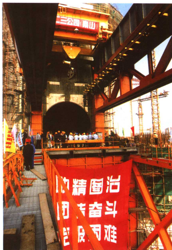
反应堆厂房设备闸门