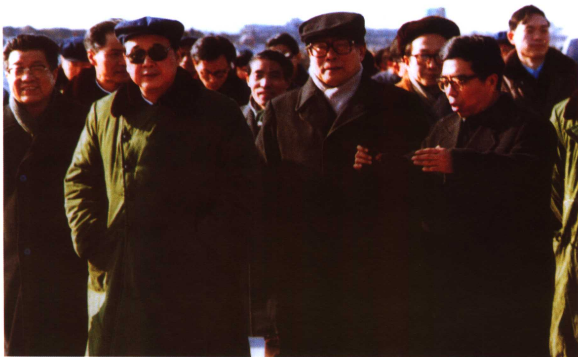
中央军委主席江泽民，李鹏视察秦山核电现场