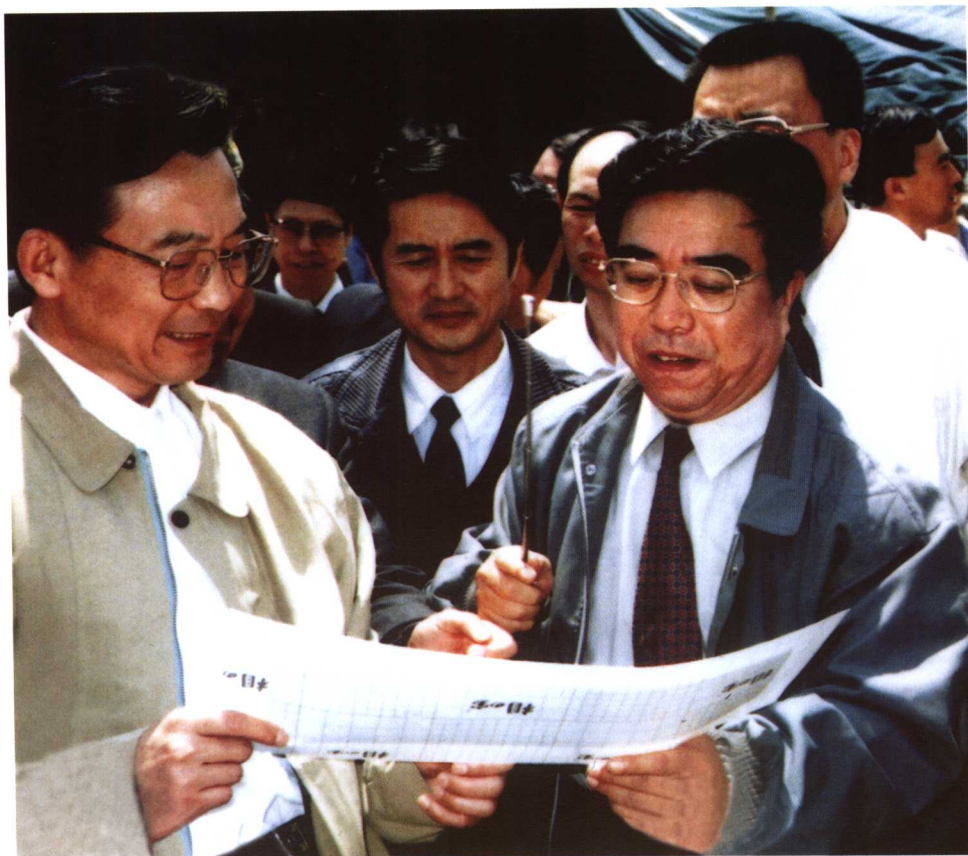
国务院总理温家宝在秦山第二核电厂施工现场视察