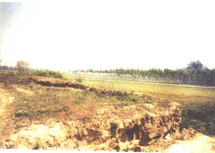
城垣废弃后形成的台地。