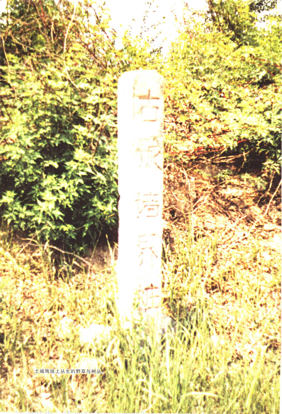
土城残垣上丛生的野草与树丛。