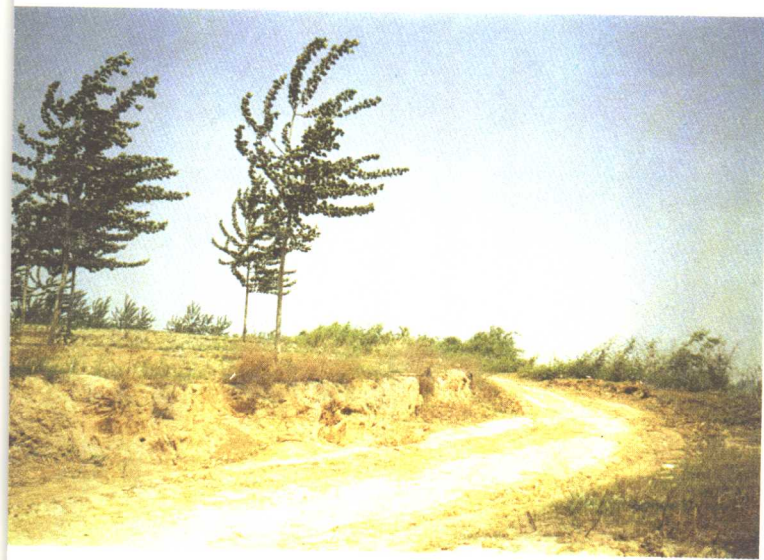
西周燕国都城遗址。