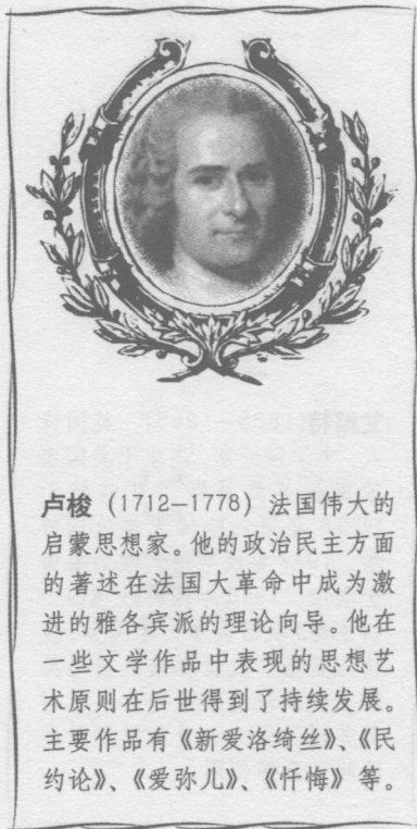
卢梭 (1712-1778) 法国伟大的启蒙思想家。他的政治民主方面的著述在法国大革命中成为激进的雅各宾派的理论向导。他在一些文学作品中表现的思想艺术原则在后世得到了持续发展。主要作品有《新爱洛绮丝》、《民约论》、《爱弥儿》、《忏悔》等。