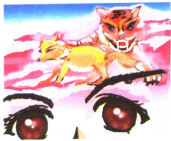
狡猾的狐狸 凶恶的老虎 狐假虎威