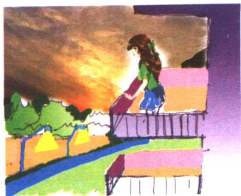
变幻莫测 染红了天空