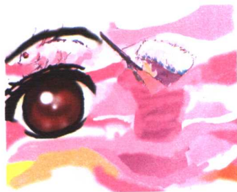
活泼可爱的兔子 无忧无虑 高大的猎人