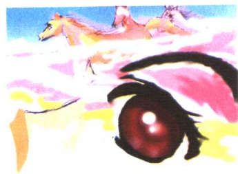
万马奔腾图 “尘土飞扬”