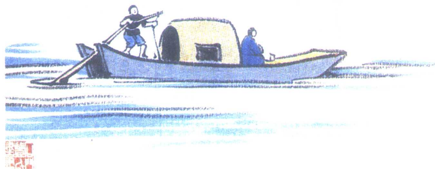
前面好青山，舟人亦肯住。丰子恺绘