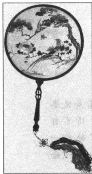
>>> 清·绣花团扇。此扇设计巧妙，绢面图画细腻精美，深为清宫后妃喜爱。

太子弘历对那边的事情却是一无所知。一会儿，御医赶到，行礼完毕后给弘历检查伤口，正在这时，皇后的旨意也传到了弘历的耳中，太子听太监说完，他吃惊地从椅子上一跃而起，撇下御医就往马佳氏宫中跑去。