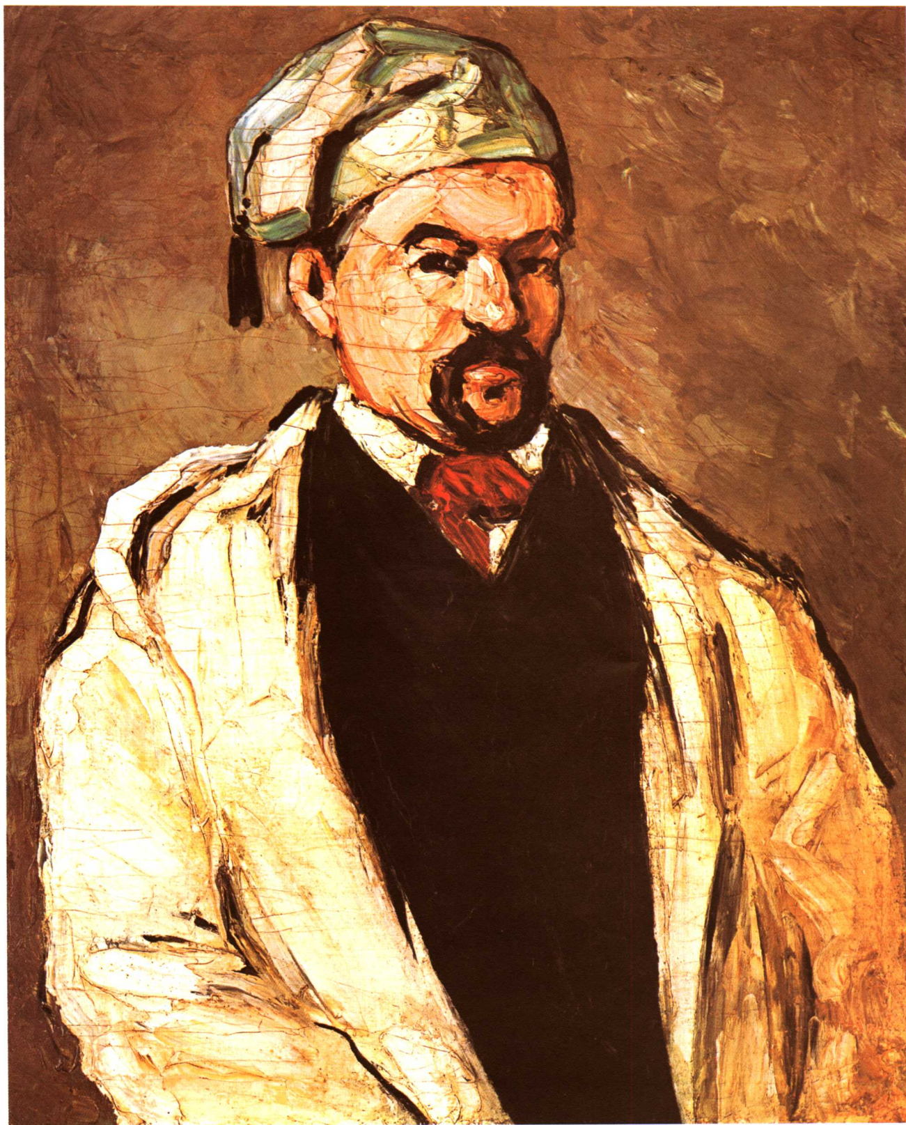
多米尼克伯父的画像