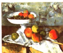
高脚盘、玻璃酒杯和苹果