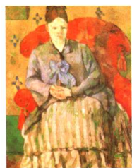
坐在红色手扶椅上的塞尚夫人