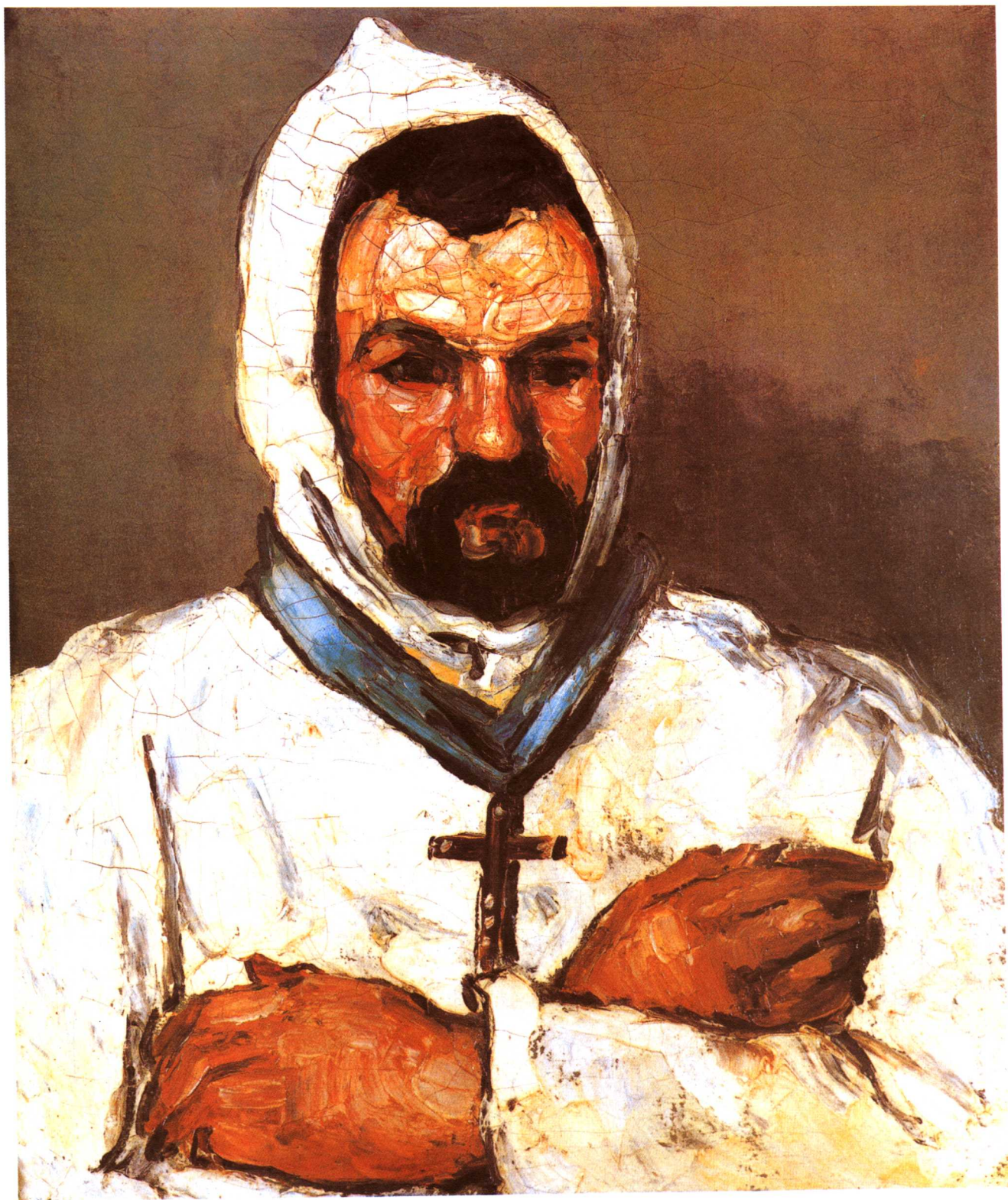
多米尼克伯父的神父装扮 布上油画 65厘米×54厘米 私人藏