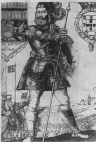
亨利王子站在修达港（16世纪荷兰版画）

这是一次划时代的伟大远航，而它的动机与灵感，却是在那个时代人看来绝对荒唐的梦想——寻找马可·波罗所说的大汗的