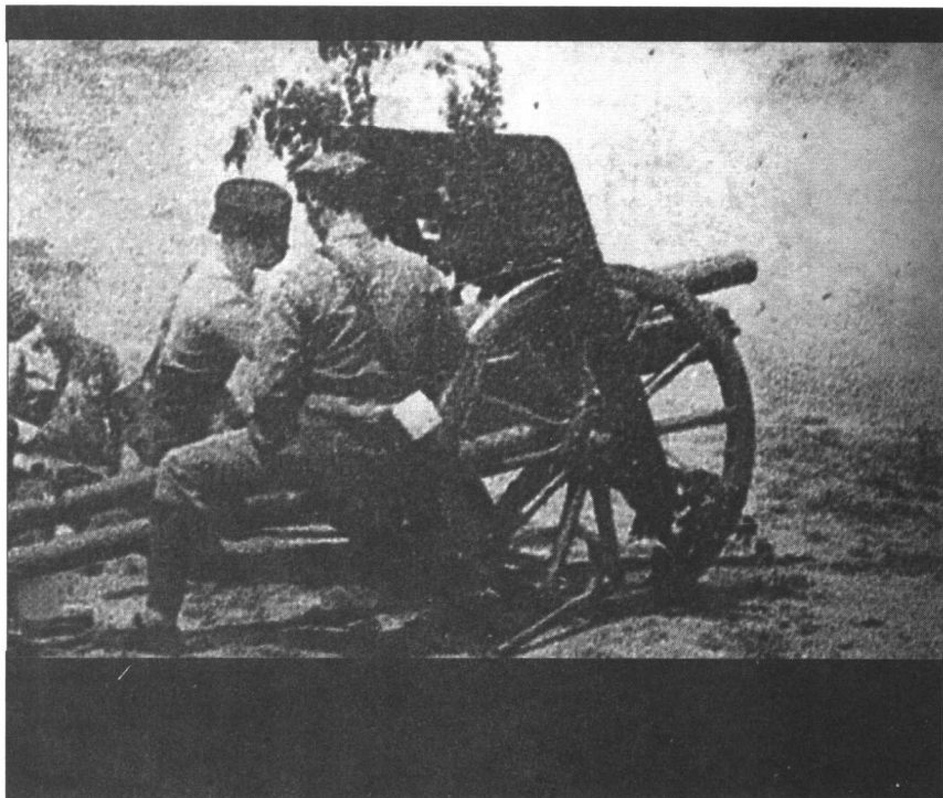
中国炮兵向敌 射击。