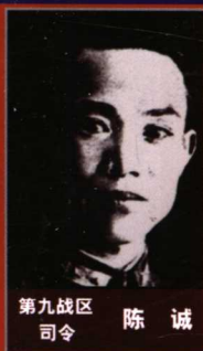
第九战区 司令 陈 诚