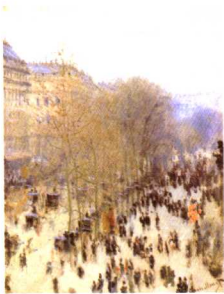
通往嘉普辛斯的林荫大道