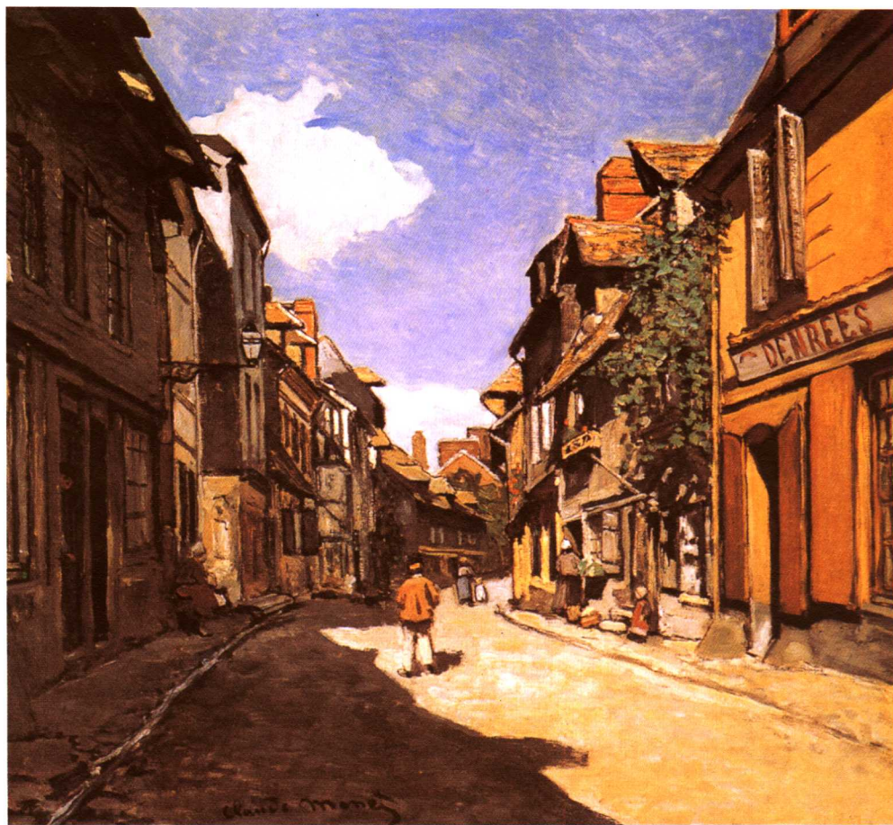
哈佛卢的巴奥尔街道