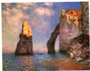
艾特达的峭壁和尖顶岩石