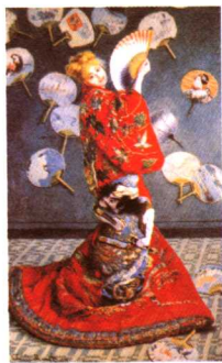
穿日本和服的莫奈夫人