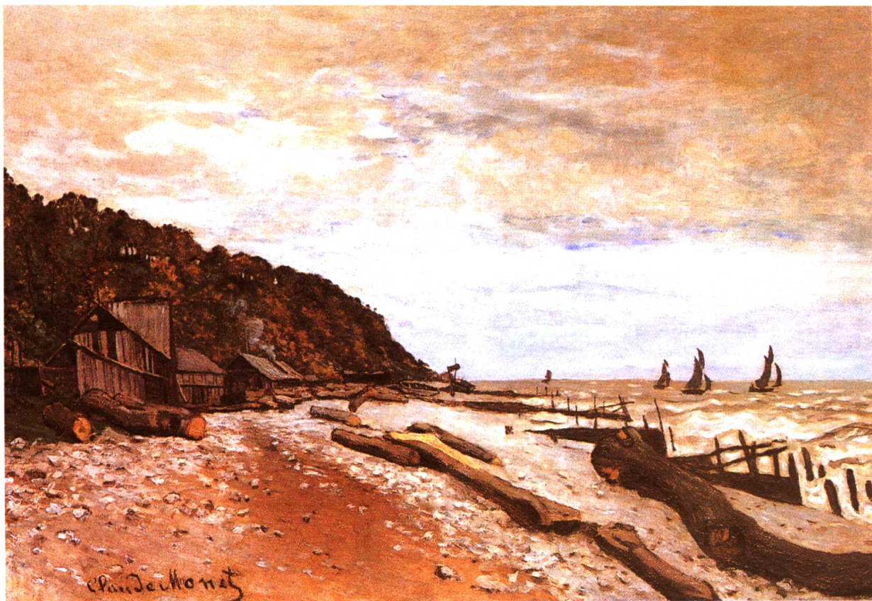
近哈佛卢港的小造船场