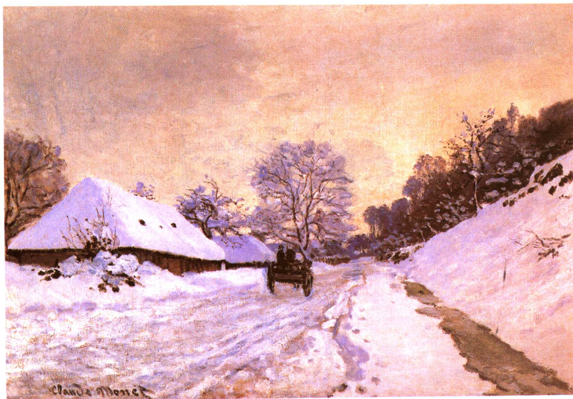
冬天的哈佛卢大道