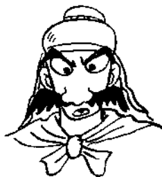
子路 孔子的弟子，經常守在孔子身邊。