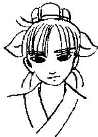
顏回 比孔子年輕30歲，是難得一見的優秀人才。