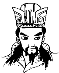
周公 奠定周朝基礎的人物。