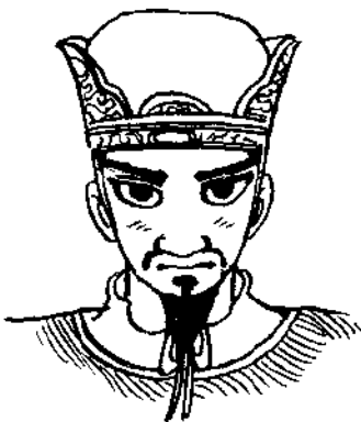
孔子 (西元前551~西元前479年)