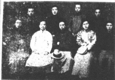
法界研究社 一九二一年 的會員