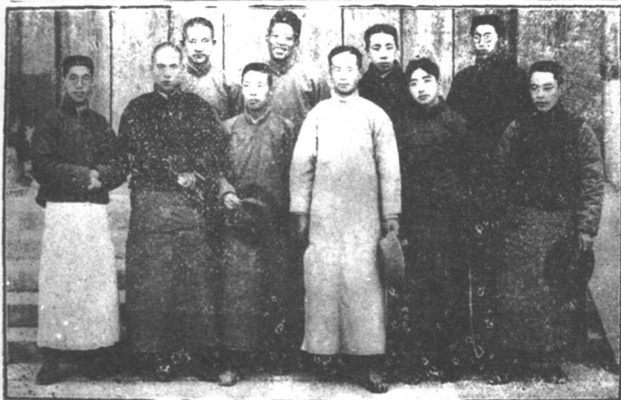
國語辯論會一九二一年會員