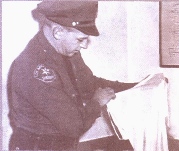
▲ 警方排查可疑线索。