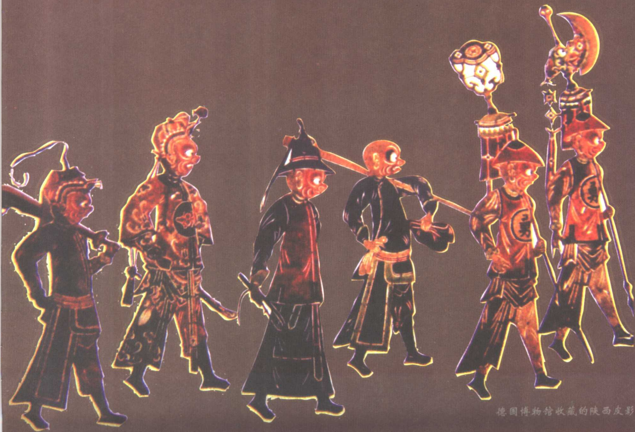
德国博物馆收藏的陕西皮影