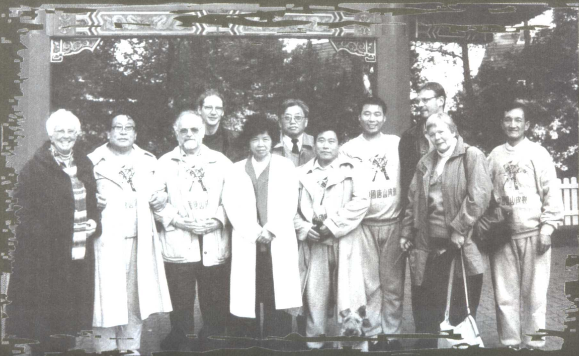
唐山皮影剧团在德国汉堡演出合影