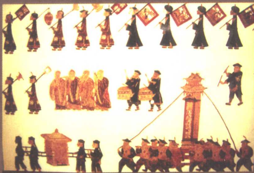
德国博物馆收藏的北京皮影