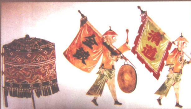
德国博物馆收藏的陕西皮影