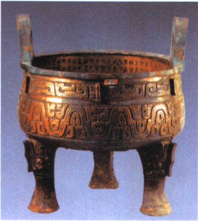
图1.四十二年逯鼎乙