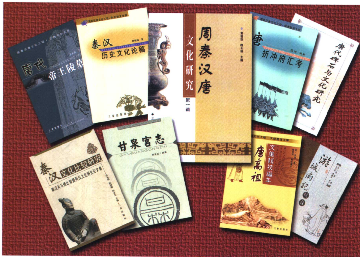
三秦出版社《周秦汉唐文化工程》已出图书