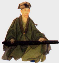
第一影响力艺术宝库