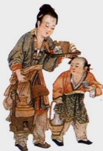
第一影响力艺术宝库

面。初唐的人物画分中原风格与边区风格两种，在人物的造型及气质风度的刻画上大大前进了一步。盛唐是人物画发展的高峰期，宗教画、肖像画、仕女画、历史画、风俗画都有大量作品产生，题材开始扩展到日常生活中，优秀的人物画家层出不穷。中晚唐时期的人物画在表现方式上及笔法上都有了新的创造，更加提高了中国人物画的形式美的价值。此外敦煌艺术在唐代同样达到了辉煌的高度，也是当时整个绘画艺术不可或缺的部分。