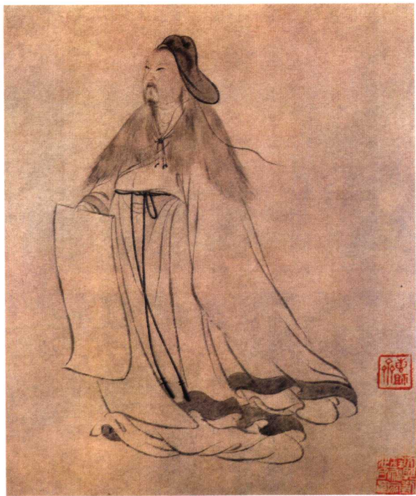
王仲玉 明代 轴 纸本 墨笔 106.8 × 32.5cm 北京故宫博物院藏

此画描绘的是东晋名士陶渊明，他神情淡逸，手持空白诗卷，仿佛在构思。全画笔法秀逸，主要以白描勾画。衣纹的线条舒畅、潇洒、飘逸，有助于人物性格的刻画。