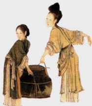
第一影响力艺术宝库