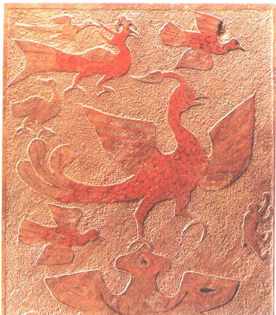
六 陕西神木大保当出土的 东汉彩绘画像石