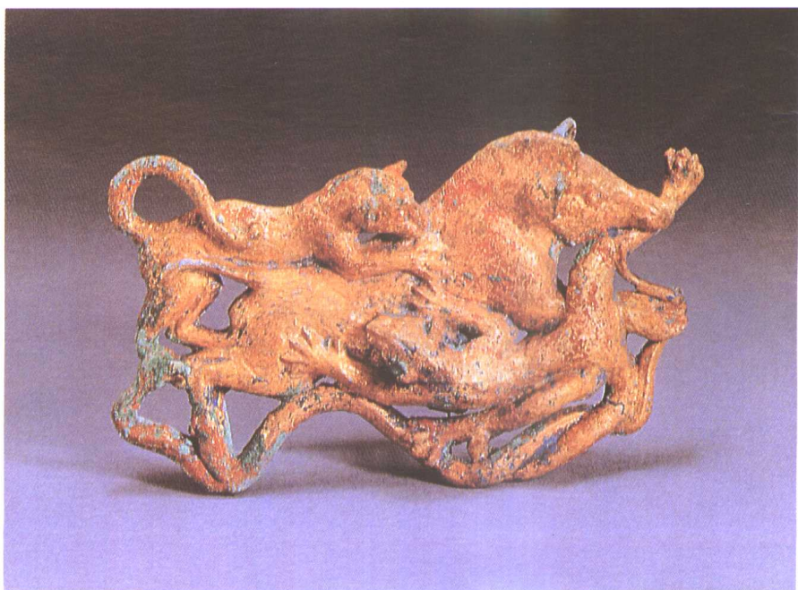
七 云南晋宁石寨山出土的 双豹噬猪鍍金铜扣饰