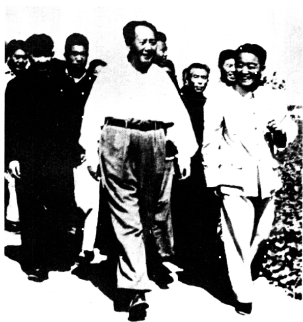
1959年9月24日，毛泽东主席在棉花丰产方的小路上，边走边和庞均亲切交谈。