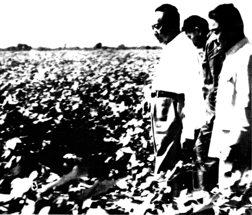
1959年9月24日，毛泽东主席在成安棉花丰产方小路边的棉田里。