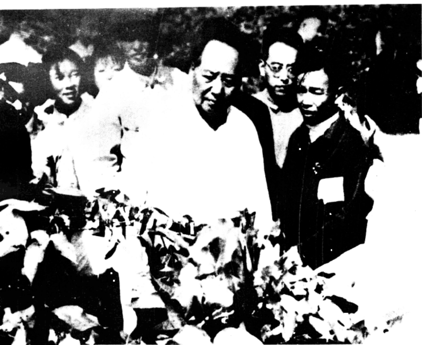
1959年9月24日，农业技术员贾启文在向毛泽东主席介绍棉花情况。