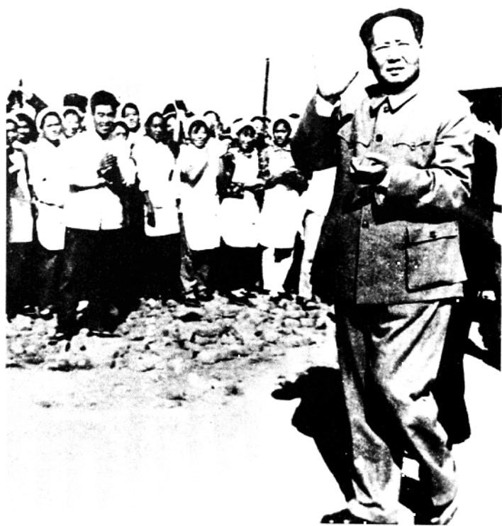
1959年9月24日，毛泽东主席视察邯郸时， 在国棉二厂接见邯郸纺织工人。