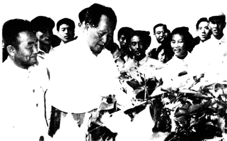
1959年9月24日，毛泽东主席在看成安棉花丰产方地边的牌子。