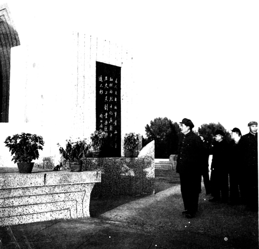
1952年11月1日，毛泽东主席参谒晋冀鲁豫烈士陵园。