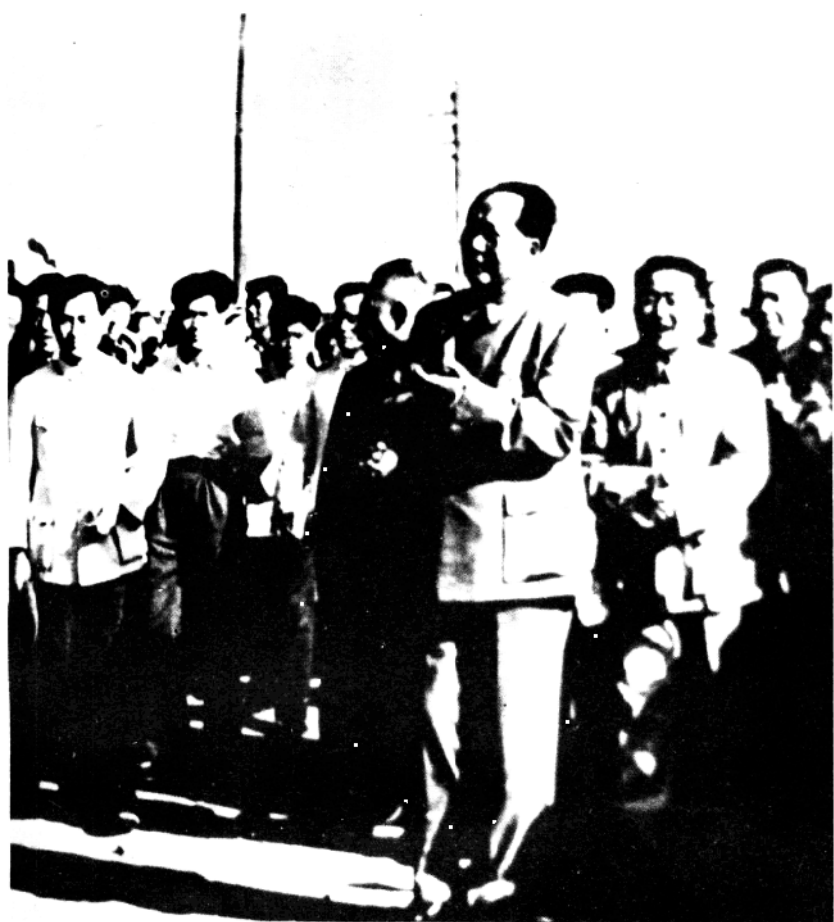
1959年9月24日，毛泽东主席视察邯郸时， 在国棉二厂接见邯郸纺织工人。