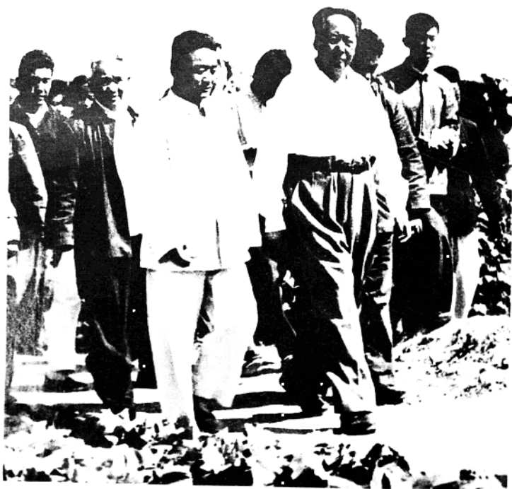
1959年9月24日，毛泽东主席视察成安时，在庞均等人的陪同下，走在棉花丰产方的小路上。