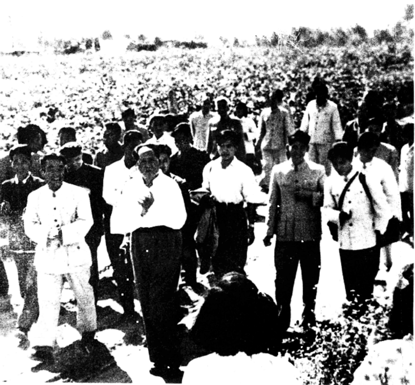
1959年9月24日，毛泽东主席视察成安。下车后，他一边向群众招手致意，一边向棉花丰产方走去。