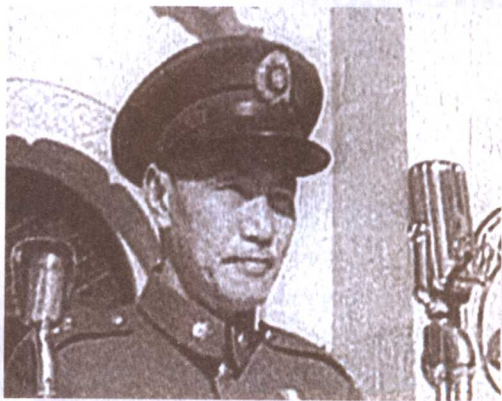
蒋介石已掩饰不住即将下台的内心隐痛

晚上，在灯火通明的总统府内，蒋介石召集政府要员，研究中共所提八项和平条件。幕僚们因意见分歧不断发生争吵，蒋介石却板着面孔一句话也没说。此时的蒋介石