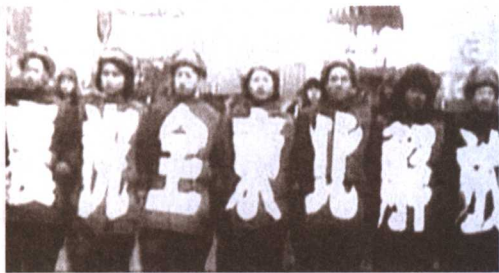
东北人民庆祝全东北解放