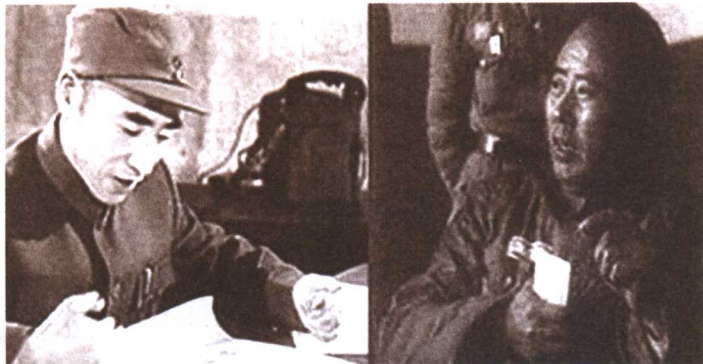
林彪与傅作义展开最后较量