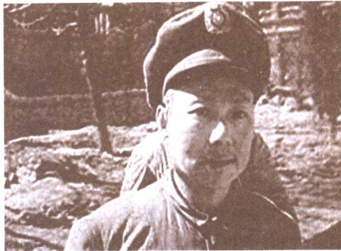
国民党天津警备司令陈长捷被俘