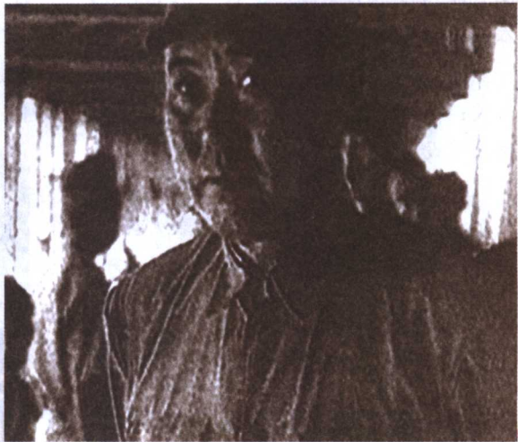
傅作义感到走投无路了