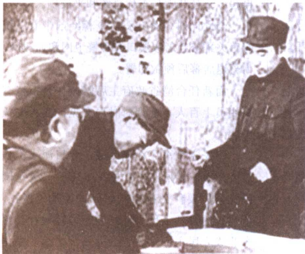
林彪下达了攻击天津的命令