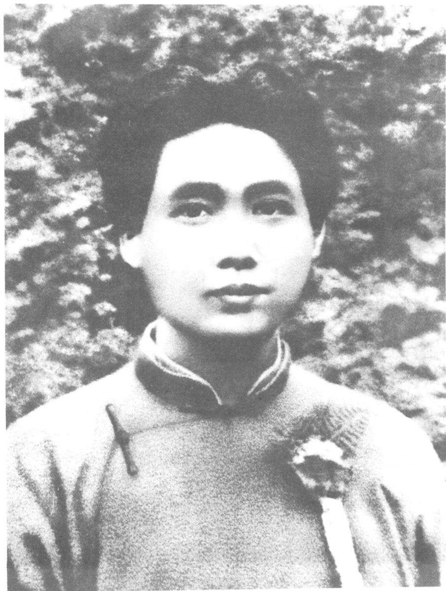
一九二四年的毛泽东