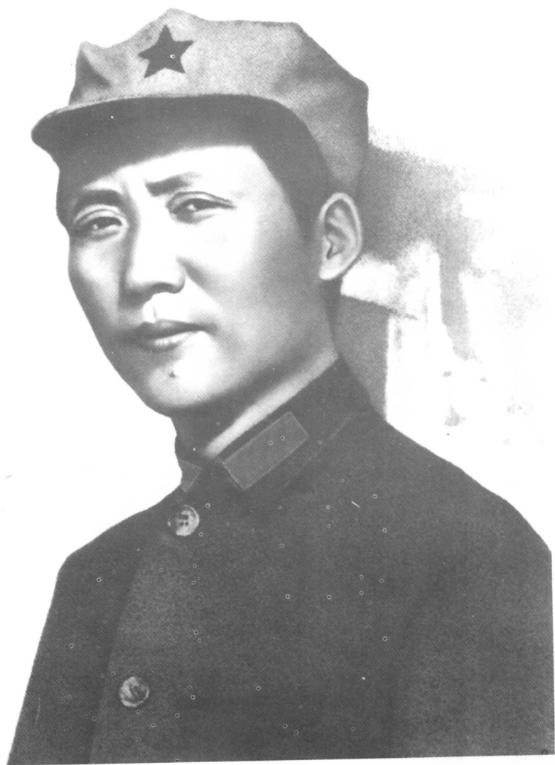
一九三六年的毛泽东