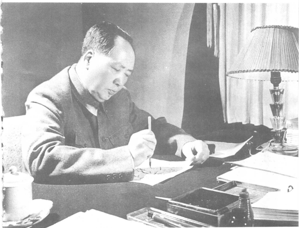
一九六一年毛泽东