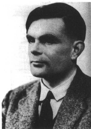
图 1-1 阿兰·图灵

计算机界的泰斗——图灵 (Turing) ① (图 1-1) 曾经做过一个梦。梦中他与隔壁的一个人聊天，谈了很多事情。聊天结束，他走到隔壁，想见见这个人，却只看到一台计算机。原来一直陪他说话的是这台计算机。这便是著名的“图灵测试 ② ”的一个形象化的故事。让计算机像人一样地思考，与人自然交流，也就是所谓的“人工智能 (Artificial Intelligence)”，它一直是计算机行业的梦想。所以我们给计算机又起了一个可爱的昵称——电脑，期望其能与人类相当，控制机器做出像人甚至超越人的事情。