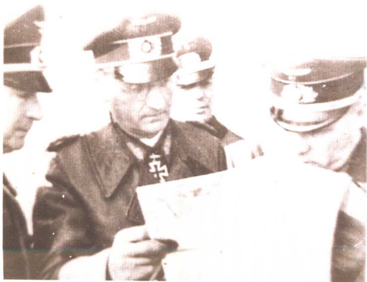
1944年隆美尔 与 B 集团军群的同 僚们在研究作战计划