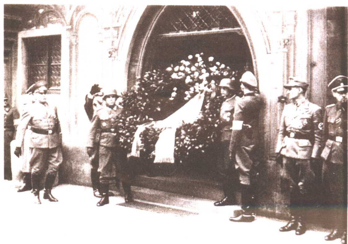
下图为隆美尔死后希特勒送的花圈