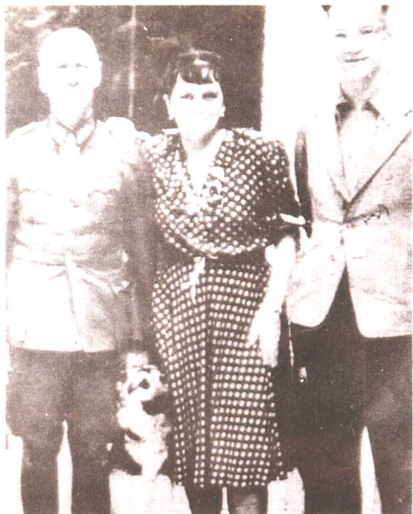
在盟军进攻诺曼底前夕，隆美尔与其子在赫林根为其夫人庆祝生日