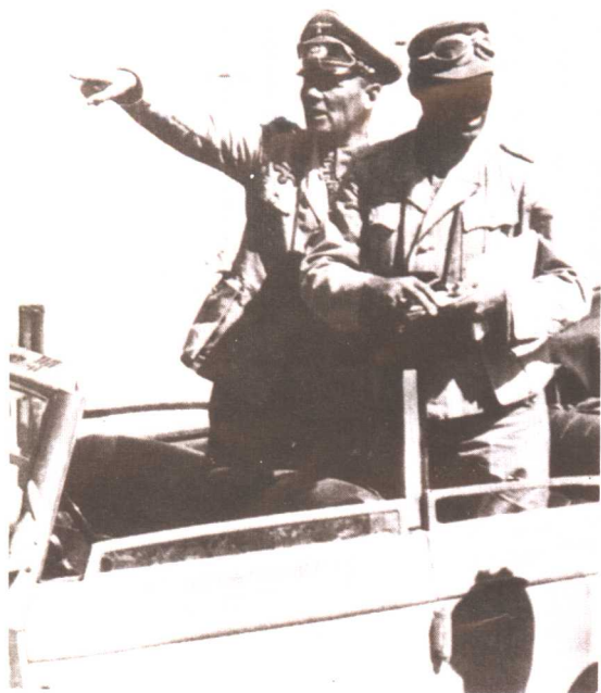
隆美尔在北非战 场指挥作战