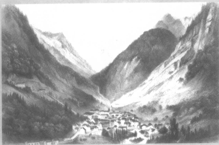
高特莱景观。《阿塔·特罗尔》故事发生地。