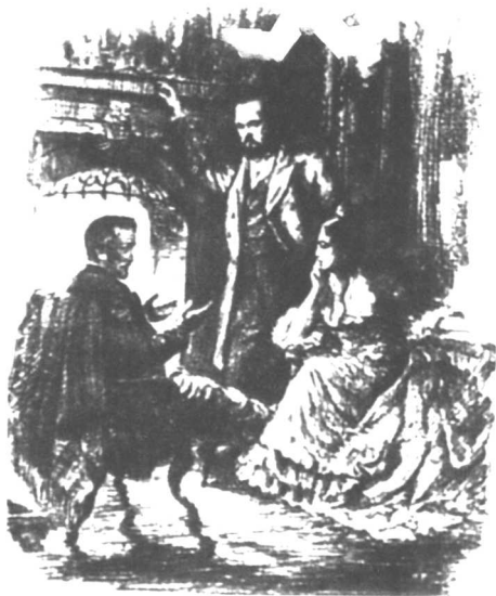
海涅拜访马克思夫妇，1844年巴黎。