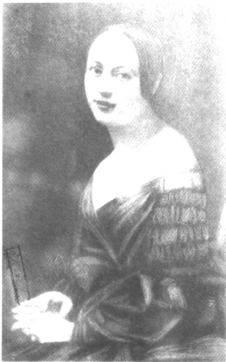
海涅之妻玛蒂尔德。