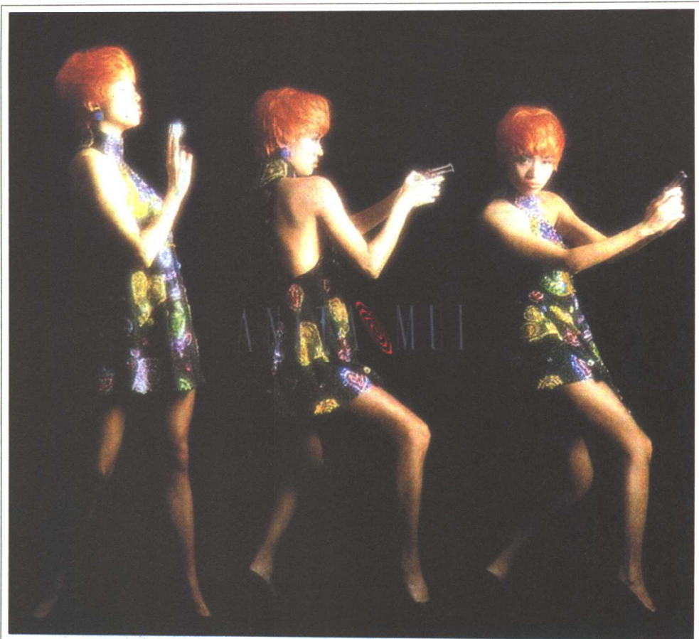
■ 百变梅艳芳 梅艳芳的邦 女郎造型。

最好，不是吗？她没费吹灰之力就最终战胜了一个貌美如花、痴情哀怨的女妓。听她的歌也是这样，大多数人还是喜欢那种看上去斯斯文文，有点优雅，有点脆弱，能够寄托自己的浪漫人生幻想的女子。而梅艳芳的歌就和麦当娜一样，太娱乐化，或者说有点风尘气。