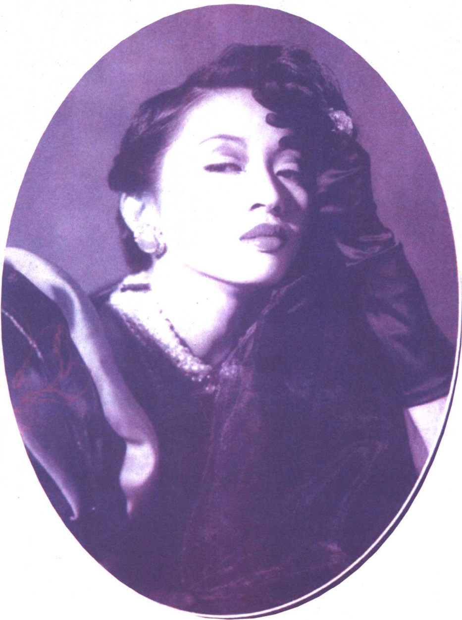
■ 百变梅艳芳 梅艳芳冷艳气质的绝佳展示。