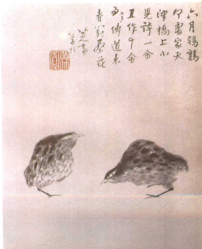
五 花鸟山水册之五