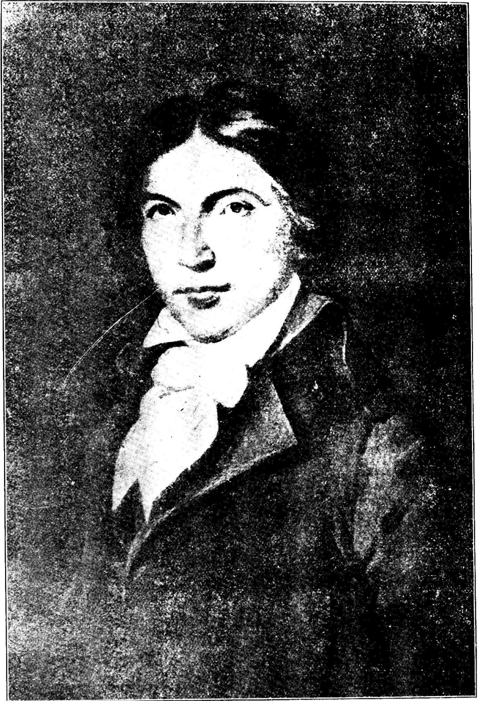
倫保德者記聞新年少命革吹鼓