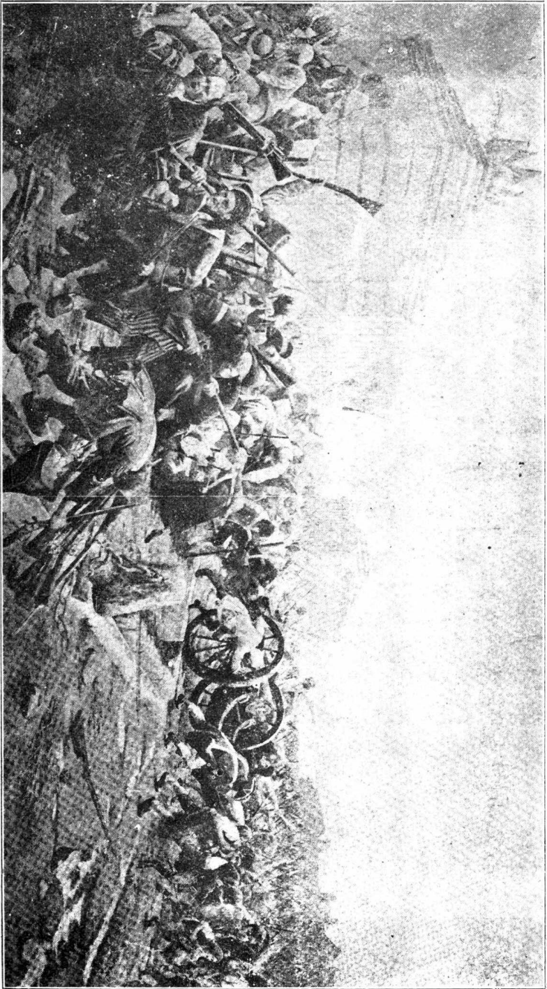
庫 軍 取 奪 民 市 黎 奪 巴