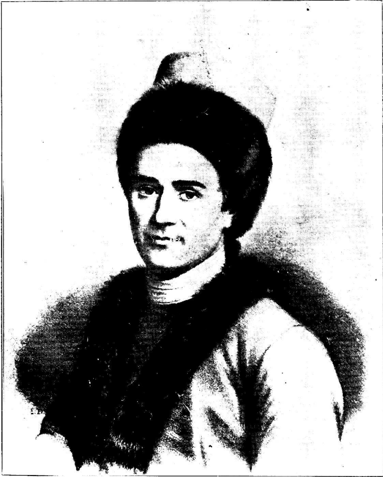
提 倡 民 權 主 義 之 盧 騷