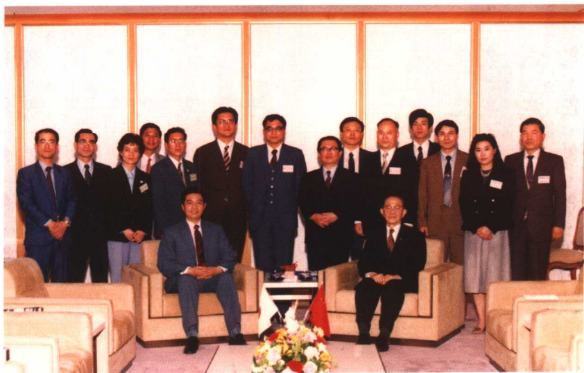
1985年3月8日，福冈县知事在福冈会见胡锦涛，作者陪同翻译。