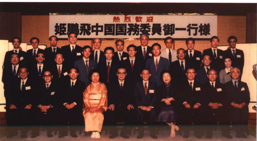
1984年，国务委员姬鹏飞与福冈财政界代表人士合影。