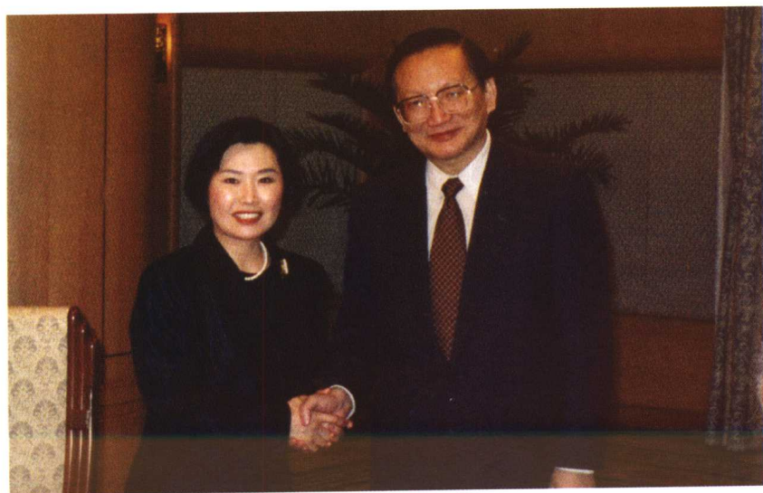
2001年，与外交部部长唐家璇合影。