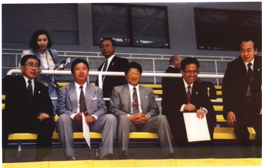
1997年，国务委员李铁映考察福冈体育馆，作者陪同翻译。