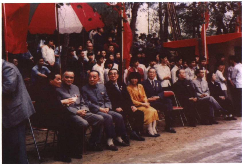
1981年，作者陪同福冈市进藤一马市长访问广州市，并与当时任市长杨尚昆同志亲切交谈。