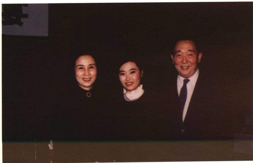
1985年，作者与驻日本大使宋之光及夫人合影。