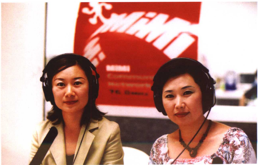
2003年，作者在福冈广播电台主持节目。