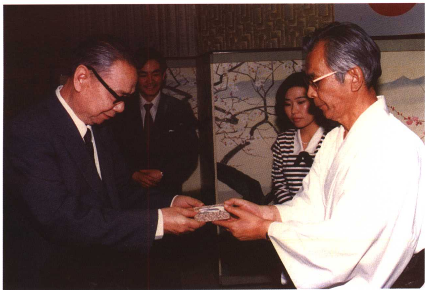
1984年，国务委员姬鹏飞访问福冈，作者陪同翻译。