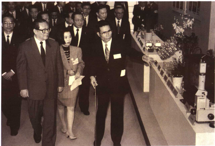
1992年，江泽民总书记访问福冈，作者陪同翻译。