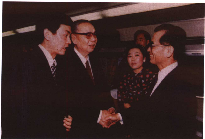
1984年，国务委员姬鹏飞到达福冈，作者陪同翻译。