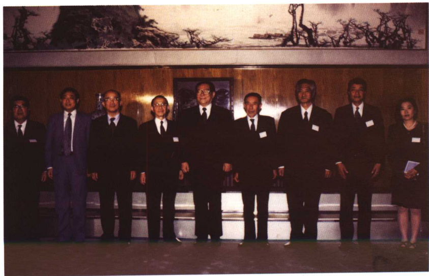
1992年，江泽民总书记在中南海会见福冈县知事奥田八二，作者陪同翻译。