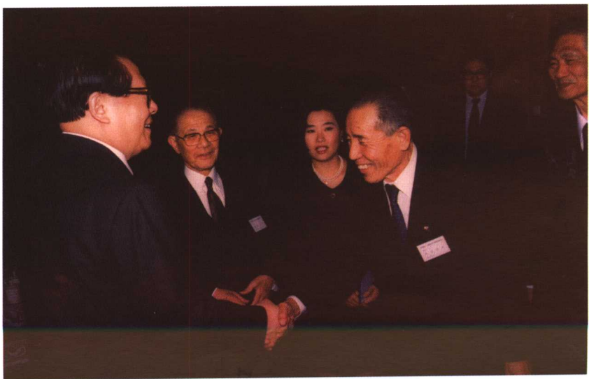
1992年，江泽民总书记在中南海接见福冈县议会议长，作者陪同翻译。