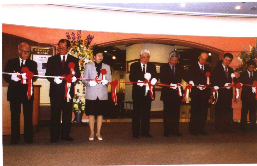
2001年，在福冈文迟书法展开幕仪式。