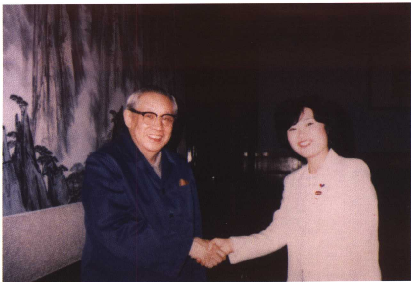
1981年，作者在人民大会堂与中日友协会会长廖承志先生合影。