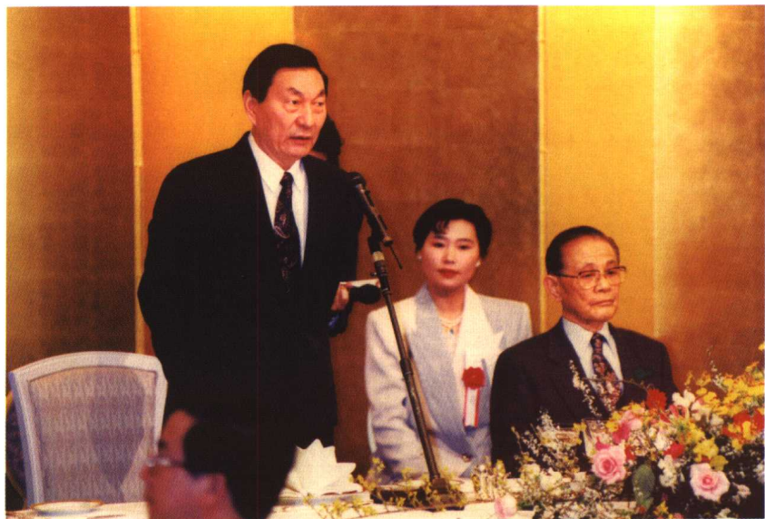
1997年，朱镕基总理访问福岡，作者陪同翻译。