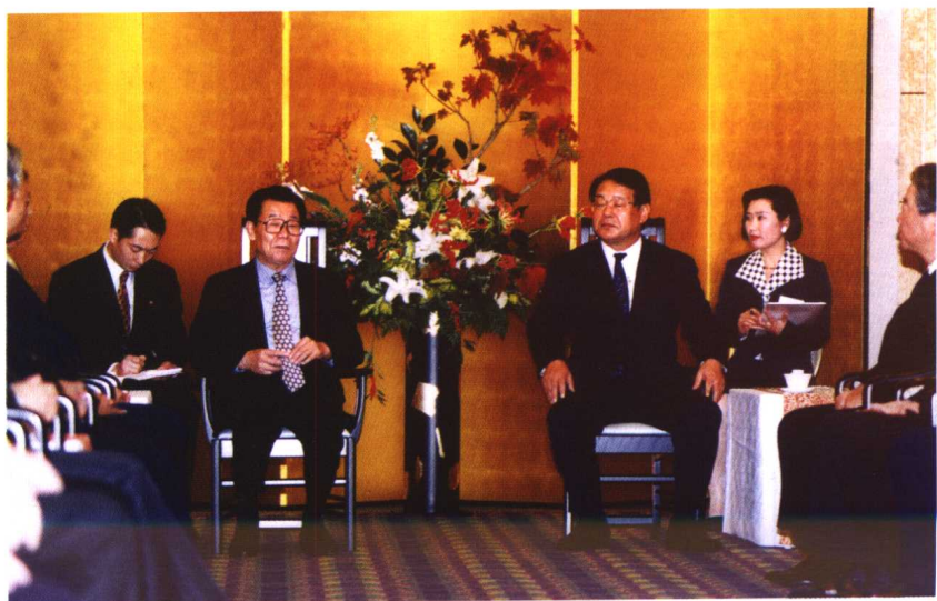
2000年，麻生渡福岡县知事在福岡会见政协主席李瑞环，作者陪同翻译。