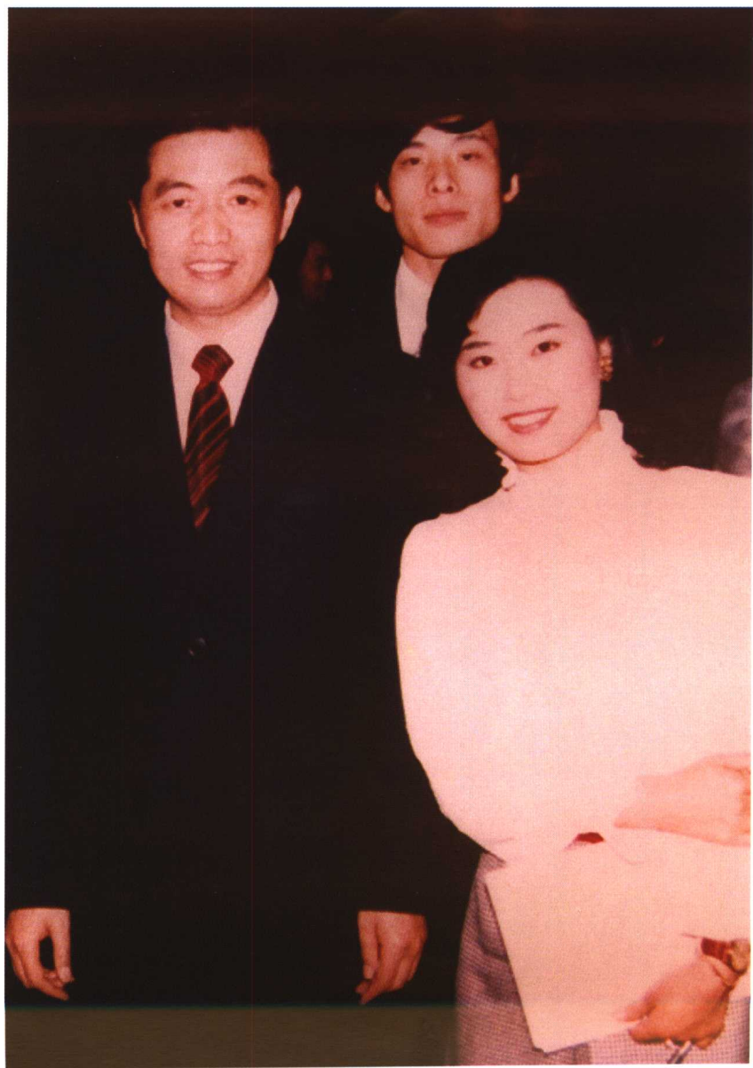
1985年，胡锦涛访问福冈，作者陪同翻译。