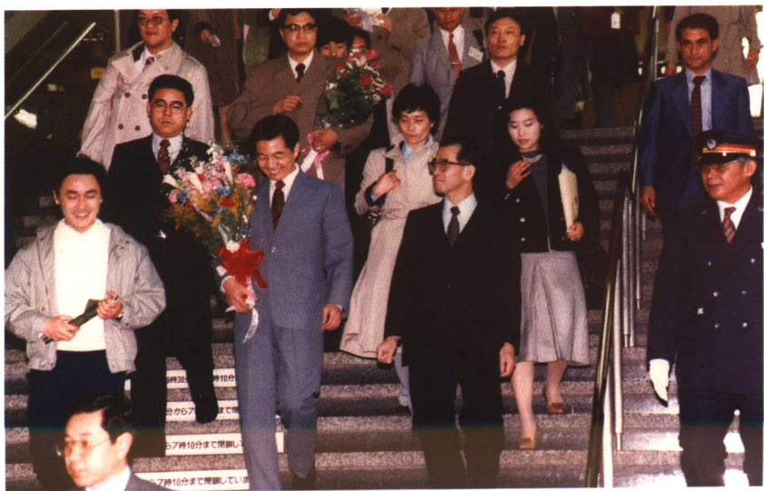
1985年，胡锦涛到达福冈，作者陪同翻译。