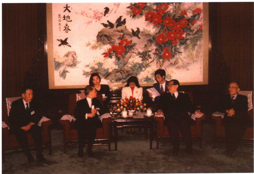
1992年，江泽民总书记在中南海会见福冈县知事奥田八二，作者陪同翻译。