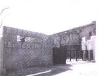
北师大附属实验中学

河南省实验中学是直属于河南省教育厅的省重点中学，是国家教育部“现代教育技术实验学校”，中央教科所“中小学学习问题研究实验基地”，河南省基础教育实验基地。