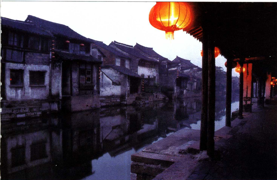
◎ 江南忆，最忆是西塘