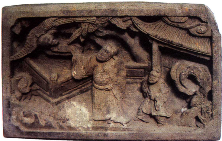
○ 宋代砖雕“大户仪门”

从西塘古镇归来，眼前一帧帧黑白照片般清晰的印象在交替缓行。古镇村口那两棵高高的古银杏接云擎天，壮汉般伟岸；一条条深巷与河道纵横错落，七绕八弯，交织穿梭如同渔网一