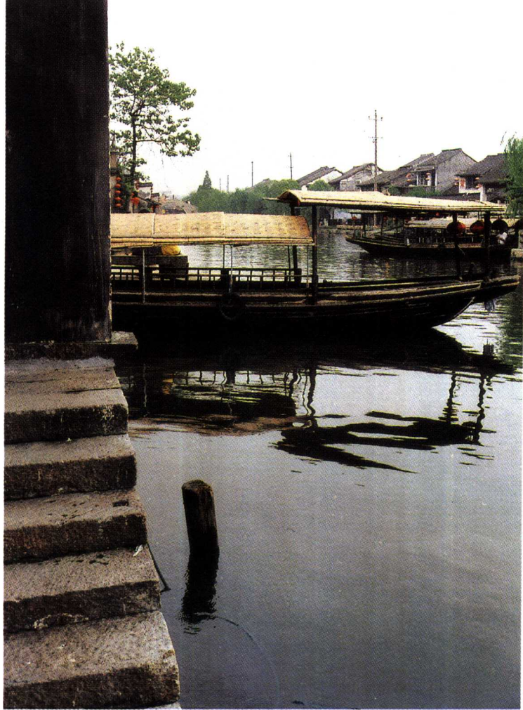
○ 汾湖的丰润，滋养了“吴根越角”这片土地

间光阴倏忽已悄悄跨越了无数个世纪。两千五百多年前，吴国和越国两地相争，金戈铁马一场场波澜，但最后也没能割裂两地唇齿相依的亲缘。“吴越大地”，这个如今江苏省和浙江省依然相亲为邻、共同携手繁盛的代名词，就是那万千子孙后代心中的一片蓝图。