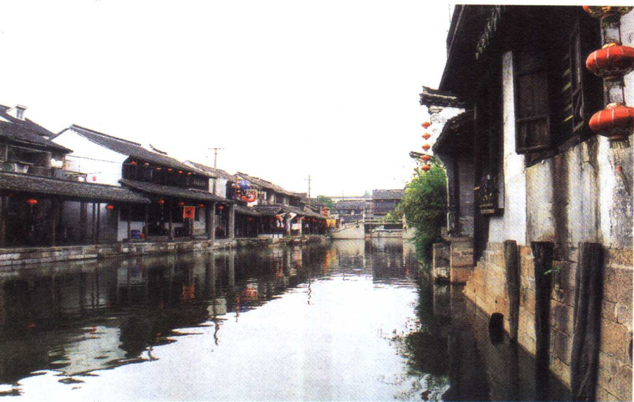
○ 现存史料记载说,早在千年前西塘就开始逐渐形成了集镇

吧。如今看来,就一般所具备的历史知识而言,人们心中的江南古镇,大多是以明清时期繁荣的历史为标志的。这种见解有它一定的合理性,但这仅是一种表象。江南小镇上一般现存的古桥老宅大多是明清建筑,这已得到了普遍的论证。但要真正探究各个古镇的悠久历史,还得通过当地一些出土文物来进一步深入考证。