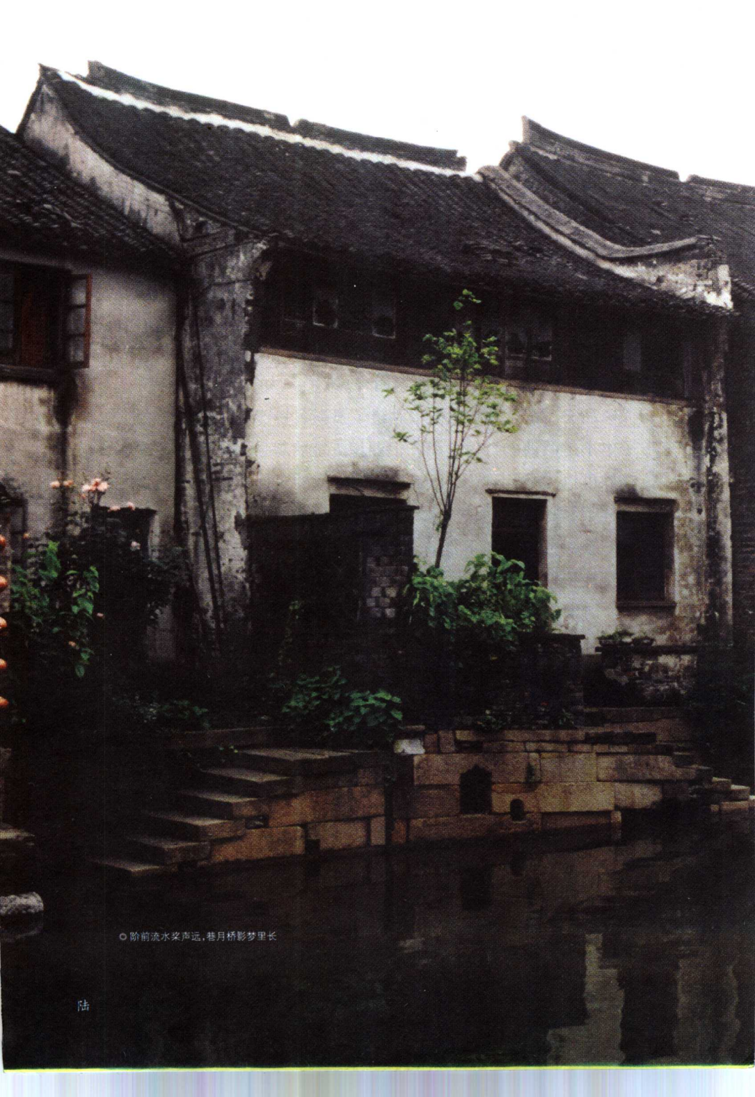
○ 阶前流水浆声远，巷月桥影梦里长