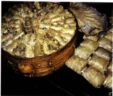
西塘民间的美食诱人又馋人

中一首《西塘晓市》弥漫着清鲜的生活气息：“旭日满晴川，翩翩贾客船。千金呈百货，跬步塞齐肩。布褐解市语，童鸟识伪钱。参差渔网集，华屋竞烹鲜。”曾被称作“斜塘”的江南水乡古镇西塘，自古就得了