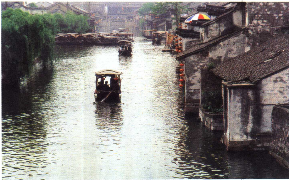
○早在六千年前的新石器时代,就有人类在这一带土地上劳动生息

当然,有的古镇庆幸自己祖上留下了一些文字史料。如江南水乡周庄,有文字记载它有九百年的文明发展史。而地处这“吴根越角”的西塘,应该说也值得引以为豪,现存史料记载说,早在千年前西塘就开始逐渐形成了集镇。还有说得更早些的,相传早在战国时期,伍子胥在江南一带兴修水利,足迹就曾遍及江浙。形成集镇的另一个原因,是与人类的聚集生息和文明创造密切相关。1981年,从浙江省魏塘镇台基村出土的陶片、石凿、兽骨等文物说明,早在六千年前的新石器时代,就有人类在这一带土地上劳动生息。